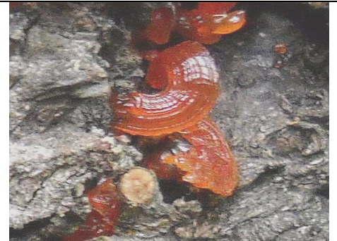
ANTHOSTOMA DECIPIENS, INGRANDITA