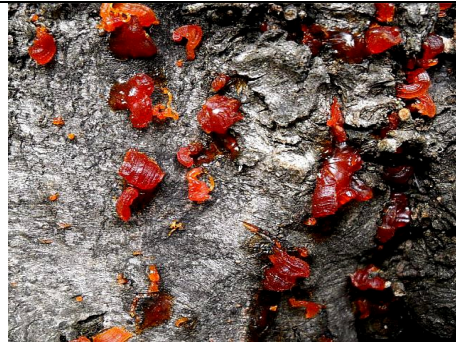
ANTHOSTOMA DECIPIENS IN HABITAT