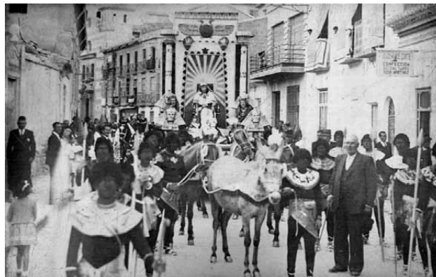
Lámina 9. Carroza de la reina de Saba a su paso por la calle Lope Gisbert. Fotografía Pedro Menchón de 1936 (Archivo Histórico Municipal de Lorca).

el relato bíblico de 12.000 caballos de silla (1 Reyes 4, 5-6). La figura del rey en su carro se bordó en el magnífico medallón del manto (Lám. 10) dirigido por Emilio Felices en 1932.