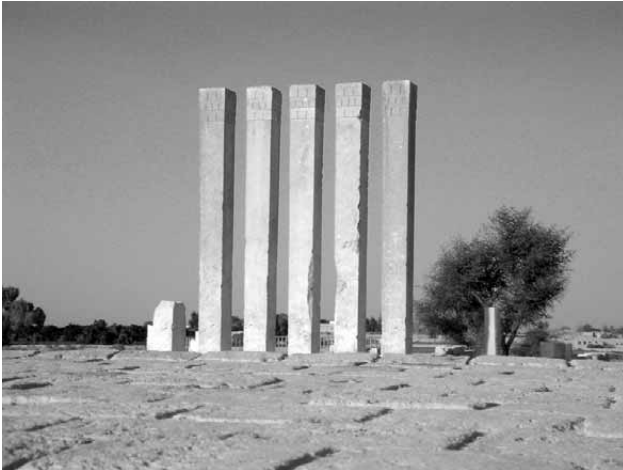
Lámina 2. Templo de Al-'Amaid (Marib).