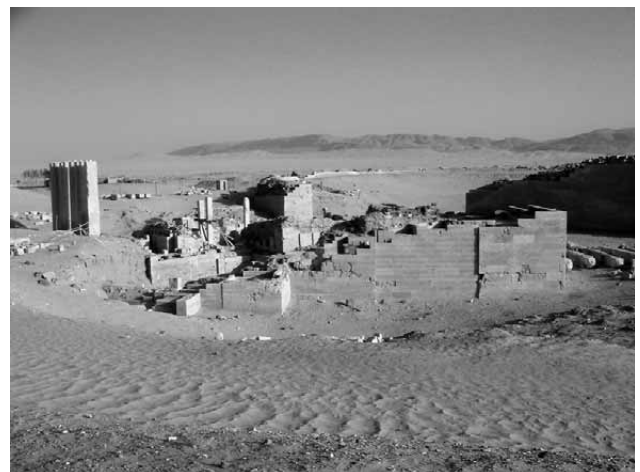
Lámina 1. Templo de Awán (Marib), conocido popularmente como Mahram Bilquis .