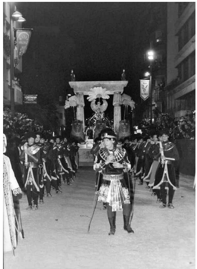
Lámina 14. Carroza de la reina de Saba en la actualidad a su paso por la avenida Juan Carlos I.