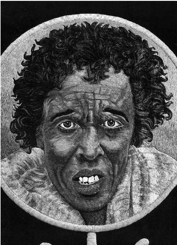
Lámina 13. Bordado del medallón de la capeta del Negro, caballería de la reina de Saba.

Según se recoge en la revista El Cortejo de 1973, en el año 1971 se estrena una nueva carroza de reina Balkis, cuya descripción viene a coincidir con la de la carroza precedente; el grupo se compone de corte, esclavos y esclavas, guerreros a pie y caballería, destacando ésta por la maravilla de las capetas que lucen los jinetes. El nombre de Balkis, con que se denomina a la reina de Saba, es recogido de la tradición que fue convirtiendo a la reina de Saba del relato bíblico en un personaje mítico, al igual que el supuesto hijo que tuvo con Salomón, llamado Manelik y que se incorpora a las procesiones en 1970. Actualmente es el personaje que abre el grupo de la reina de Saba en su visita a Salomón, desfilando montado sobre una biga inspirada en los carros egipcios del Imperio Medio y Alto.