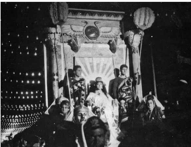
Lámina 11. Carroza de la reina de Saba a su paso por la avenida de los Mártires. Fotografía de 1944.