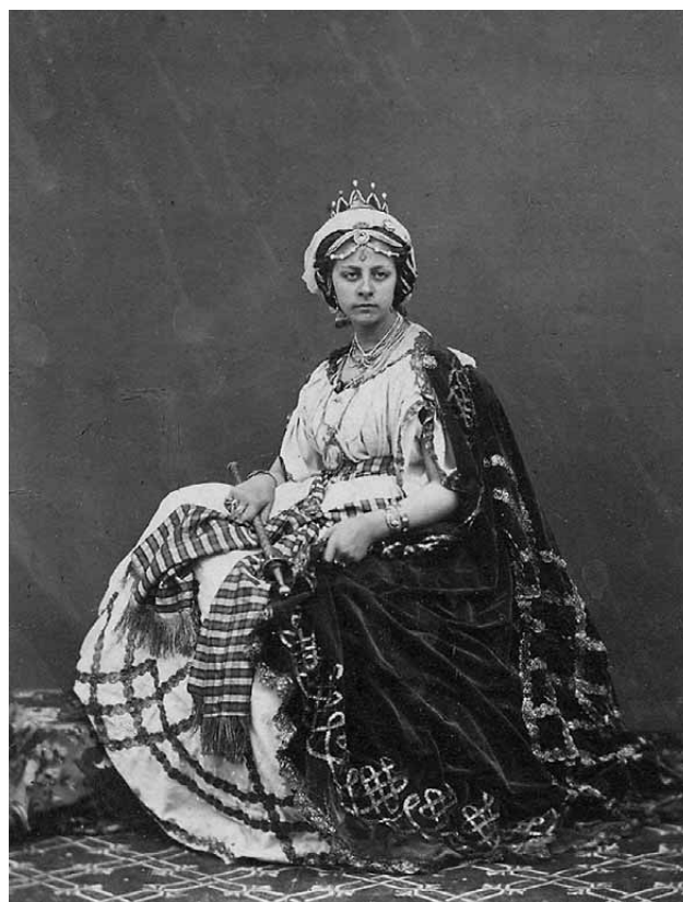
Lámina 7. Reina de Saba. Fotografía de José Rodrigo de hacia 1865 (Archivo Histórico Municipal de Lorca).

El año 1892 la reina de Saba, junto a otra serie de personajes bíblicos como Debora, Asuero, Esther, el ejército de Josué, participaron en las procesiones de Huércal-Overa (MUÑOZ, 2005: 148-149). Hecho que hace precisar a Domingo Munuera que el cortejo lorquino mantuvo una clara influencia fuera de los límites del término municipal de Lorca, irradiando su