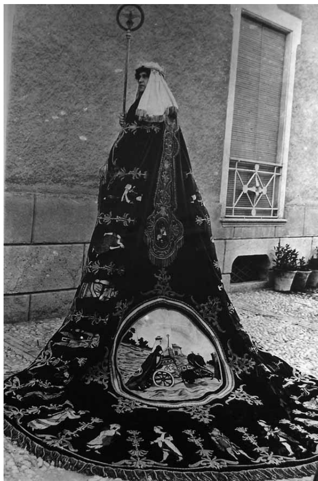
Lámina 10. Manto de Salomón en su estreno.

el relato bíblico de 12.000 caballos de silla (1 Reyes 4, 5-6). La figura del rey en su carro se bordó en el magnífico medallón del manto (Lám. 10) dirigido por Emilio Felices en 1932.