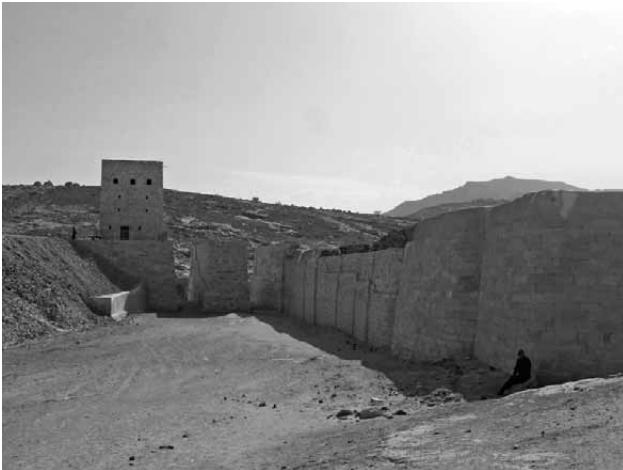
Lámina 3. Dique de la presa de Marib.

que actualice 4 con motivo de la conferencia impartida en la capilla del Rosario (Lorca) y que he intentado ordenar para escribir este trabajo que espero sea del interés del lector de la revista.