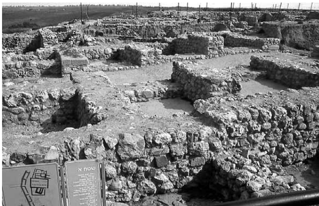
Lámina 4. Puerta de Hazor (Israel).