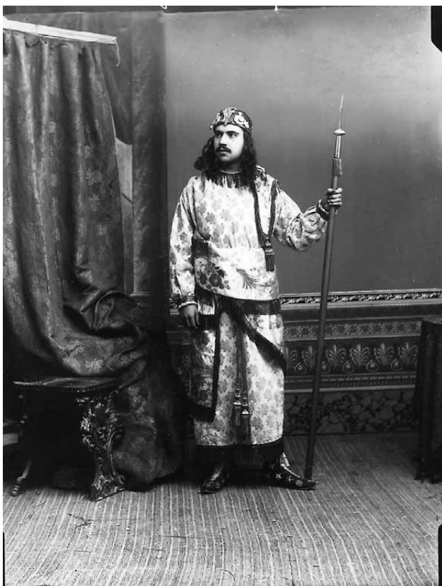
Lámina 8. Personaje de la corte de Salomón.

El rey Salomón desfilará a partir del año 1936 sobre lujosísima biga (CAMPOY, 1998: 110) acompañado por una caballería. La decisión de que este rey saliera en las Procesiones de Lorca en una biga fue acertada, ya que el caballo y el carro fueron importantes factores militares de la época de Salomón, que disponía según