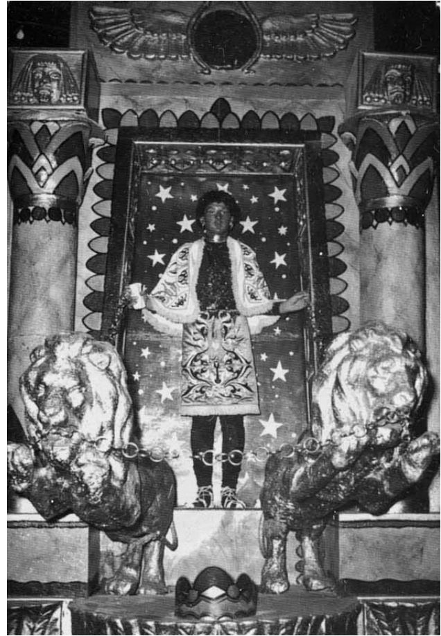
Lámina 12. Parte posterior de la carroza de la reina de Saba a partir de 1944. Imagen sacada del libro de J. M. Campoy titulado Real e Ilustre Archicofradía de Nuestra Señora del Rosario. Paso Blanco .

nio formara parte de los ejércitos como mercenario o como esclavo traído de Etiopía o del país del Punt 14 .