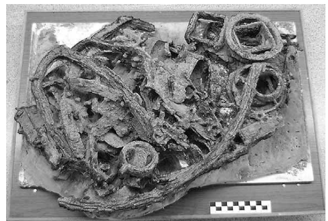
Lámina 6. Carro ibérico del siglo IV a.C. hallado en las excavaciones de la calle Corredera, 46 (Lorca). Fotografía de Juan García Sandoval realizada durante el proceso de limpieza y consolidación.