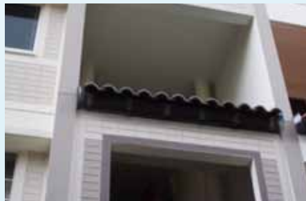
Wire mesh has been installed at the eaves of blocks to prevent roosting.

Feeding the pigeons increases both the pigeon population and the rodent population in your estate!