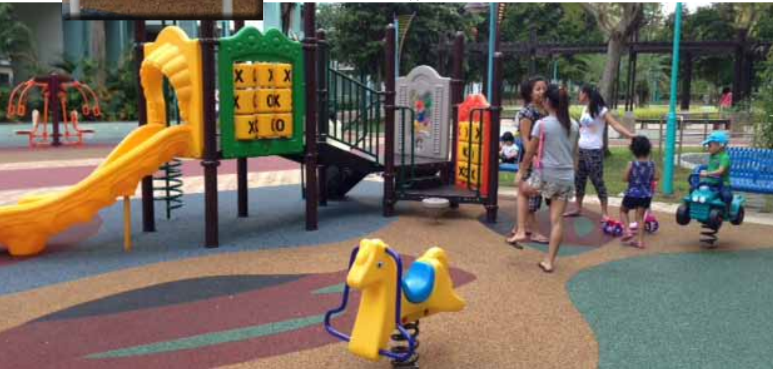
Playground at Block 316A Anchorvale Road

With close consultation with residents and planning that sometimes takes months of care, the Town Council constantly builds improvements around the town like linkways, new shelters and playgrounds. Here are the latest.