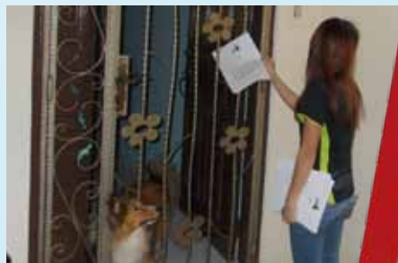
The Town Council visits residents with flyers.