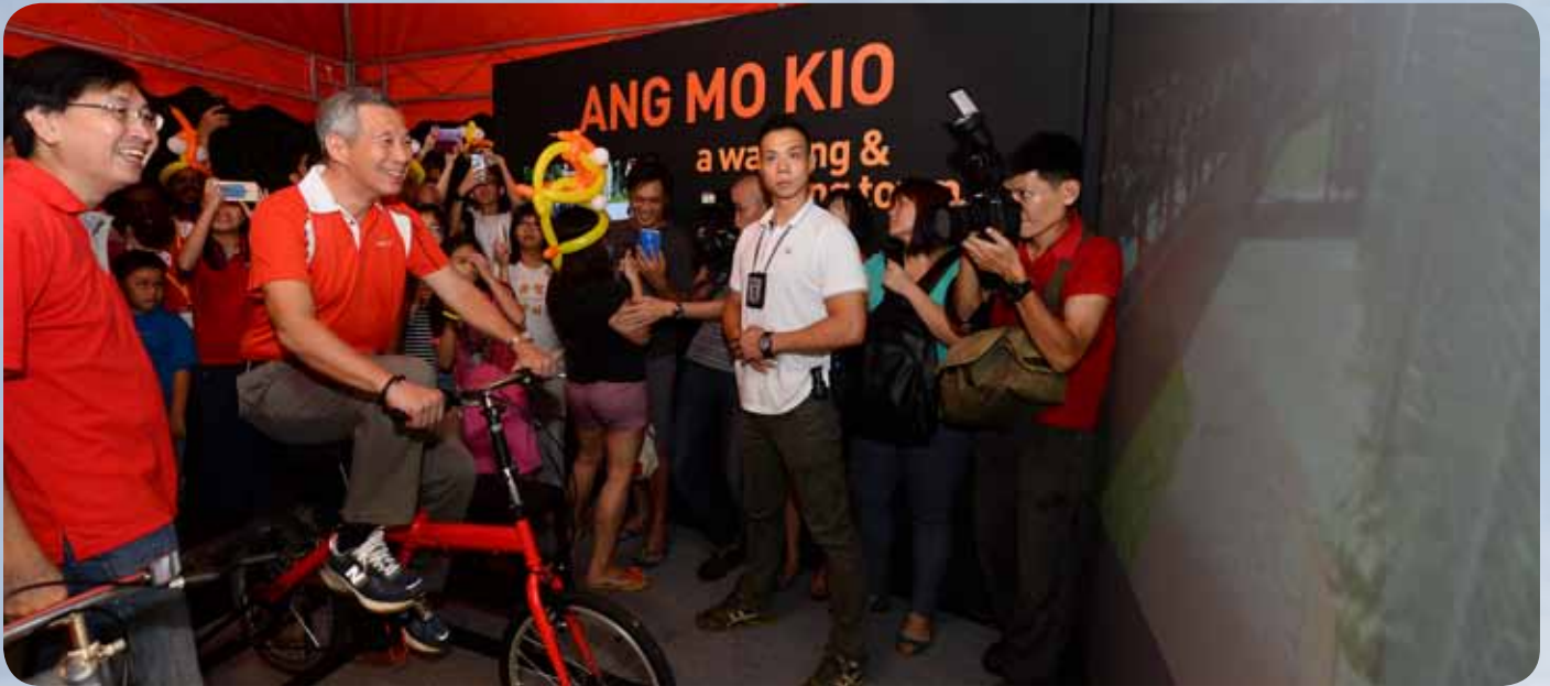
PM Lee Hsien Loong tried the cycling simulator at the big Countdown party at Bishan Park.

Our Town welcomed 2015 at a huge party held on the Grand Lawn at Bishan-Ang Mo Kio Park.