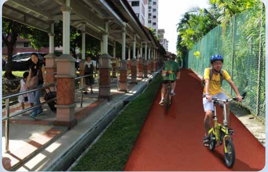
Dedicated foot and cycling paths will make travel smoother for everyone.