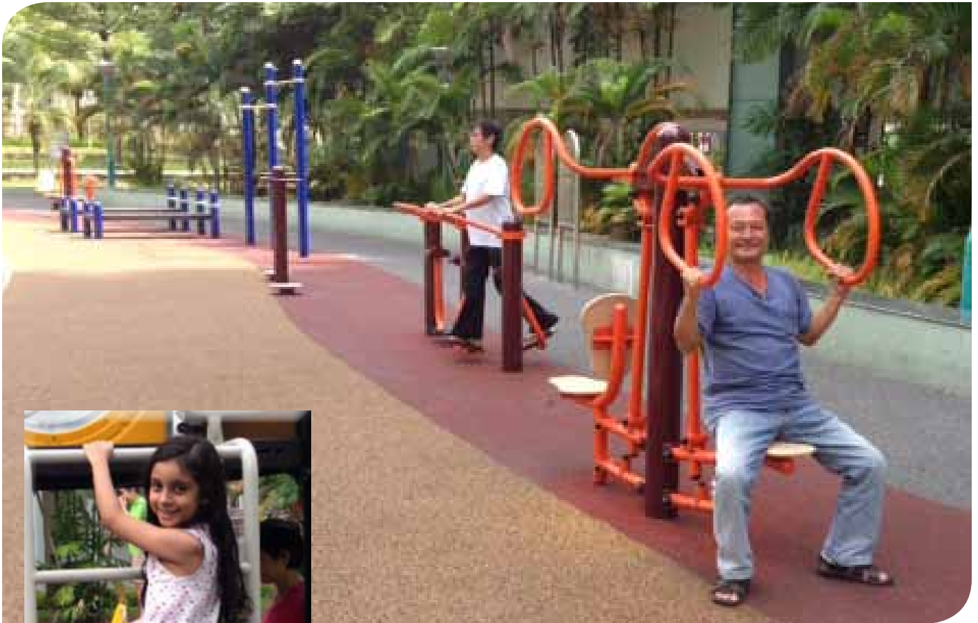
Elderly fitness corner at Block 315A Anchorvale Road