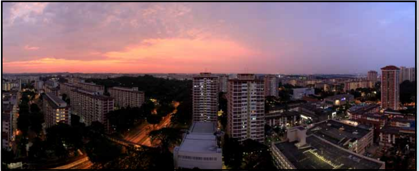
"Hazy Evening" by Tay Li-Cheng

Congratulations to the five winners of the photo entries. Each one receives a $30 voucher!