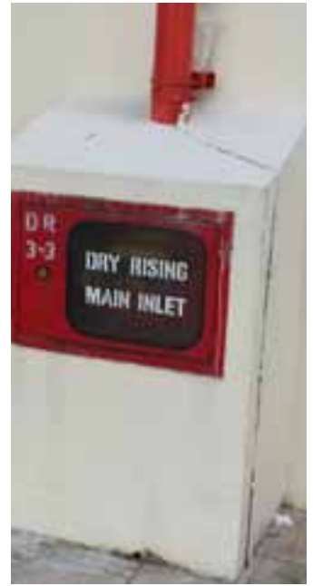
Unobstructed dry risers.

குப்பை போடும் குழாய் தீப்பிடிப்பதைத் தடுக்க: