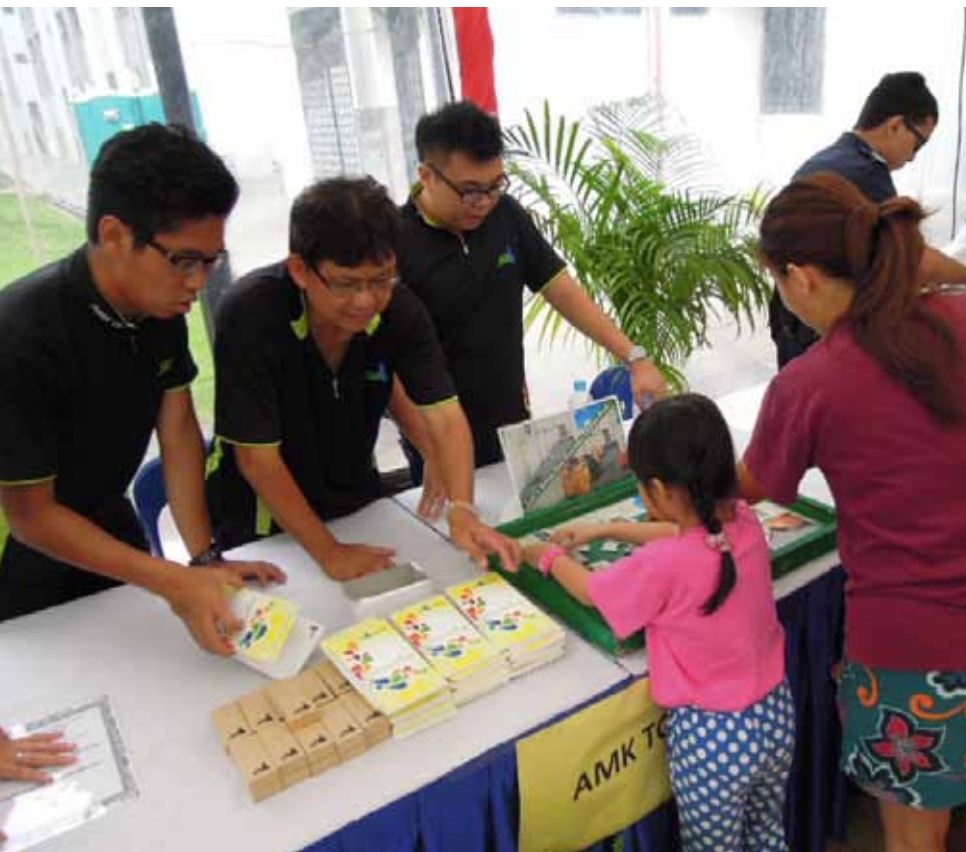
Staff from the Town Council help residents learn about preventing fires through games, leaflets and advice at grassroots events.

The Singapore Civil Defence Force responds to more than a thousand fires in rubbish chutes each year. Working with them, the Town Council takes active measures to prevent these fires from happening – but they need your help to keep everyone safe.