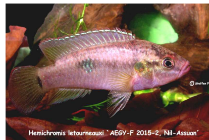
Hemichromis leuorneauxi AEGY-F 2015-2, Nil-Assuan