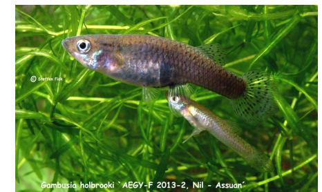
Gambusia holbrooki AEGY-F 2013-2, Nil - Assuan