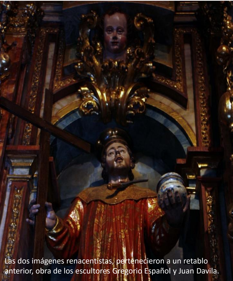
Las dos imágenes renacentistas, pertenecieron a un retablo anterior, obra de los escultores Gregorio Español y Juan Davila.

En su representación , como son médicos, visten gabanes con mangas y cubren sus cabezas con bonetes. Portan en una de sus manos los instrumentos de su oficio y en la otra, una cruz como señal del martirio. Los alfanjes en el cuello aluden a la forma en que fueron martirizados.