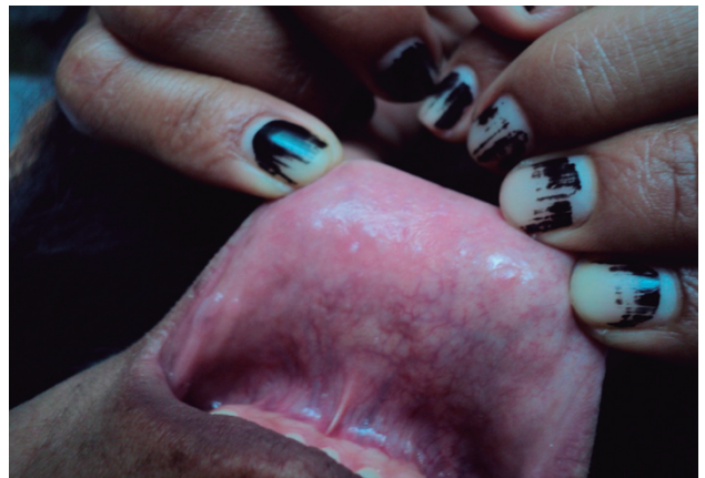
Fig. 3: pápulas en mucosa de labio inferior.

La enfermedad de Heck es una patología poco frecuente de la mucosa oral, con una prevalencia que oscila entre el 3 y el 17% en ciertos grupos étnicos 5 como indios americanos y esquimales. En América del sur es más frecuente en el Amazonas de Perú, Venezuela, Colombia, Bolivia, Brasil y Paraguay. En nuestro país la mayoría de los casos se presentan en el norte (Salta y Jujuy) 6 .