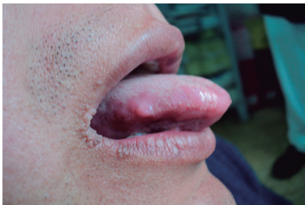
Fig. 1: pápulas de superficie lisa y bordes netos en lengua, mucosa de labio y comisura labial.

Caso 2: Madre de familia de 30 años de edad, oriunda de Jujuy, quien presenta pápulas de similares características en mucosa de labio inferior (Fig. 3).