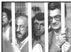
La gabbia degli accusati