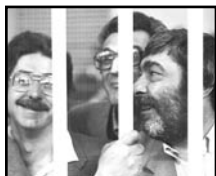
Toni Negri e Massimo Cacciari