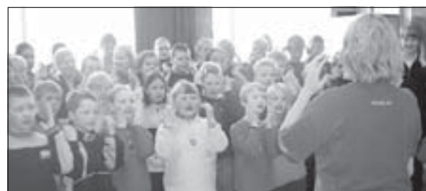
Morgunstund í Grunnskóla Önundarfjarðar.

Allir nemendur koma saman á sal skólans á hverjum morgni þar sem jákvæð hugtök eins og kurteisi, umburðar-