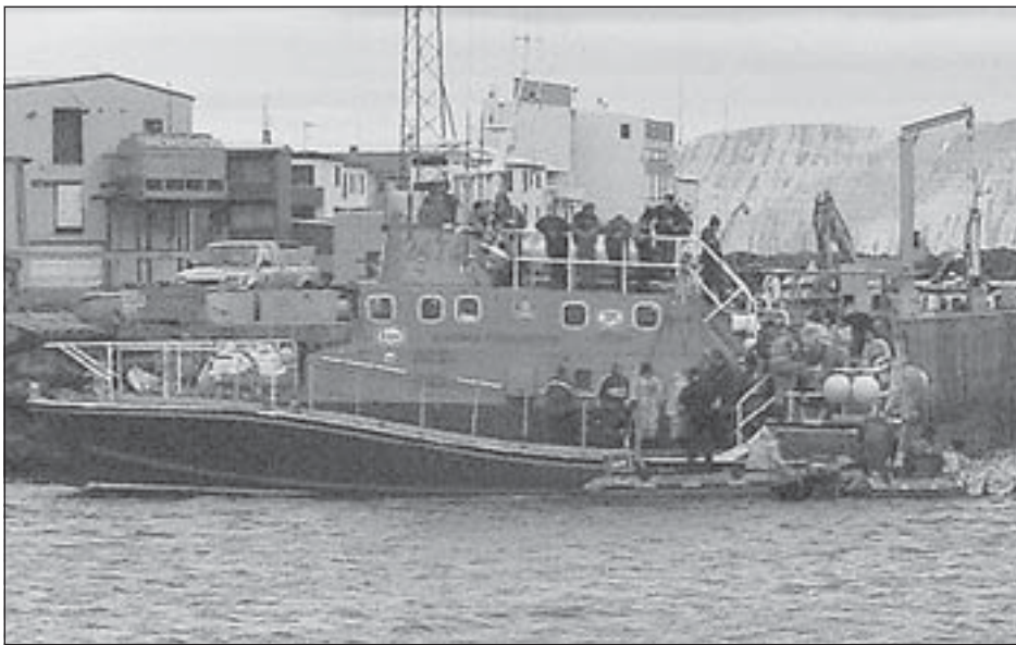
Nýliðarnir um borð í Gunnari Friðrikssyni á sunnudag.

Meðal annars var farið með nýliðana í sjóferð á björgunarskipinu Gunnari Friðrikssyni og gúmmíbátar Björgunarfélagsins prófaðir. Síðan var m.a. farið í æfingar í sigi utan á olútönkum Skeljungs á Ísafirði og farið í nokkur atriði varðandi snjóflóðaleit. Æfing þessi og kynning stóð allan daginn.