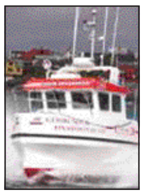
Guðmundur Einarsson. Bolungarvík

Stofnað 14. nóvember 1984 • Sími 456 4560 • Vefang: www.bb.is • Netfang: bb@bb.is • Verð kr. 200 m/vsk