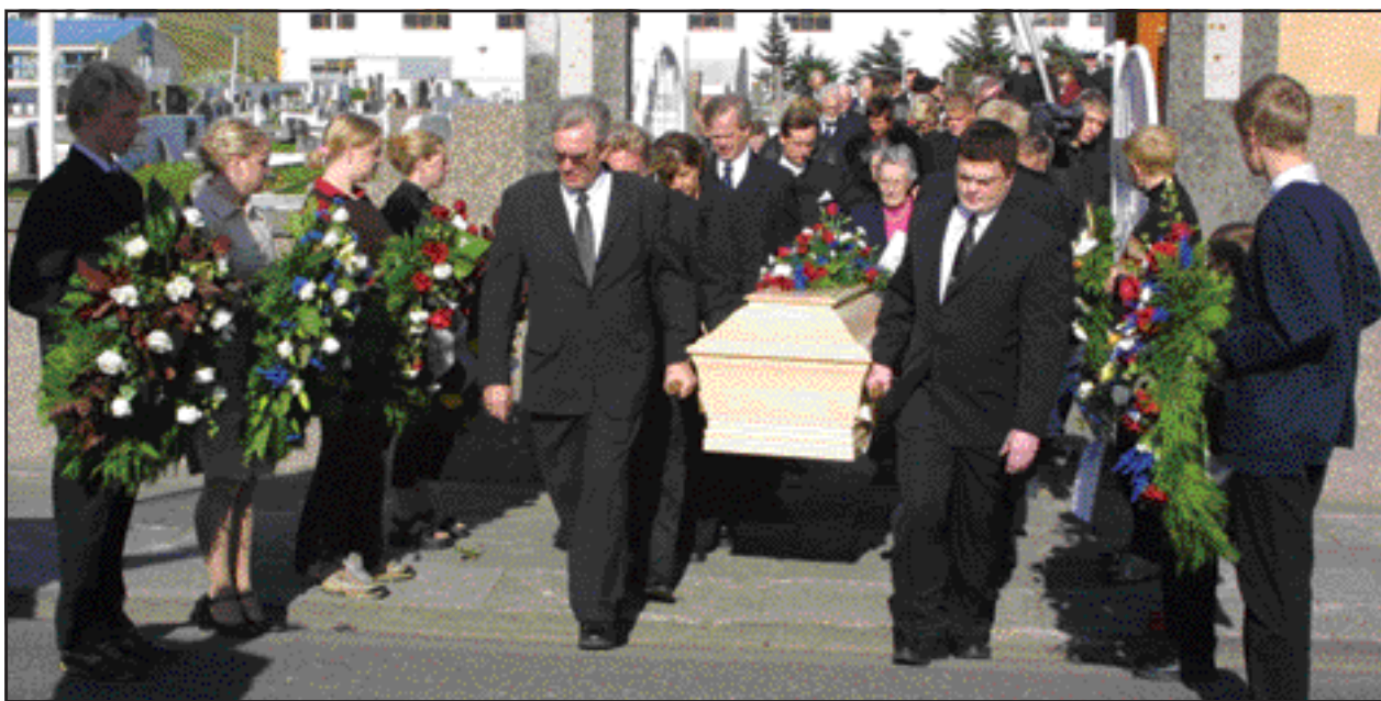
Fulltrúar Ísafjarðarbæjar bera kistu skáldsins og heiðursborgarans úr kirkju á Ísafirði.

Að henni lokinni var kistan flutt að Holti, þar sem Guðmundur Ingi var jarðsettur í nýrri viðbót sem gerð hefur verið við Holtskirkjugarð og sr. Stína blessaði við þetta tækifæri. Þessi viðauki er efst í garðinum og sér þaðan heim að Kirkjubóli, þar sem skáldið fæddist og ól aldur sinn langa ævi. Guðmundur Ingi var jarðsettur í kistu úr íslensku birki