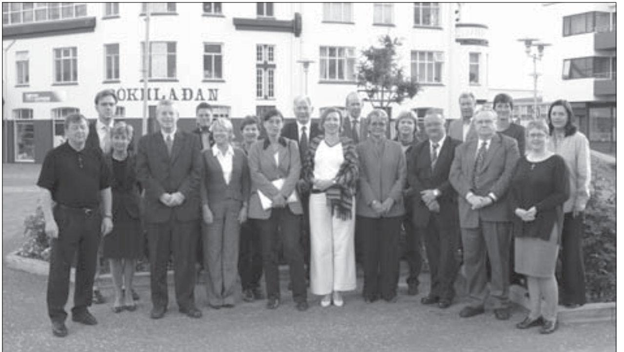
Þingmannahópurinn á Silfurtorgi á mánudaginn.

„Það er árvisst að við norrænu þingmennirnir hittumst til þess að undirbúa okkur fyrir