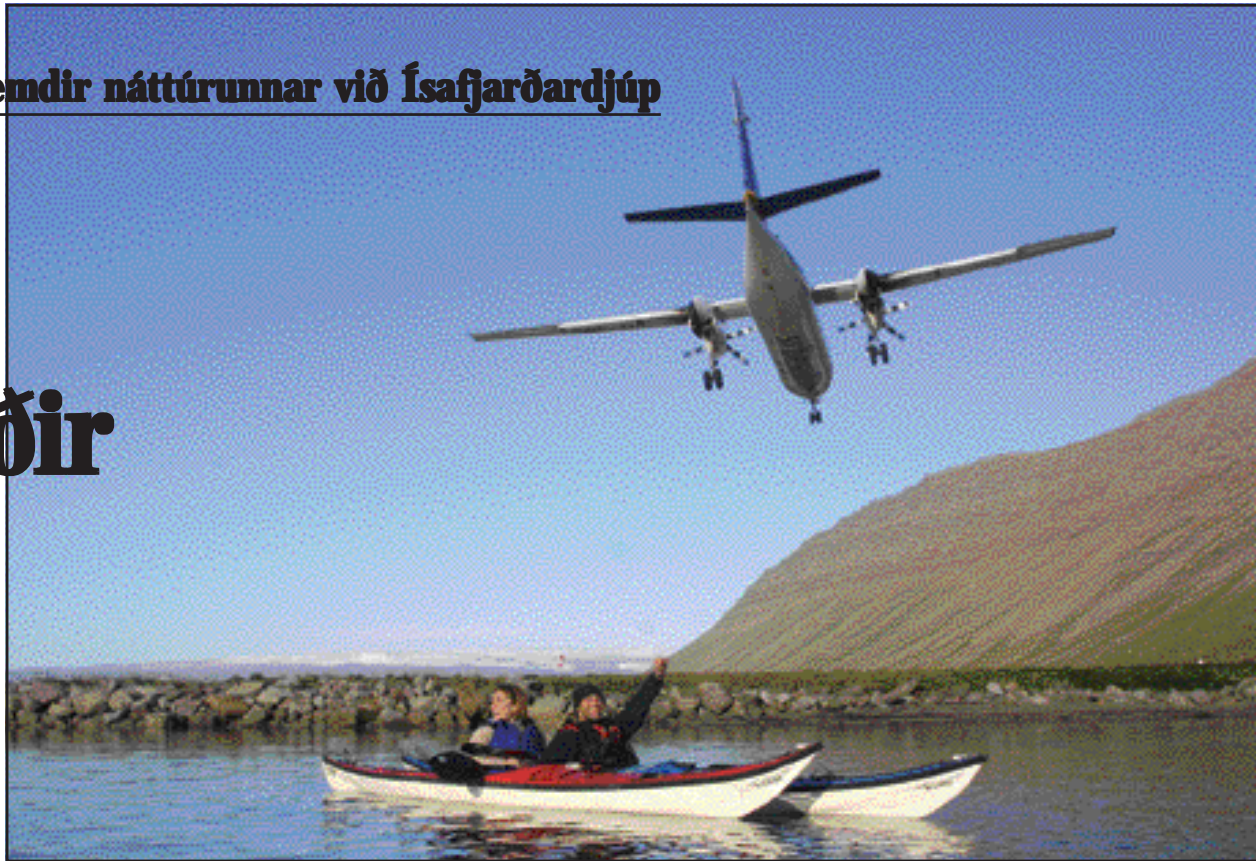
Spænska blaðafólkið við landtökuna við flugbrautarendann á Ísafirði eftir kajakferð úr Suðurtanganum.

ferðir eru „prufukeyrðar“. Meðal annars fóru þau til Bolungarvíkur og út í Vigur. Síðdegis á föstudag reru þau á kajökum undir leiðsögn heimamanns úr Suðurtanganum á Ísafirði yfir á Ísafjarðarflugvöll. Þau tóku land við suður-enda flugbrautarinnar og gengu þaðan til flugstöðvarinnar og fóru síðan flugleiðis suður. Tímaritið sem um ræðir kemur út fjórum sinnum á ári. Það er allt hið glæsilegasta og