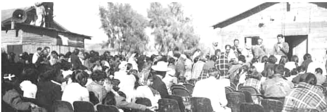
Samkoma á verndarsvæði Apahceindíananna