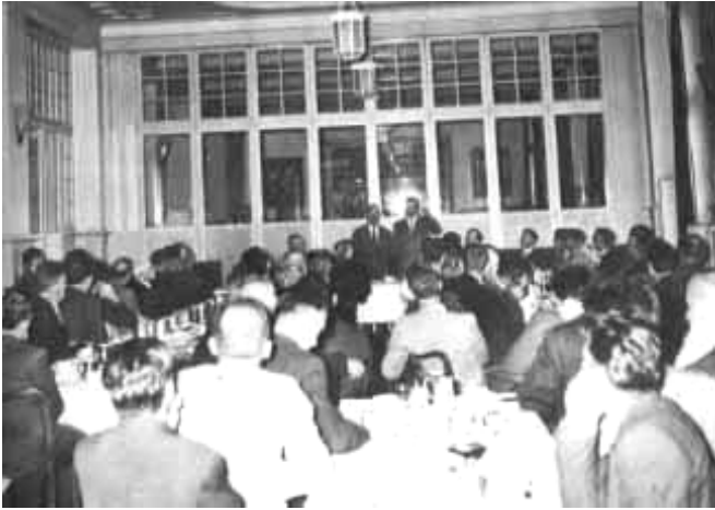
Mynd 4: Lausanne í Sviss

“Alveg eins og í Zürich tveimur mánuðum áður, var þessi seinni Evrópuferð hans