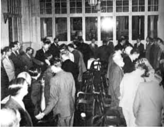
Mynd 2: Lausanne í Sviss