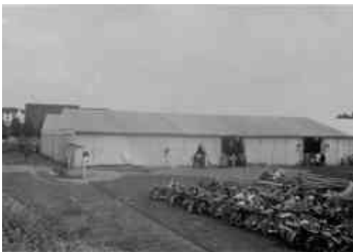
Tjaldkapellan nálægt Karlsruhe