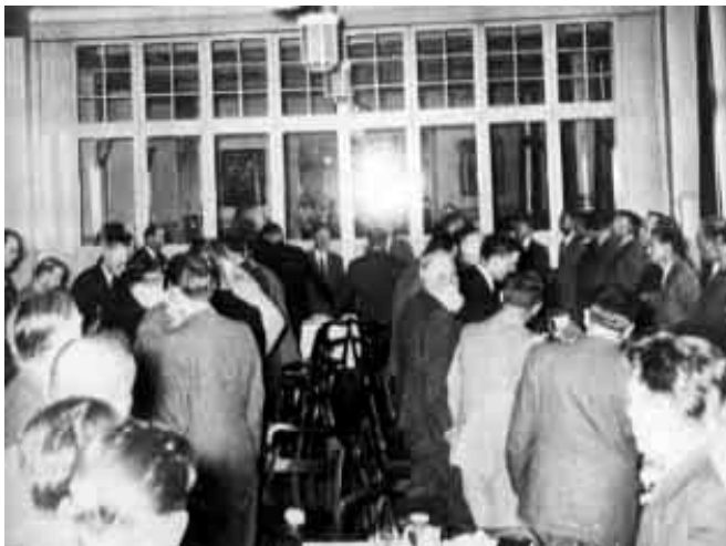
Mynd 3: Lausanne í Sviss