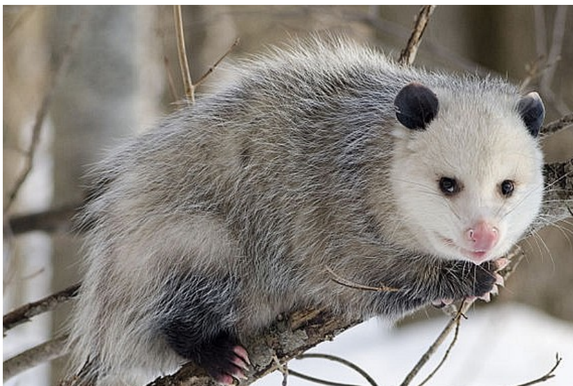
Pokarotta ( Didelphis virginiana )