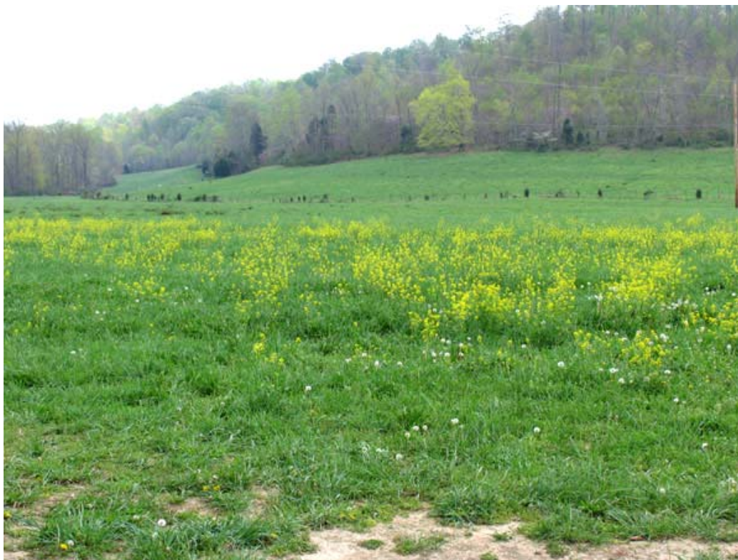
Dalverpi skotveiðimannsins (Sportsman's Hollow)

skotveiðimannsins,” því eitt sinn sá hann 16 íkorna þarna. Þeir sátu allir uppi í sama tré, en hann skaut aðeins takmarkaðan fjölda þeirra og leyfði síðan hinum að sleppa, sem var íþróttamannslegt. Núna stóð hann í austurhlíðunum, fyrir ofan dalverpið og