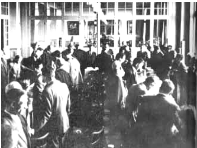
Mynd 1: Lausanne í Sviss

Varlega borðaði ítalinn dálítið af eggi. Þegar sá biti fór vel í hann, réðst hann á mat sinn eins og maður, sem hefur rétt í þessu verið leystur úr fangelsi kommúnista. Bill spurði guðsþjónana við matarborðið: “Hvers konar fyrirbænaþjaldhugsanaflutning notaði þessu náungi?”