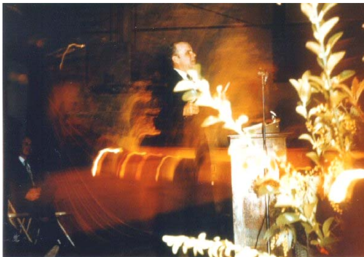
Mynd 2: Tekin í Lakeport í Kaliforníu

Hún sýndi hægri hlið William Branham, þar sem hann stóð fyrir aftan ræðupúltið og gerði bendingar með höndunum, meðan hann prédikaði. Karfa með liljum stóð við hægri hlið púltsins, hjá hljóðnema sem var festur á stöng. Hinum megin við púltið, var kassalaga rafmagnshitari, sem hékk niður úr loftinu. Tveir menn sátu á fellistólum aftarlega á sviðinu. Til hliðar við þessa menn var tjald, sem hékk niður úr loftinu. Annað hvort var það til skreytingar, eða það huldi eitthvað, sem ekki var hægt að færa auðveldlega.