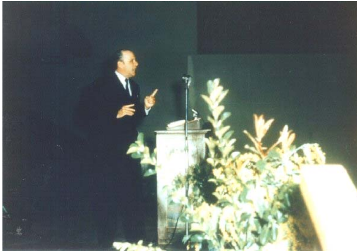
Mynd 1: Tekin í Lakeport í Kaliforníu

Hún sýndi hægri hlið William Branham, þar sem hann stóð fyrir aftan ræðupúltið og gerði bendingar með höndunum, meðan hann prédikaði. Karfa með liljum stóð við hægri hlið púltsins, hjá hljóðnema sem var festur á stöng. Hinum megin við púltið, var kassalaga rafmagnshitari, sem hékk niður úr loftinu. Tveir menn sátu á fellistólum aftarlega á sviðinu. Til hliðar við þessa menn var tjald, sem hékk niður úr loftinu. Annað hvort var það til skreytingar, eða það huldi eitthvað, sem ekki var hægt að færa auðveldlega.