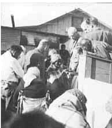
Beðið fyrir sjúkum meðal Apacheindíána

horfði á þessa litlu indíánaprinsessu, gagntók hann mikil hryggð. Skyndilega sá hann undarlega sýn. Hann sá sjálfan sig taka í hönd stúlkunnar, fljúga upp til himins með hana og saman gengu þau inn í hásetissal Guðs. Blóð Jesú var á hásetinu. Þetta blóð