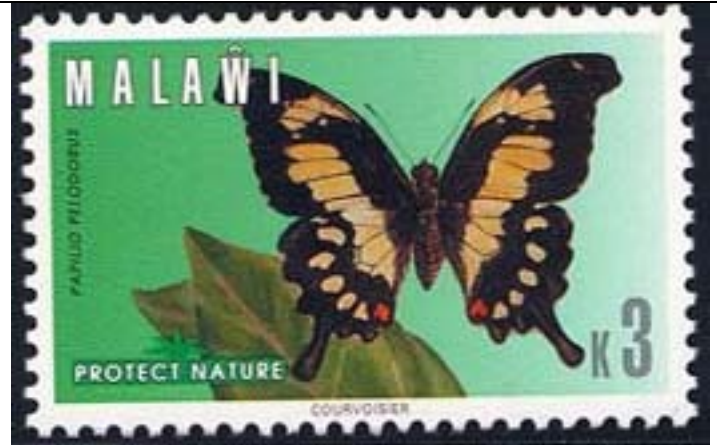
Lepidoptera : Papilionidae : Papilio pilodorus.