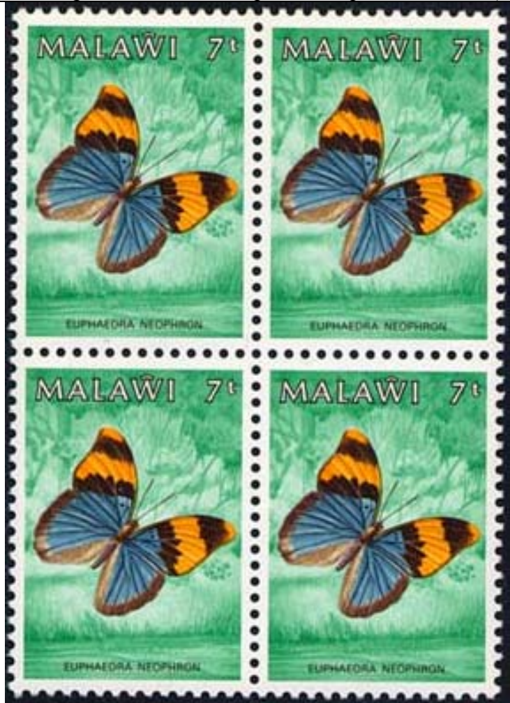
Lepidoptera : Nymphalidae : Euphaedra neophron .

1984 Agosto 1 : Idem, Mariposas, bloques de 4 sellos (4 valores) (Y & T : 436-439) (Scott : 450-453).