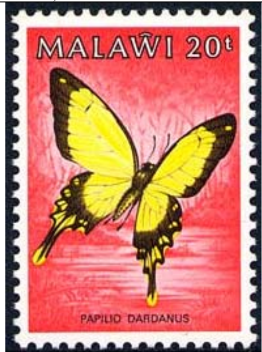
Lepidoptera : Papilionidae : Papilio dardanus .