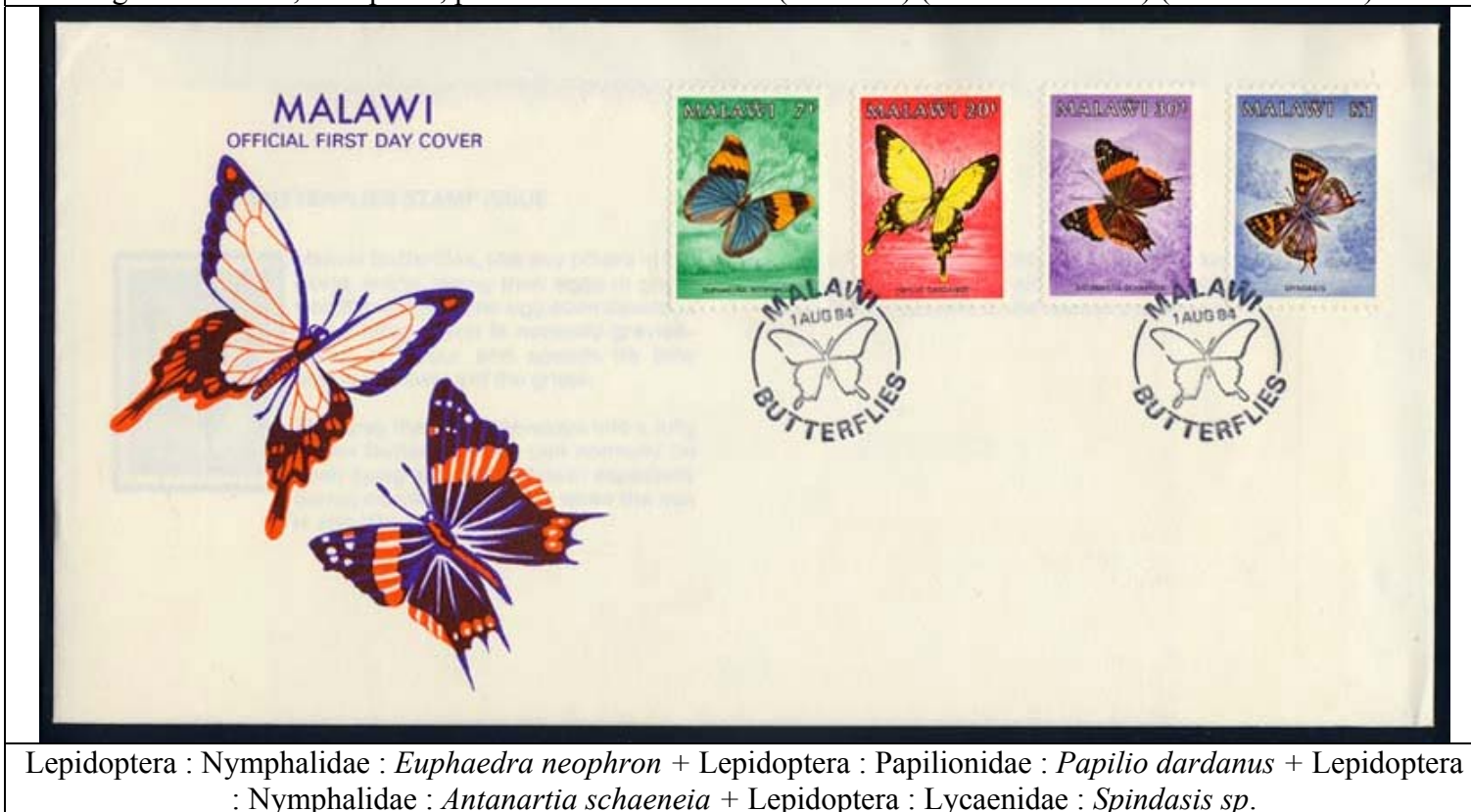
Lepidoptera : Nymphalidae : Euphaedra neophron + Lepidoptera : Papilionidae : Papilio dardanus + Lepidoptera : Nymphalidae : Antanartia schaeeneia + Lepidoptera : Lycaenidae : Spindasis sp.

1984 Agosto 1 : Idem, Mariposas, primer día de circulación (4 valores) (Y & T : 436-439) (Scott : 450-453).