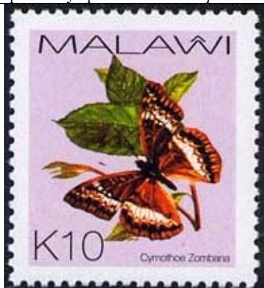
Lepidoptera : Nymphalidae : Cymothoe zombana .