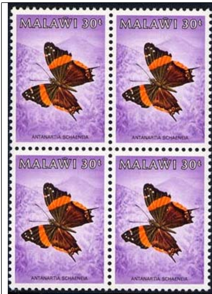
Lepidoptera : Nymphalidae : Antanartia schaeeneia .