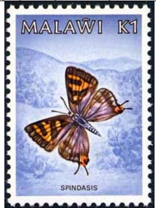
Lepidoptera : Lycaenidae : Spindasis sp.