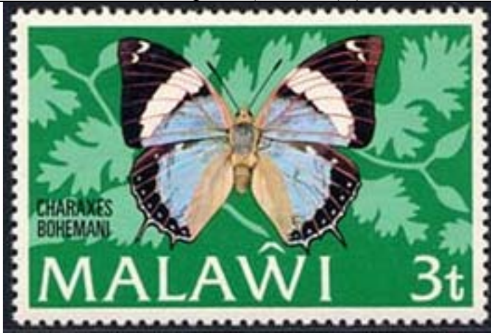
Lepidoptera : Nymphalidae : Charaxinae : Charaxes bohemani .

1973 Febrero 7 : Mariposas (4 valores) (Y & T : 195-199) (Scott : 199-202).