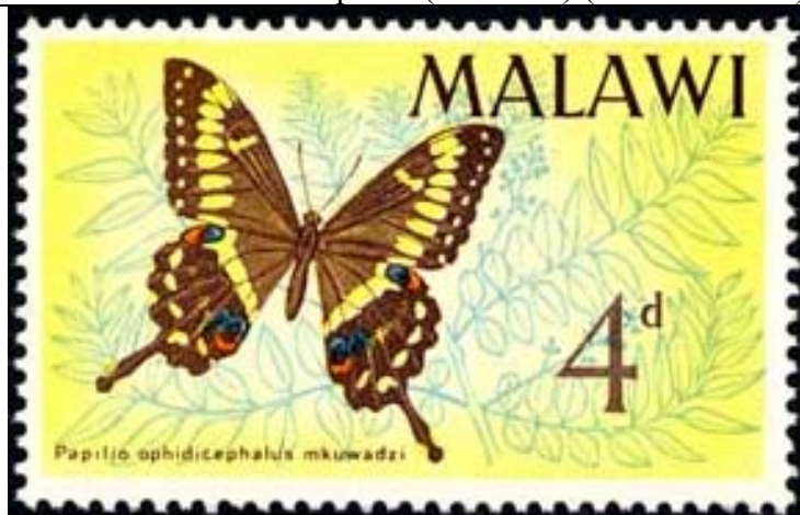
Lepidoptera : Papilio ophidicephalus .

1966 Febrero 15 : Mariposas (4 valores) (Y & T : 37-40) (Scott : 37-40).