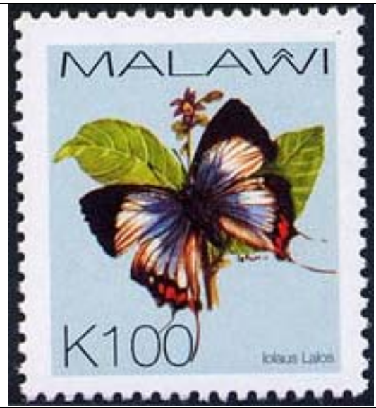
Lepidoptera : Lycaenidae : Iolus lalos .