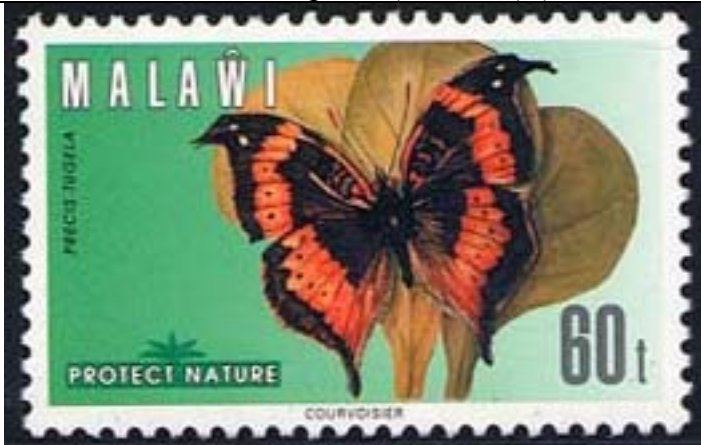
Lepidoptera : Nymphalidae : Precis sp.

1996 Diciembre 5 : Mariposas (4 valores) (Scott : 651-654).