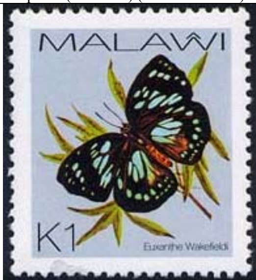
Lepidoptera : Nymphalidae : Euxanthe wakefieldi .

2002 : Mariposas (8 valores) (Scott : 706-713).