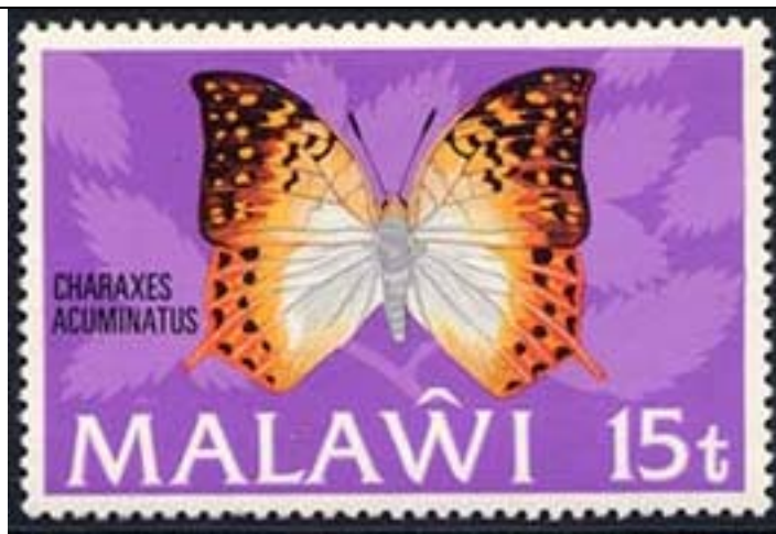
Lepidoptera : Nymphalidae : Charaxinae : Charaxes acuminatus .