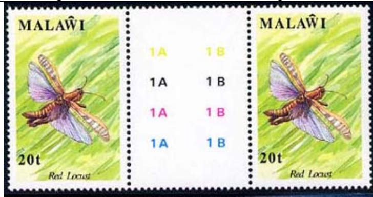
Orthoptera : Acrididae.

1991 Septiembre 21 : Idem, Insectos, bloques de 2 sellos (4 valores) (Y & T : 573-576) (Scott : 590-593).