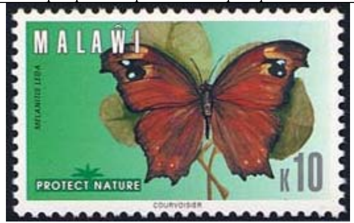
Lepidoptera : Nymphalidae : Melanitis leda.