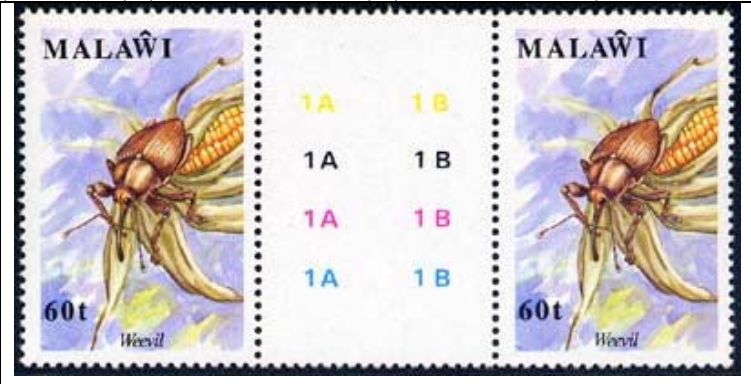
Coleoptera : Curculionidae.