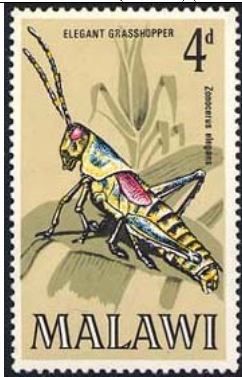
Orthoptera : Acrididae : Zonocerus elegans .

1970 Febrero 15 : Insectos (4 valores) (Y & T : 123-126) (Scott : 127-130).