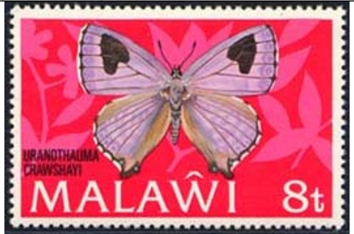
Lepidoptera : Lycaenidae : Uranothalima crawshayi .