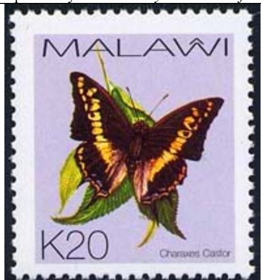
Lepidoptera : Nymphalidae : Charaxinae : Charaxes castor .