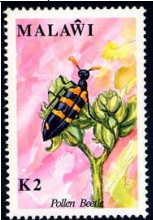
Coleoptera : Meloidae.