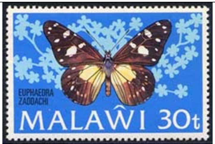
Lepidoptera : Nymphalidae : Euphaedra zaddachi .