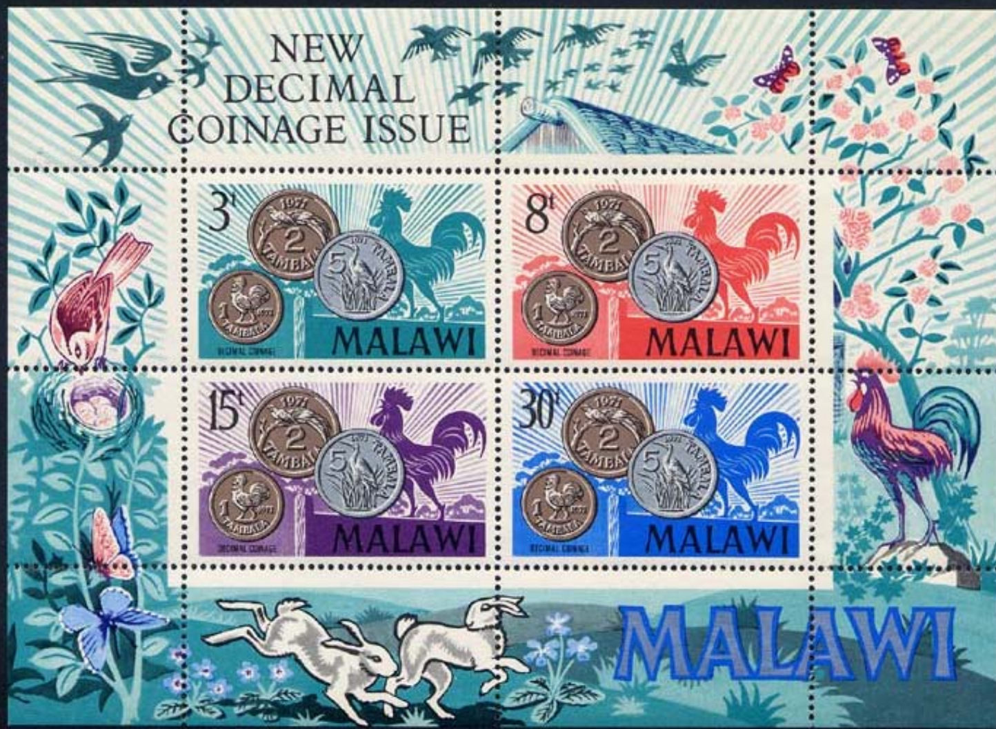
Mariposas en margenes (Lepidoptera).

1971 Febrero 15 : Nuevo sistema de moneda decimal (BF de 4 valores) (Scott : 164 a).