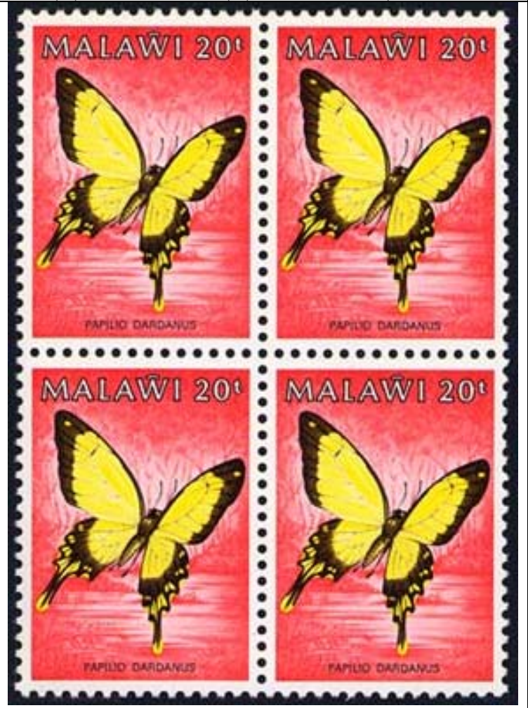
Lepidoptera : Papilionidae : Papilio dardanus .