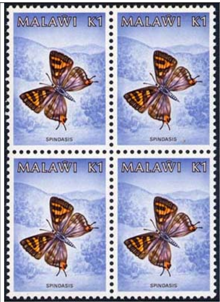
Lepidoptera : Lycaenidae : Spindasis sp.

1984 Agosto 1 : Idem, Mariposas, primer día de circulación (4 valores) (Y & T : 436-439) (Scott : 450-453).