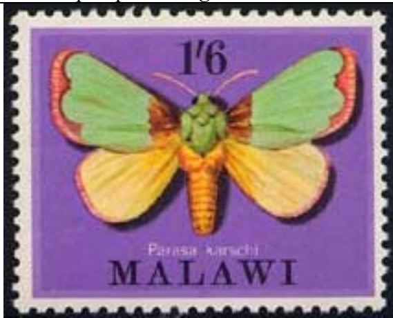
Lepidoptera : Parasa karschi .