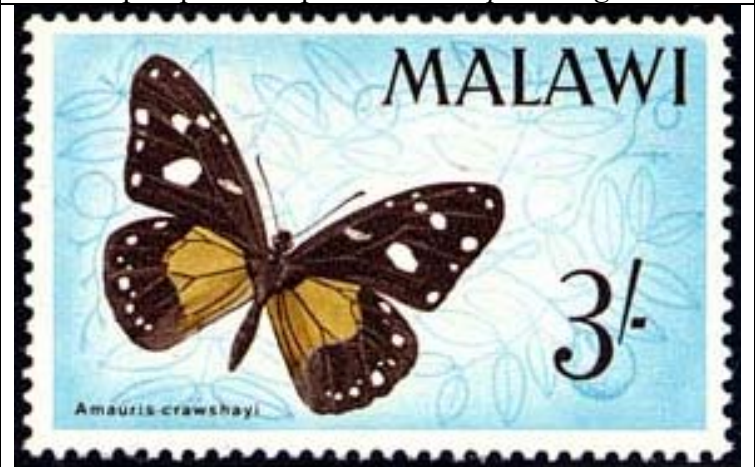
Lepidoptera : Nymphalidae : Danainae : Amauris crawshayi .