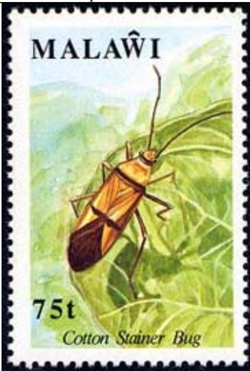
Heteroptera : Pyrrhocoridae : Dysdercus sp.