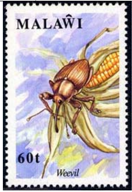
Coleoptera : Curculionidae.