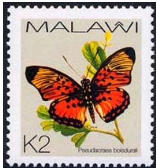
Lepidoptera : Nymphalidae : Pseudacraea boisduvali .