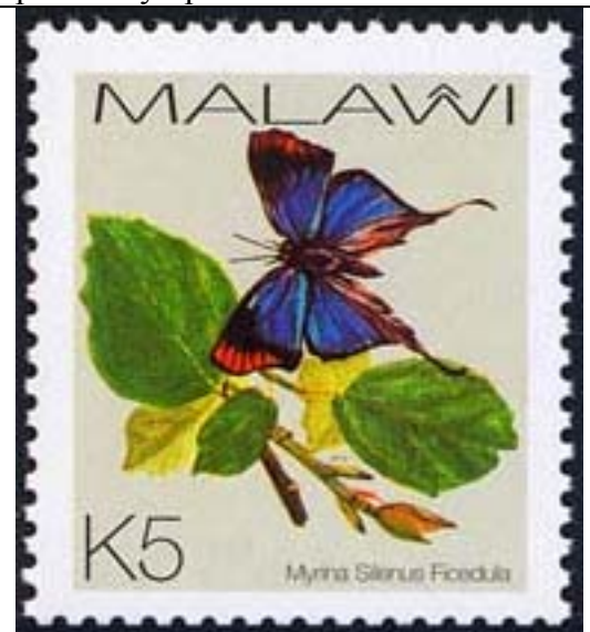
Lepidoptera : Lycaenidae : Myrina silenus ficedula .