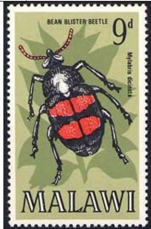
Coleoptera : Meloidae : Mylabris dicincta .