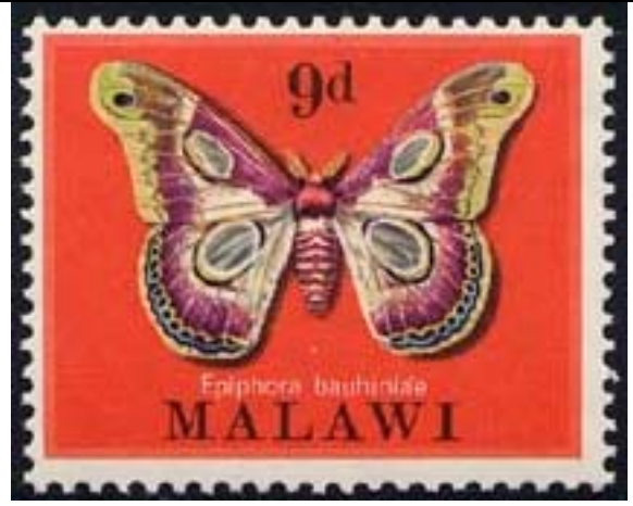
Lepidoptera : Saturniidae : Epiphora bauhiniae .