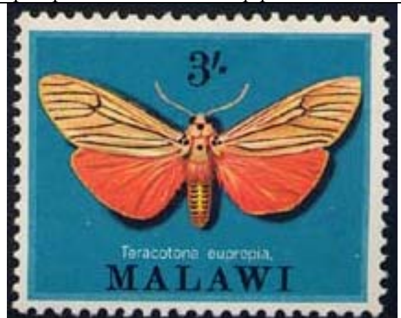
Lepidoptera : Arctiidae : Toracotona eupropia .