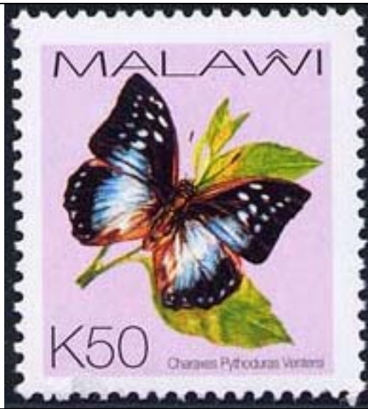
Lepidoptera : Nymphalidae : Charaxinae : Charaxes pythodurus vortara .