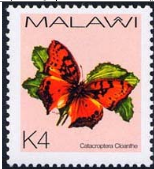
Lepidoptera : Nymphalidae : Catacroptera cloanthe .