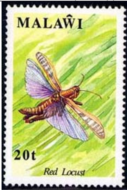
Orthoptera : Acrididae.

1991 Septiembre 21 : Insectos (4 valores) (Y & T : 573-576) (Scott : 590-593).