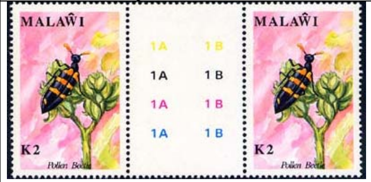
Coleoptera : Meloidae.