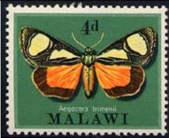
Lepidoptera : Aegocera trimenii .

1970 Septiembre 30 : Lepidoptera (4 valores) (Y & T : 134-137) (Scott : 138-141).