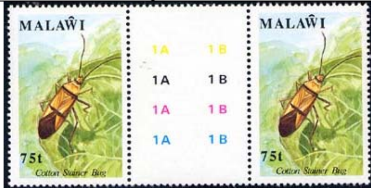
Heteroptera : Pyrrhocoridae : Dysdercus sp.