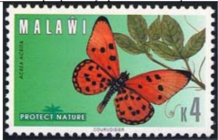
Lepidoptera : Nymphalidae : Acraeinae : Acraea aceita.