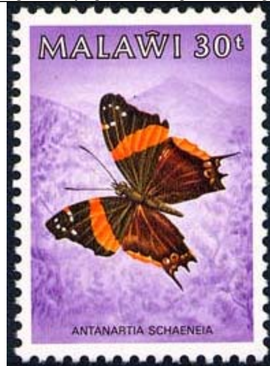
Lepidoptera : Nymphalidae : Antanartia schaeneia .