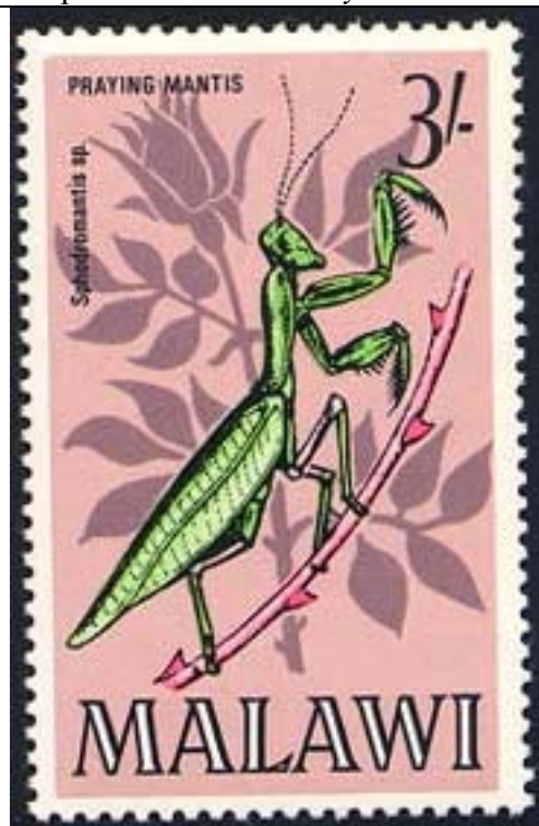
Mantodea : Mantidae : Sphodromantis sp.