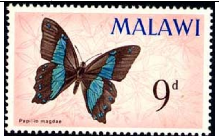
Lepidoptera : Papilionidae : Papilio magdae .