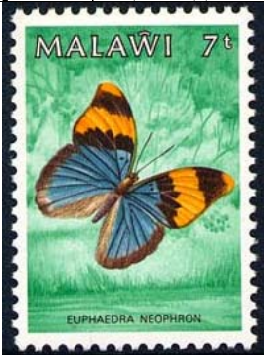
Lepidoptera : Nymphalidae : Euphaedra neophron .

1984 Agosto 1 : Mariposas (4 valores) (Y & T : 436-439) (Scott : 450-453).