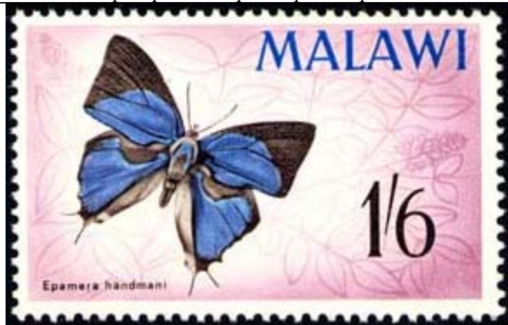
Lepidoptera : Lycaenidae : Epamera handmani .