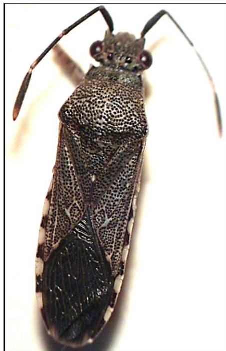
Figura 3: Catorhintha guttula (Fabricius, 1794), capturado en Coro, municipio Miranda, estado Falcón, Venezuela. Arriba: hembra. Abajo: macho.