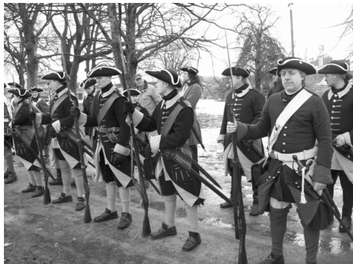
En grupp färggranna karolinska soldater. Det är stor skillnad mot dagens militära uniformer, som har en betydligt mer kamouflerande färgsättning.

Efter freden i Roskilde 1658 kom Skåne, Blekinge och Halland att tillhöra Sverige. Några månader efter det att Sverige blev slagna vid Poltava 1709 passade Danmark på att förklara Sverige krig. Hela den svenska armén var slagen i spillror och Danmark såg nu en möjlighet att ta tillbaka sina gamla provinser som de förlorat ett 50-tal år tidigare. Den 2 november 1709 landsattes 15.000 danska soldater i Råå strax utanför Helsingborg. Magnus Stenbock var guvenör över Skåne, men hade alldeles för få soldater för att kunna bjuda ett ordentligt motstånd och tvingades dra sig tillbaka norrut till Småland. Karl XII befann sig för sin del långt nere i Turkiet. Under november och december intog den danska armén hela Skåne med undantag av fästningarna i Malmö och Landskrona. I januari 1710 var turen kommen till Blekinge där Karlshamn intogs. Nu hamnade den infrusna svenska flottan i Karlskrona i farozonen. Den danska armén var dock vid det här laget i dåligt skick eftersom man hade brist på livsmedel samt problem med fältsjukans härjningar. Man var därför tvungna att dra sig tillbaka till Skåne.