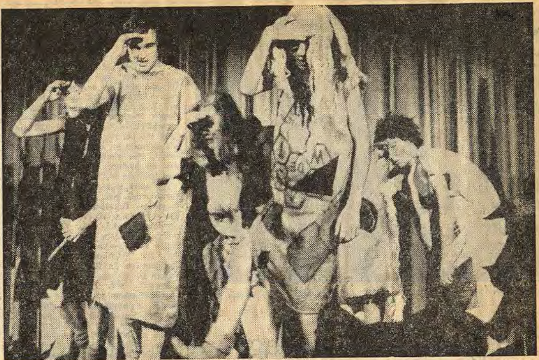
En trollscen ur den Frödingkavalkad som eleverna i klass 9 c i Alléskolan gemensamt arbetat fram

Arbetsförmedlingen utökar, dock inte sin personal, utan endast lokalmässigt. Man har nyligen övertagit de lokaler som Åtvidabergs fotvårdsklinik tidigare disponerade. Efter viss ombyggnad kommer arbetsförmedlingen i Åtvidaberg att förfoga över ytterligare ett kontorsrum och ett större väntrum. Arbetet beräknas vara slutfört före nyår.