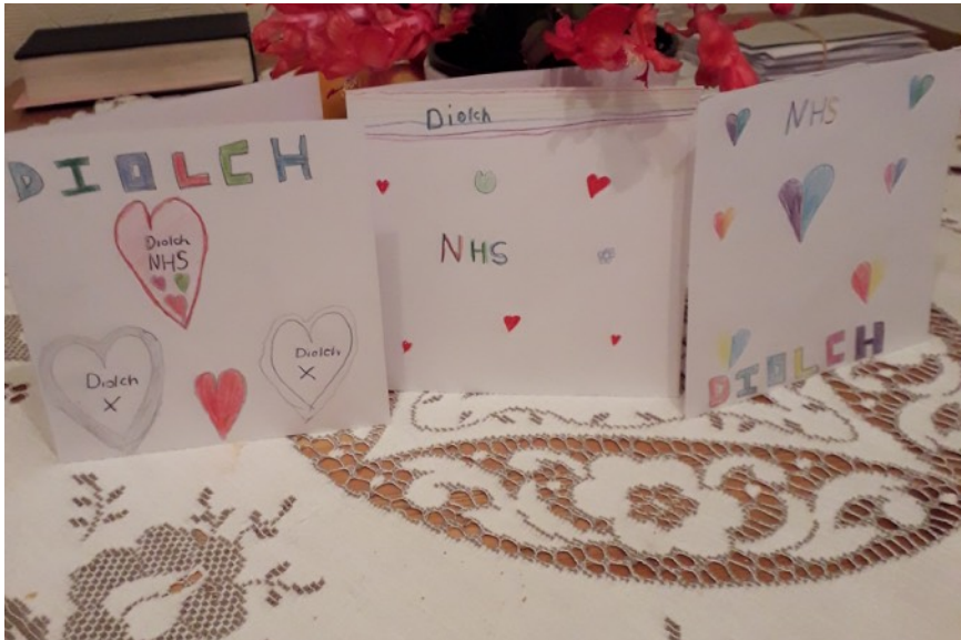
Cardiau'r plant yn diolch i'r NHS

Os gwyddoch chi am unrhyw blant fyddai'n mwynhau'r cyfle i ymuno â sesiynau bywiog yr ysgol Sul am 10.30 o'r gloch dros Zoom ar fore Sul, anfonwch air at y Gweinidog, y Parch Watcyn James. Croeso cynnes i bawb.