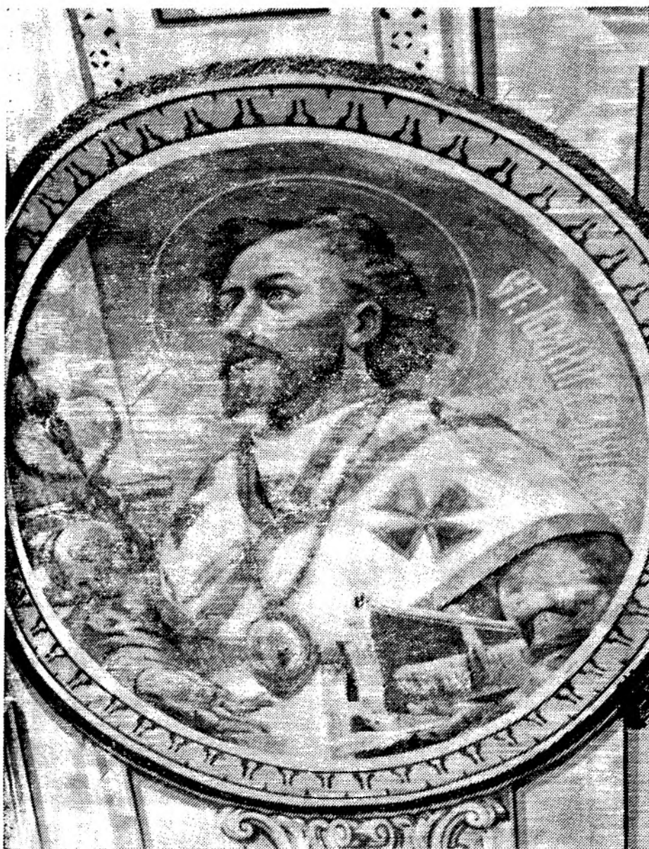
Svätý Ján Zlatoústý - obnovená ikona v katedrálnom chráme v Prešove.