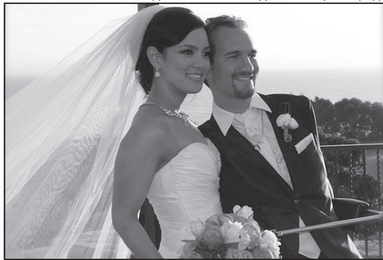
Ник Вуйчич с жена си

тях. Но повече от всичко ме потресиха думите, които девойката прошепна на ухото ми: „Никой досега не ми е казал, че аз съм прекрасна сама за себе си. Никой не ми е казал, че ме обича. Вие измените живота ми и вие също сте прекрасен.“