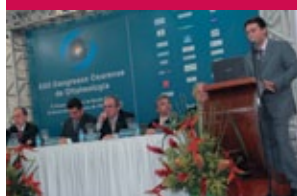
Presidente da SOC discursando na solenidade

A Sociedade Cearense de Oftalmologia (SCO) realizou entre 11 e 13 de novembro o XXII Congresso Cearense de Oftalmologia no Hotel Oasis Atlântico Imperial, localizado em Fortaleza (CE). O evento contou com a participação de aproximadamente 500 pessoas, entre congressistas, palestrantes e expositores.