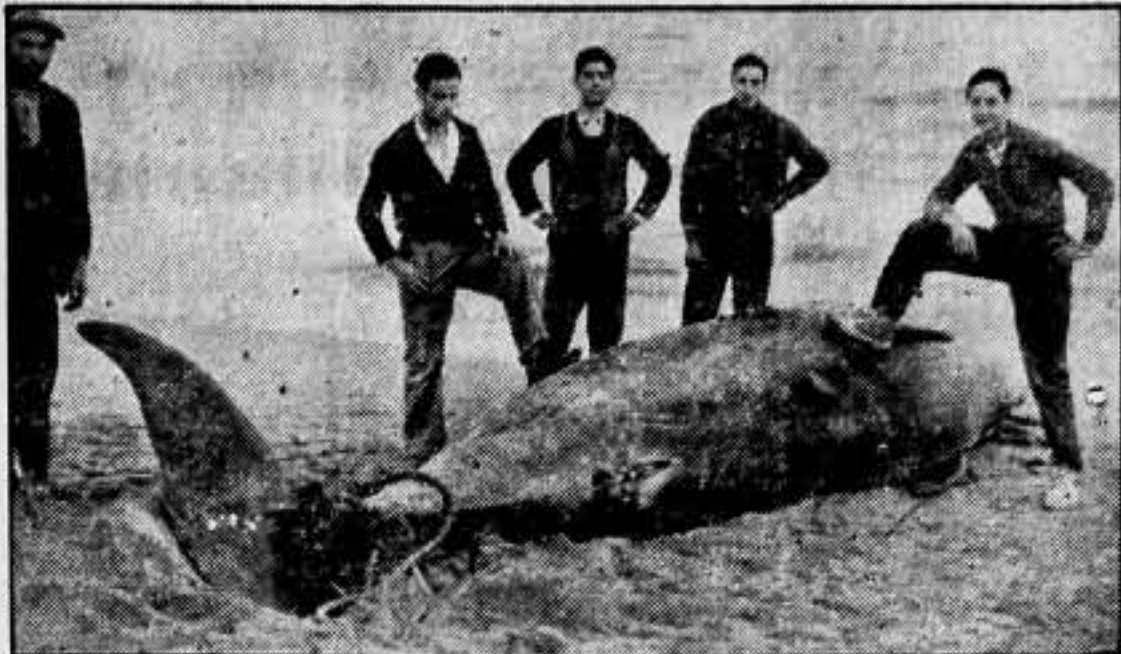
Captura de un delfín, herido por la metralla fascista, y recogido por nuestros pescadores, en las costas de Gavi.

Este reconocimiento le ha salido mal. Y todo por ignorancia, como arriba digo. El imperio británico, cuando robusto, robustos talentos de estadista producía. Hoy es un coloso apollado y no alumbraba más que cerebros en los que la polilla ha hecho estragos. Así los de Baldwin, Hoare, Plymouth, Eden y tantos otros, pobres chambones en el arte de disfrazar la verdad en que aquellos fueron maestros. Y la verdad, en lo tocante al bloqueo de Bilbao, era ésta: que no había, ni puede haber tal bloqueo, porque las costas del Cantábrico están magníficamente artilladas con poderosos cañones; porque no hay minas; porque la morfología del cordón litoral favorece poderosamente a la defensa; porque la móvil la tiene perfectamente preparada el Gobierno vizcaíno con barcos bien artillados, con submarinos, con varios destructores de la Marina de guerra, con barcos mercantes bien armados y, sobre todo, con la superioridad de su personal marítimo sobre el de los tres o cuatro cruceros más o menos averiados de que pueden disponer los facciosos. Los marinos vascos son gente a prueba de galernas (en algunas les ha acompañado, y en una de ellas, sin su arrojo y pericia, hubiera ido a