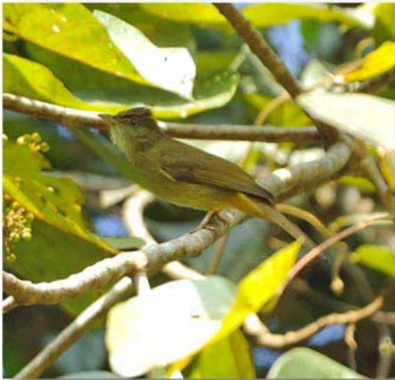
灰眼短脚鹎 Iole propinqua (云南版纳尚勇)