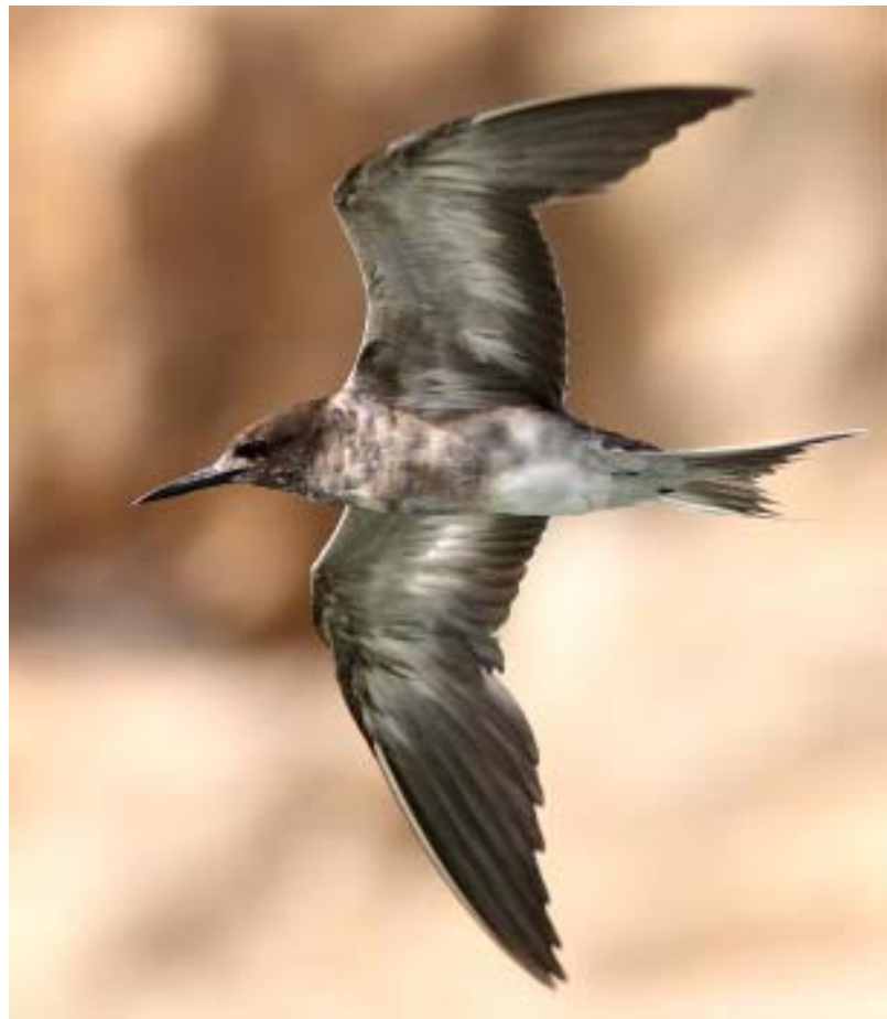
乌燕鸥 摄于福建省漳浦县 菜屿列岛

✈ 今夏，湖南多处地方有棉凫报道，并有繁殖记录，其中长沙郊区多至6只 [向萍]。