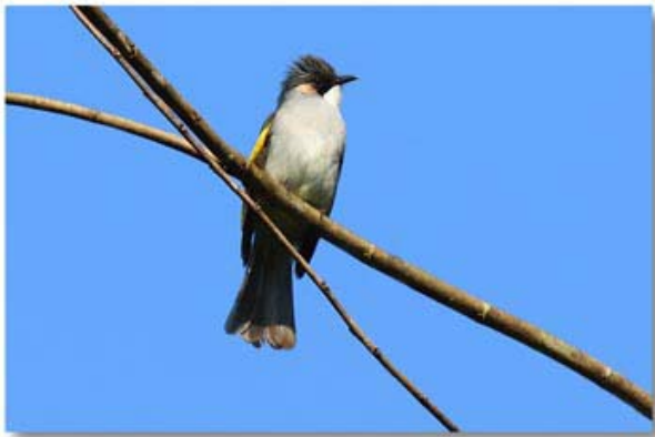
灰短脚鹎 Hemixos flavala (云南瑞丽)