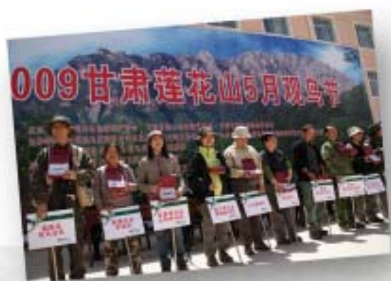
莲花山观鸟赛开幕式