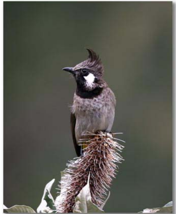
白颊鹎 Pycnonotus leucogenys (西藏)