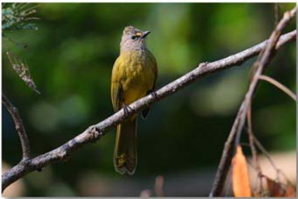
黄绿鹎 Pycnonotus flavescens (云南那帮)