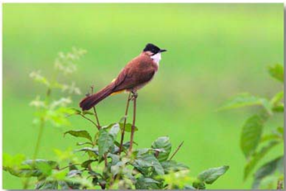
黄臀鹎 Pycnonotus xanthorrhous (云南瑞丽)