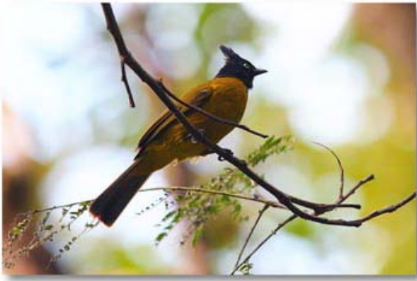
黑冠黄鹎 Pycnonotus melanicterus (云南瑞丽)