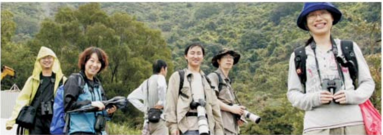
老师们亲切的笑容让观鸟路途更轻松，观鸟活动更有吸引力。