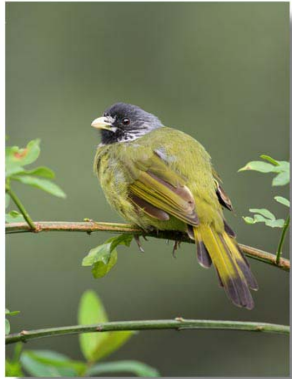
领雀嘴鶇 Spizixos semitorques (浙江杭州)