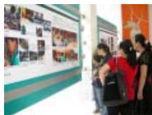
家长在展板前驻足观看