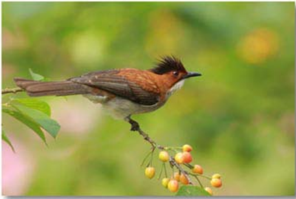
栗背短脚鹎 Hemixos castanonotus (浙江杭州)