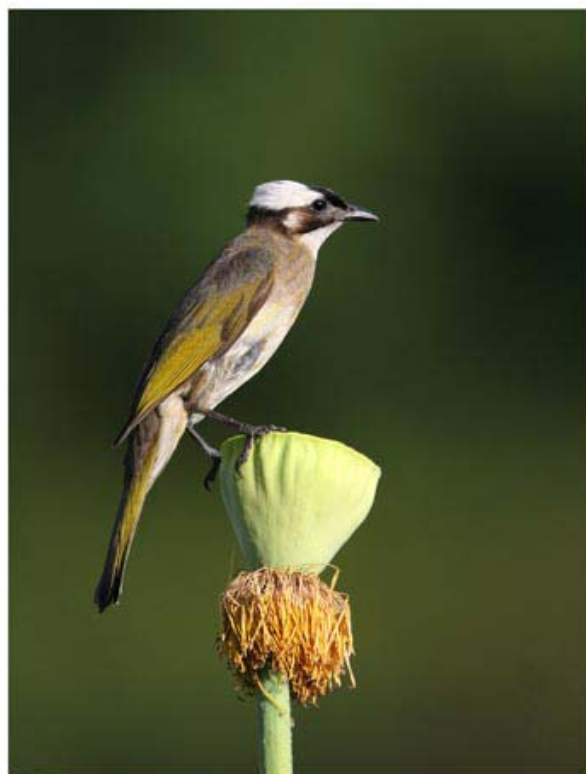
白头鹎 Pycnonotus sinensis (浙江杭州) 朱英 摄