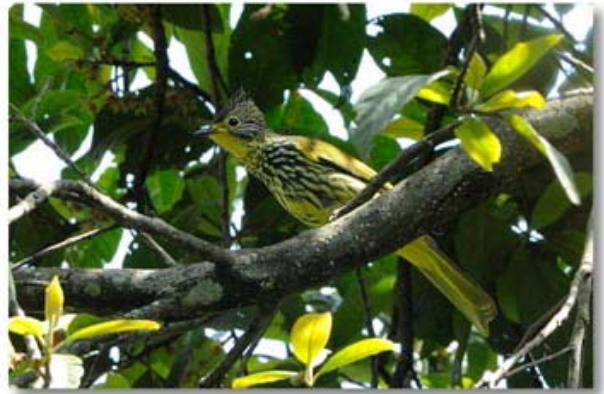
纵纹绿鹎 Pycnonotus striatus (云南百花岭)