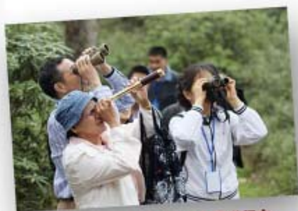
瓦屋观鸟赛进行中