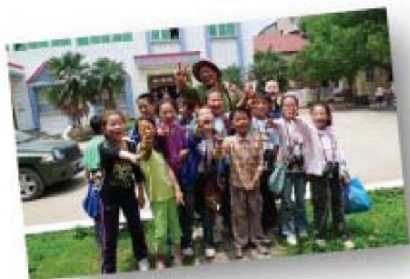
三阳观鸟赛——裕和与三阳镇孩子们的合影