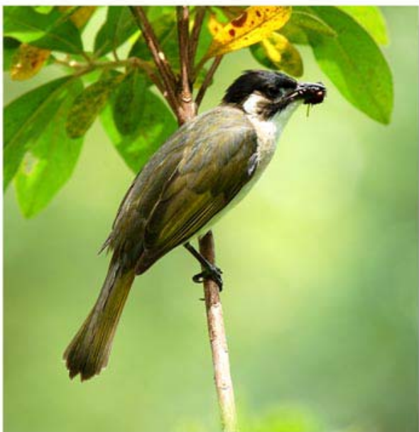
白头鹎 Pycnonotus sinensis (广西桂林) 蔡江帆 摄