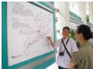
志愿者在展板前露出快乐的笑容