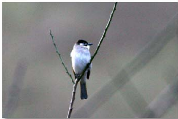
台湾鹎 Pycnonotus taivanus (台湾太鲁阁)