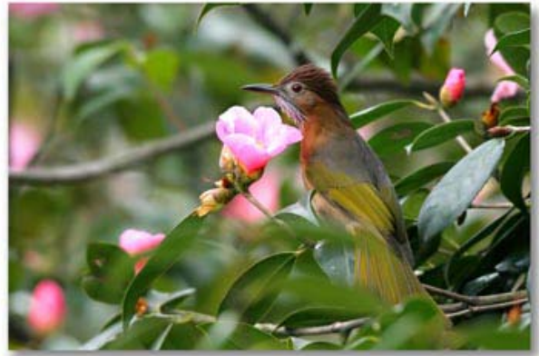
绿翅短脚鹎 Hypsipetes mcclllandii (浙江杭州)