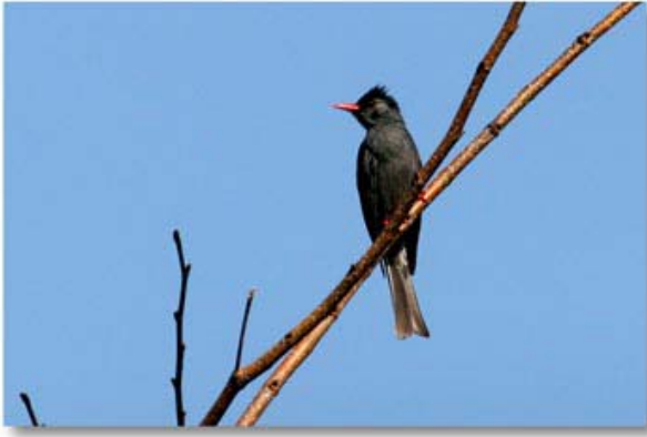
黑[短脚]鹎 Hypsipetes leucocephalus (云南那帮)