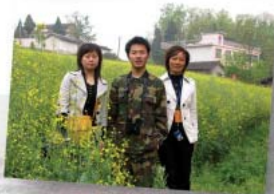
洋县观鸟赛——队员与向导