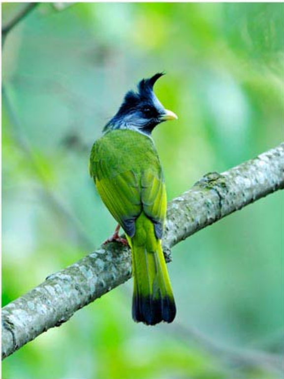
凤头雀嘴鶇 Spizixos canifrons (云南昆明)