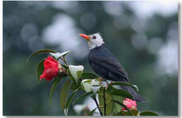
黑[短脚]鹎 Hypsipetes leucocephalus (浙江杭州)