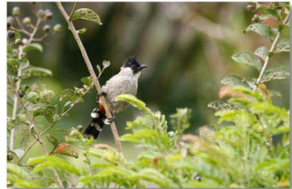
白喉红臀鶇 Pycnonotus aurigaster (广东河源)