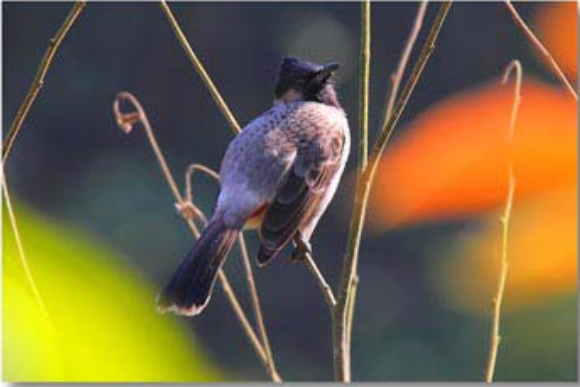
黑喉红臀鶇 Pycnonotus cafer (云南那帮)