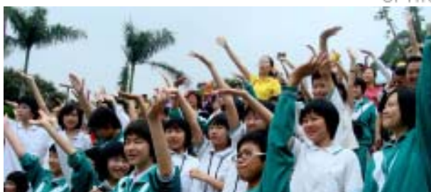
广州市第133中学学生在深圳红树林观鸟

看到这里，我正心里窃喜，孺子可教也！可是，当我看到他最后一句话时，立刻（用孩子们嘴里的话来说）晕倒！他最后的话是：直到今天，就算我写下了这篇文章，我还是