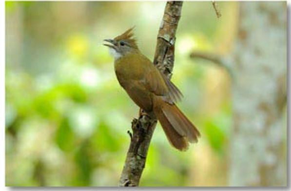
白喉冠鶇 Alophoixus pallidus (云南版纳)