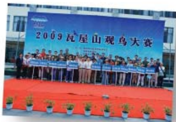
瓦屋山观鸟赛开幕式