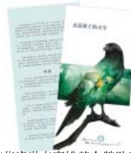
施华洛世奇育雏基金赞助印制的《亲近孩子的天空》折页

面向初一、初二学生发放近2500份折页及调查问卷，向家长介绍观鸟活动的意义及学校是如何开展观鸟活动的。通过统计调查问卷，了解家长