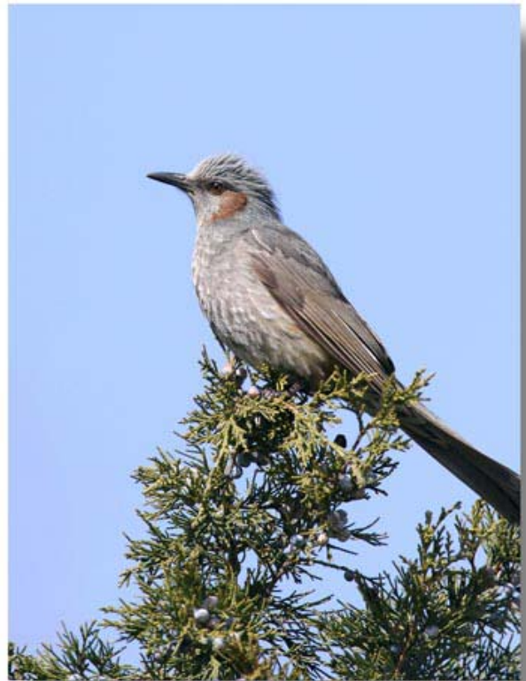
栗耳[短脚]鹎 Ixos amaurotis (辽宁丹东)