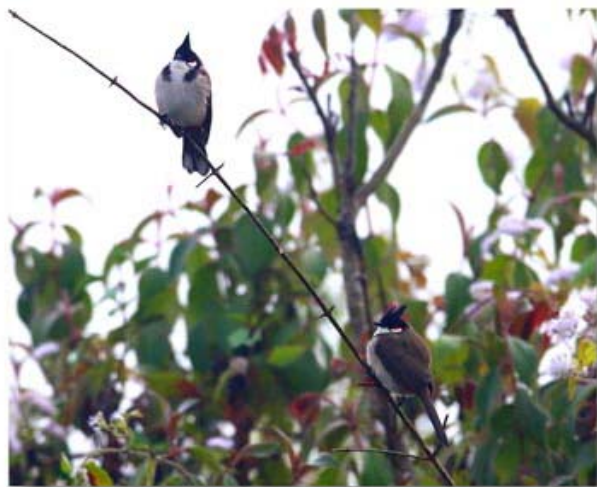
红耳鹎 Pycnonotus jocosus (云南瑞丽)