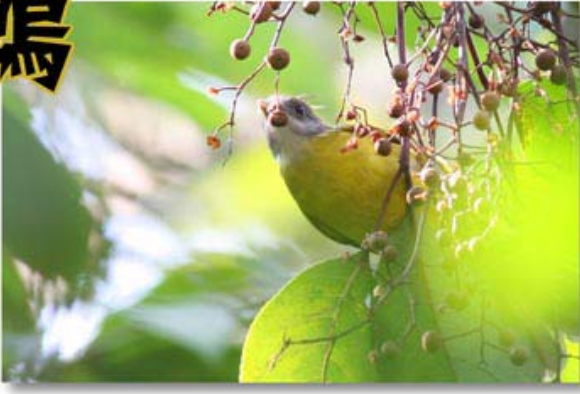
黄腹冠鶇 Alophoixus flaveolus (云南铜壁关)