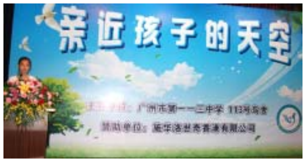
施华洛世奇育雏基金赞助的“亲近孩子的天空”主题活动

近、中、远期活动计划，学生也可以自主设计安排假期进行野外观鸟实践活动，自行确定观鸟晋级情况。