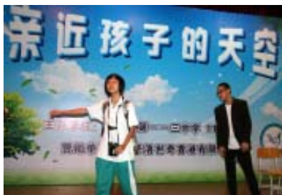
鸟舍成员自编自演的英语短剧

学生表演英语短剧《Where are you from?》，通过一个老外“鸟人”与中国“鸟人”之间轻松的对话开始展开故事。