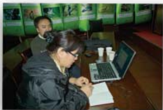
莲花山上核对记录