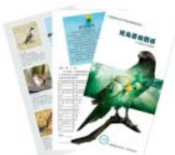
施华洛世奇育雏基金赞助印制的《观鸟晋级图谱》

鸟类的分布有很强的地域性，各地鸟类的组成差异很大，《中小学观鸟晋级图谱》为初学观鸟的同学提供图片参考资料，同时也是学生观鸟技能水平检测、观鸟活动阅历的参考标准，教师可以根据等级来制定观鸟小组