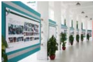
施华洛世奇育雏基金赞助印制的《亲近孩子的天空》展板

在开展活动的2年多时间里，113鸟舍的足迹遍布广州市大大小小的公园；把深圳的红树林和从化的溪源山庄作为观鸟基地；参加每年一届的深圳红树林观鸟比赛和香港国际观鸟大赛；还开展了一系列的观鸟夏令营、观鸟冬令营活动。我们把这些活动通过展板展示给鸟舍成员的家长，让他们更直观地看到并发现观鸟活动的乐趣及意义。