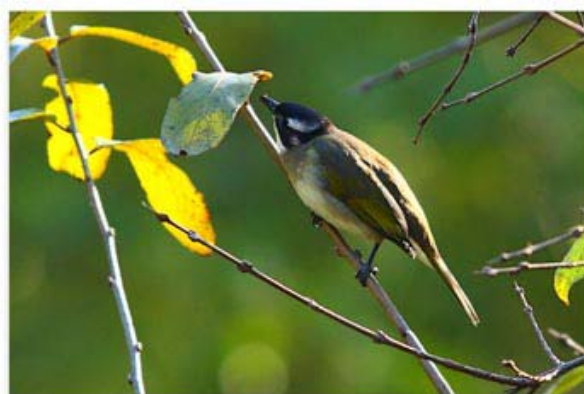
白头鹎 Pycnonotus sinensis (北京)