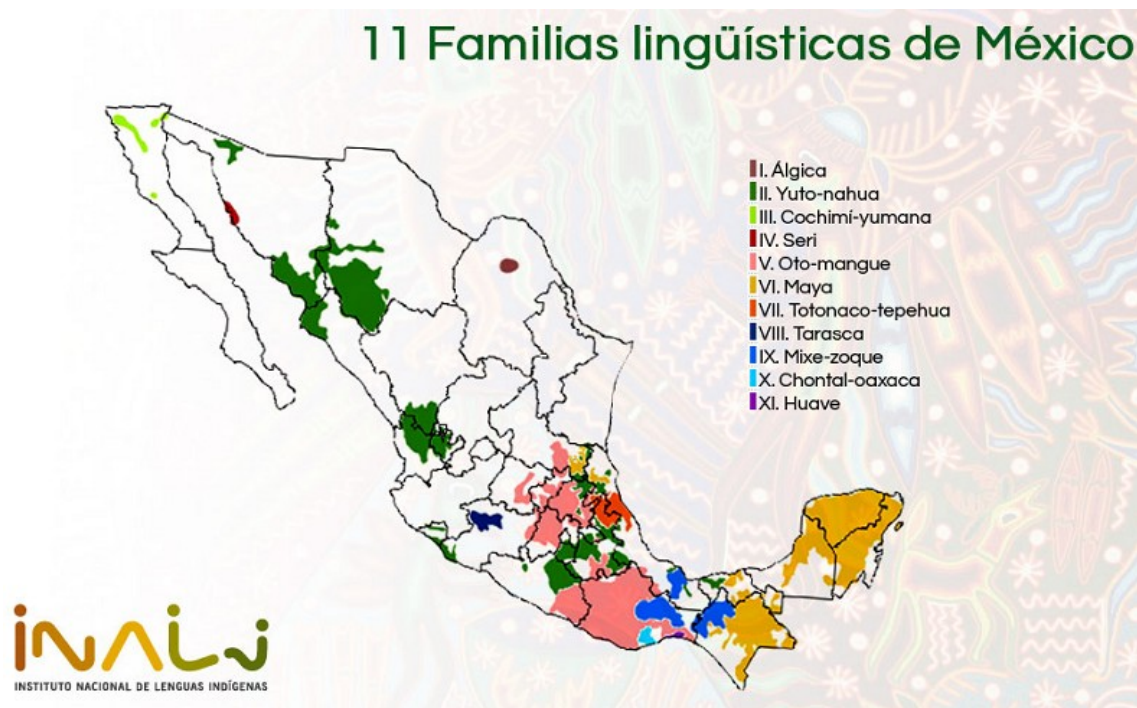
Figura 2.- Mapa de la distribución de familias lingüísticas de México (INALI).

errónea debido a la complejidad del tema, ya que el INALI señala que “ha considerado importante que cada variante lingüística sea tratada como lengua” y que “ México cuenta con 364 lenguas o variantes lingüísticas, 68 agrupaciones lingüísticas y 11 familias lingüísticas”; el INALI reconoce que al menos 20 de ellas están a punto de desaparecer, por ejemplo la familia Yumano-Cochimí.