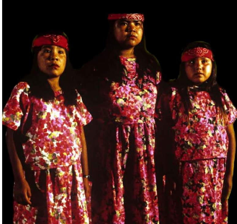
Figura 3.- Yumanos. Tomada del documento Pueblos Indígenas de México en el Siglo XXI .

Habitualmente la existencia o supervivencia de un grupo étnico ha sido asociada a la delimitación de poblaciones geográficamente identificadas y con patrones culturales de carácter distintivo, de manera que al presentarse su dispersión y el debilitamiento de la imagen de esos patrones, suele concluirse que ha ocurrido una asimilación cultural o mestizaje. Sin embargo los pueblos yumanos han rechazado los asentamientos artificiales y construido nuevas comunidades “invisibles” para el mundo que los observa, aunque muy claras entre ellos y que son amplias redes sociales de apoyo estratégico que implican concentraciones en áreas de gran demanda laboral (Garduño, 1995).