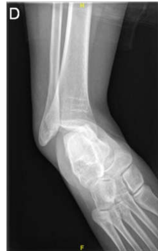
Figura 1. Luxación subastragalina, radiografía simple AP

En las radiografías simples antero-posterior y perfil se objetiva una luxación tibioastragalina posteromedial aislada (Fig. 1), no evidenciándose en la TC fractura ósea asociada.