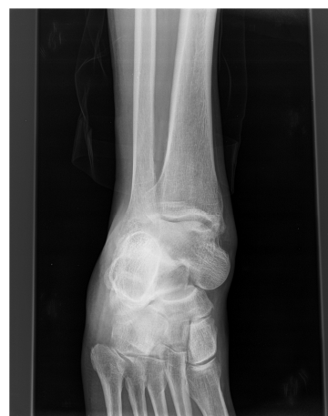
Figura 3. Luxación periastragalina, radiografía simple AP.

Tras la realización de pruebas complementarias, en la radiografía simple se observa una luxación periastragalina pie derecho (Fig. 3).