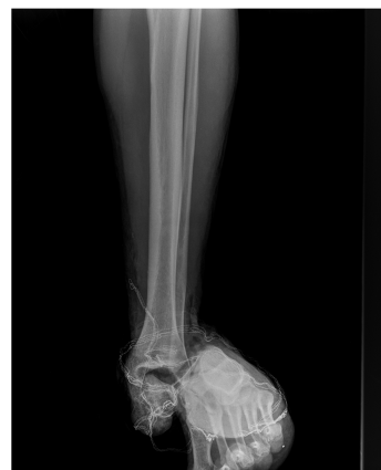
Figura 5. Enucleación astrágalo, radiografía simple AP

No se observan cuerpos extraños o suciedad grosera, así mismo tampoco hay alteraciones neurovasculares distales. Se realiza un lavado abundante con suero salino fisiológico a baja presión, se cubre el astrágalo y se administra antibioterapia intravenosa (cefazolina 2gr iv. al ingreso y 1gr/8h iv. durante 48 horas asociado a gentamicina 240mg/24h iv. en dos dosis). Tras la realización de radiografías de tobillo y pie se confirma la existencia de una enucleación de astrágalo (Fig. 5).