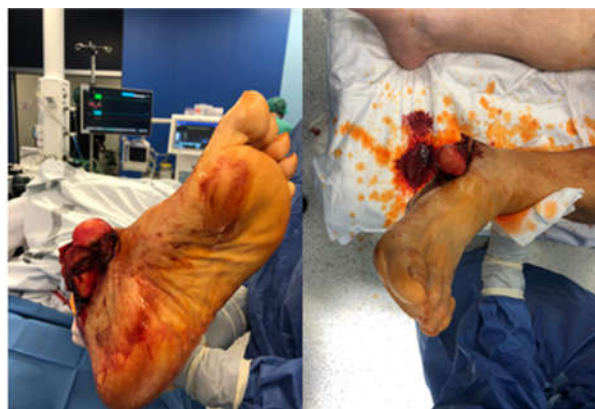
Figura 4. Enucleación abierta de astrágalo

Paciente varón de 49 años que sufre atropello en vía pública. Se realiza protocolo ATLS tanto en el lugar del accidente como en el Box de críticos hospitalario, tras descartar la existencia de lesiones traumáticas asociadas, retiramos la férula neumática en miembro inferior que se le había colocado en el lugar del accidente durante la asistencia inicial, objetivándose una luxación abierta de astrágalo (Fig. 4).