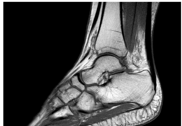
Figura 2. RM tobillo post luxación subastragalina sin imágenes de osteonecrosis.

Tres semanas después de la lesión, con el objetivo que la tumefacción y el edema de las partes blandas haya disminuido, se realiza RM donde se observa: rotura de ligamentos peroneoastragalino anterior y peroneocalcáneo en la parte lateral, así como rotura del complejo ligamentario deltoideo medial (porción tibioastragalina anterior, tibioescafoidea y tibioastragalina posterior) (Fig. 2).