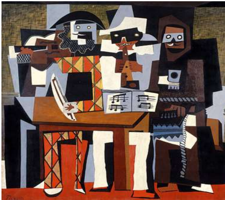
Los tres músicos/Pablo Picasso