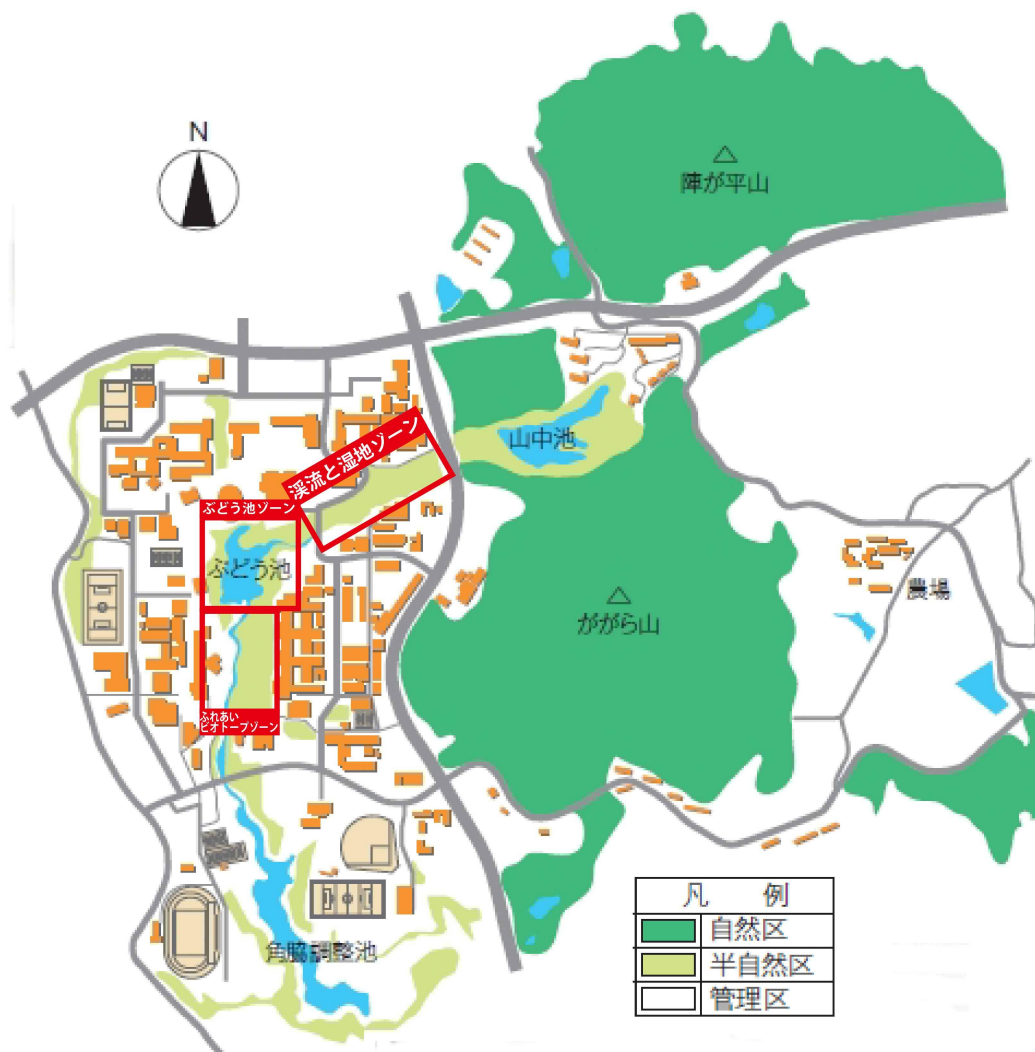
図3. 東広島キャンパスのゾーニング（環境報告書作成専門委員会2011, 2012を改変）。「発見の小径」におけるゾーン分けは広島大学総合博物館（2008）にもとづいて作図した。