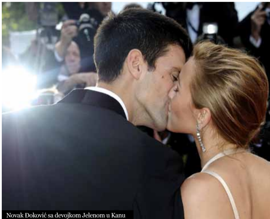
Novak Đoković sa devojkom Jelenom u Kanu

analiziram, ali i ona je sve podredila tenisu, ali još uvek nema kompletnu ekipu oko sebe. Zašto? Ona bi već mogla i morala da je ima. Razgovarajući sa Navratilovom, Grafom, išla sam dosta po turnirima, svi imaju programe, višegodišnje programe. Postavi se cilj i sve se zna, moj program za Noleta je na nekih 150 strana, tačno se zna šta se radi drugog februara sledeće godine, e to je program. Sastanci sa psiholozima, teniseri imaju problem, jede im se slatko, oči vam velike, sve biste pojeli a nutricionista kaže ne i vi morate da slušate. Visoka je cena koju plaćaju teniseri. Mi samo znamo da kažemo kad podignu pehar, vidi koliko je zaradio, a ne pitamo se kroz šta je sve trebao da prođe do toga, ne pada taj novac njima sa neba, sve se to zaradi. To je samo mali promil igrača koji imaju tu sreću da podignu pehar,