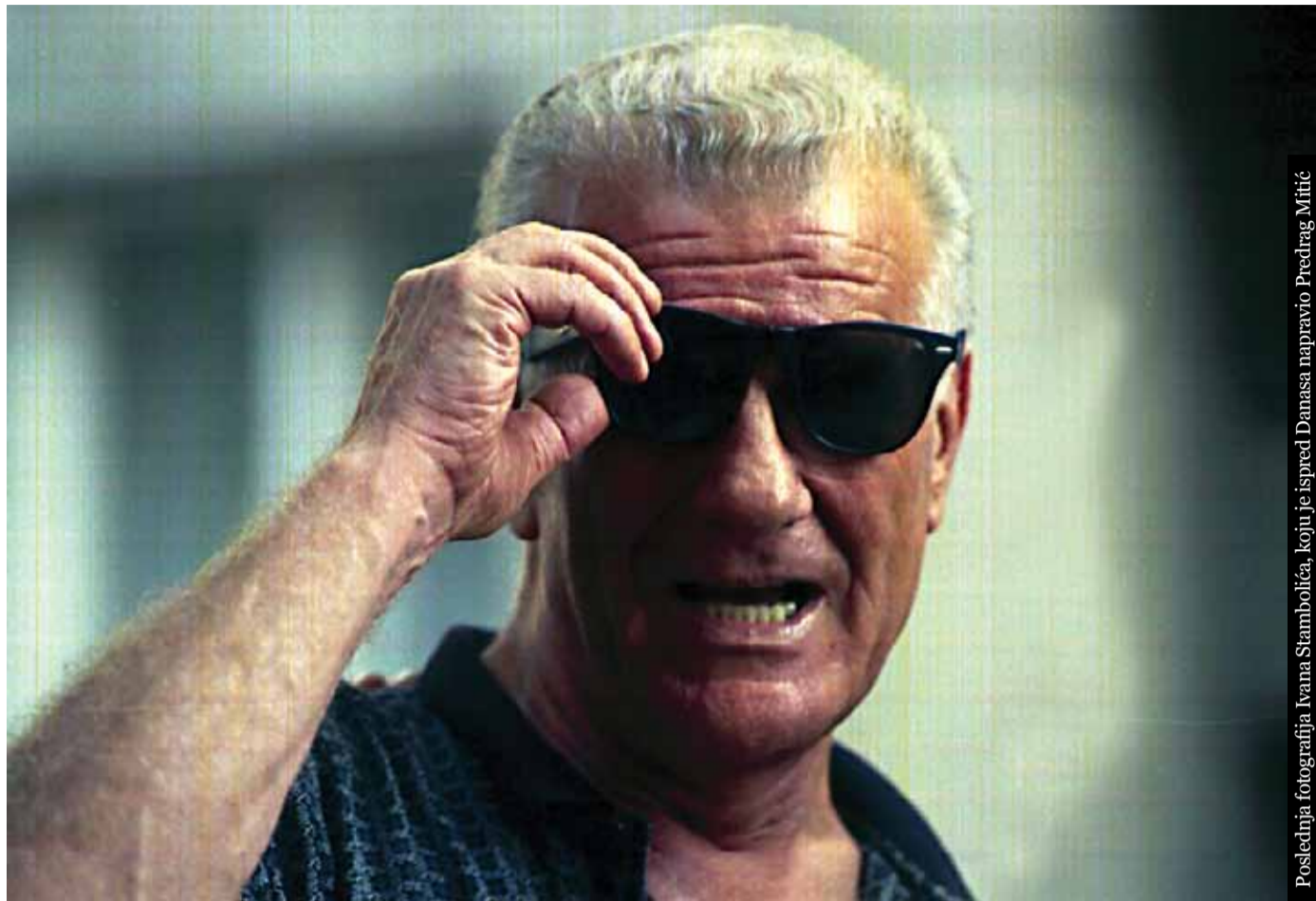
Poslednja fotografija Ivana Stambolića, koju je ispred Danasa napravio Predrag Mitić