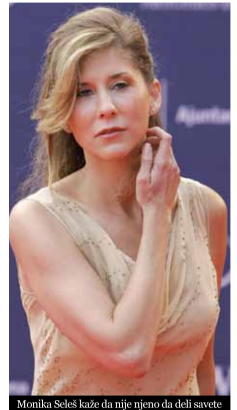
Monika Seleš kaže da nije njeno da deli savete

MS: Kad sam prvi put igrala na Center Court na Wimbledonu, sa 15 godina, pre nego što sam izašla na teren, videla sam izreku koja mi se