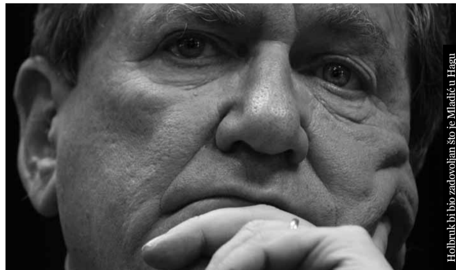
Holbruk bi bio zadovoljan što je Mladić u Hagu

Nije izostalo ni podsećanje na razgovor u Njujorku iz 2001. kad je rekao i da je jedan od onih koji savršeno poznaje Miloševića i njegove ciljeve i da je veoma zadovoljan što je u Hagu, da podržava izjavu Kolina Pauela da će SAD sada pomagati Srbiji, ali da je to samo taktika, a ne realna politika SAD koja bi podrazumevala hapšenje Karadžića i Mladića bez odlaganja. Govorio je da što se kasnije to desi pomirenje će biti teže, jer će dezintegracione snage u međuvremenu u Bosni i „okolini“ veoma ojačati. Tada je kao tačke nesigurnosti na Balkanu i potrebu da se ovaj deo sveta ne gurne u drugi plan „baš zbog bezbednosti Evrope i zemalja u regi-