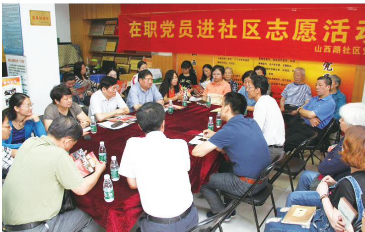
江苏南京市鼓楼区在职党员进社区报到，认领“微心愿”。