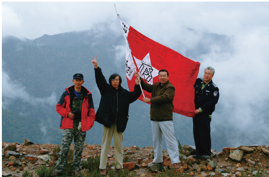
“回望长征考察团队”在岷山垭口