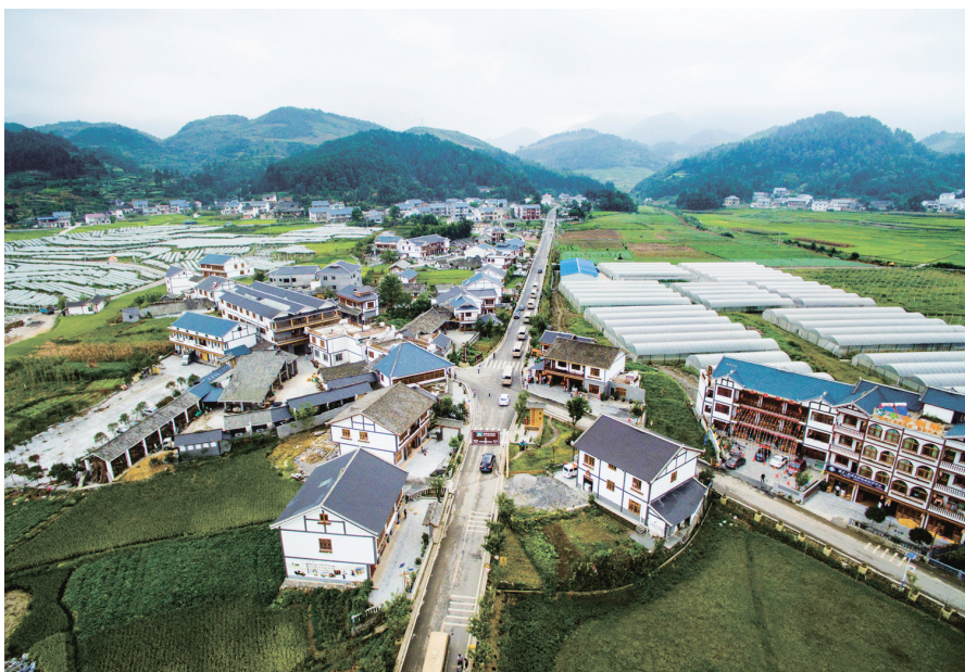
遵义市播州区枫香镇花茂村鸟瞰

从红军街到娄山关,从四渡赤水纪念馆到土城古镇,豪迈的入党誓词时常在耳边响起,动人心弦的红色故事在反复传颂。每一处革命遗址都是常学常新的生