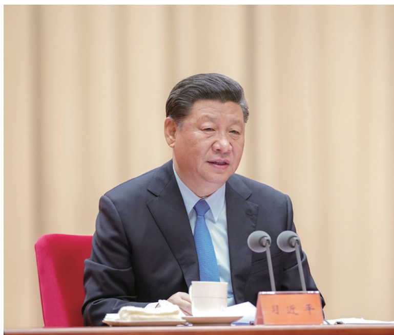
5月31日,“不忘初心、牢记使命”主题教育工作会议在北京召开。中共中央总书记、国家主席、中央军委主席习近平出席会议并发表重要讲话。

习近平指出,开展这次主题教育,是用新时代中国特色社会主义思想武装全党的迫切需要,是推进新时代党的建设的迫切需要,是保持党同人民群众血肉联