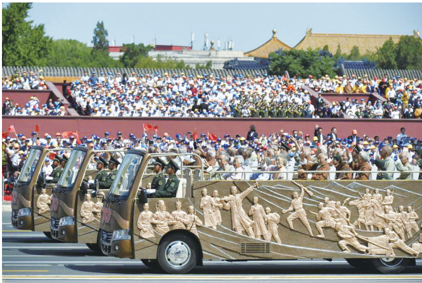
2015年9月中国人民抗日战争暨世界反法西斯战争胜利70周年大阅兵老兵方队

时隔不久,四十二区队奉命围困和强攻辛中义日伪军据点,为了打击日伪军的嚣张气焰,我们经过7昼夜的激战,全歼日伪军一个大队300余人。期间,在强攻据点时,首长命令一、四连实行强攻。四连由我任突击队长,我们机枪子弹少,战斗时暂停机枪射击后,敌人开始反扑,我们用手榴