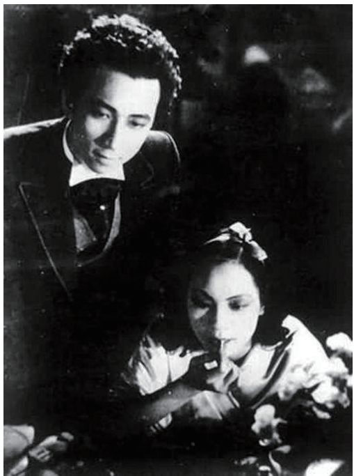
电影《风云儿女》剧照

东北抗日联军从创建之日起就孤悬敌后。在敌强我弱、环境极端恶劣的白山黑水中,与日本侵略