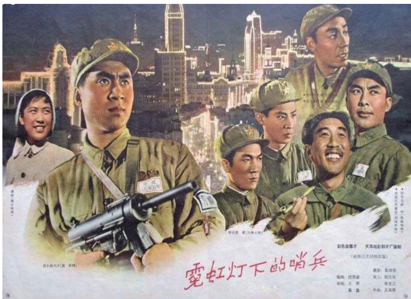
《霓虹灯下的哨兵》电影海报

好八连，天下传。为什么？意志坚。为人民，几十年。拒腐蚀，永不沾。因此叫，好八连。解放军，要学习。全军民，要自立。不