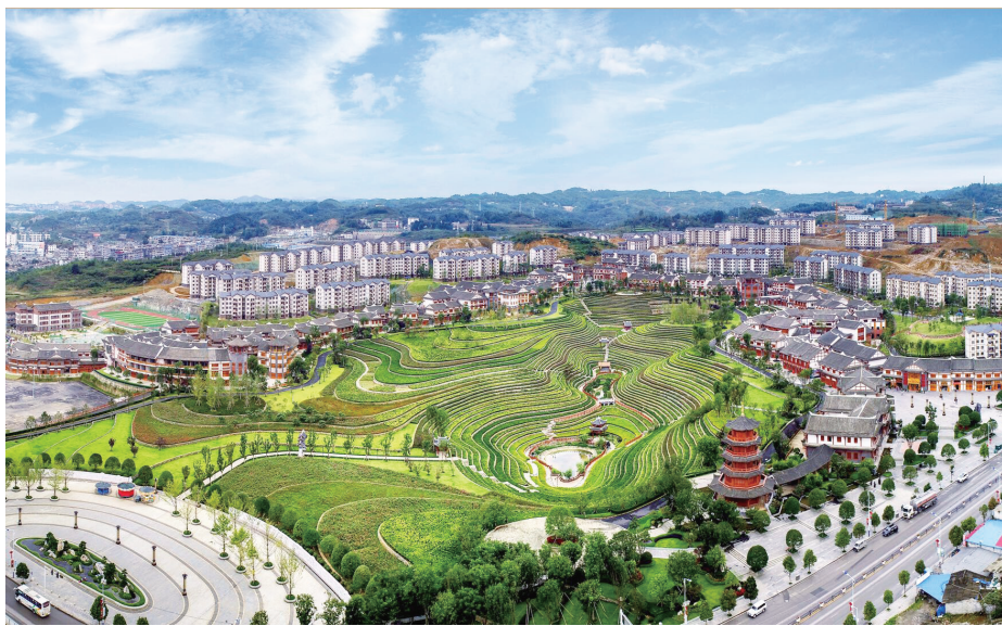
贵州省毕节市大方县易地扶贫搬迁区“奢香古镇”全景

突出精准帮扶,助力定点扶贫县脱贫摘帽。 中央单位定点扶贫是中央和国家机关义不容辞的政治责任。2016年以来,我们精准对接河北灵寿、吉林汪清、广西田东3个定点扶贫县脱贫攻坚需求,在规划编制、资金项目、干部人才等方面不断加大帮扶力度,获得国务院扶贫开发领导小组的充分肯定和当地干部群众的一致好评。今年以来,进一步创新帮扶方式,落实帮扶举措,全力推动吉林汪清脱贫摘帽,巩固河北灵寿、广西田东脱贫成果,提升定点扶贫工作实效。● (责任编辑:郭慧)