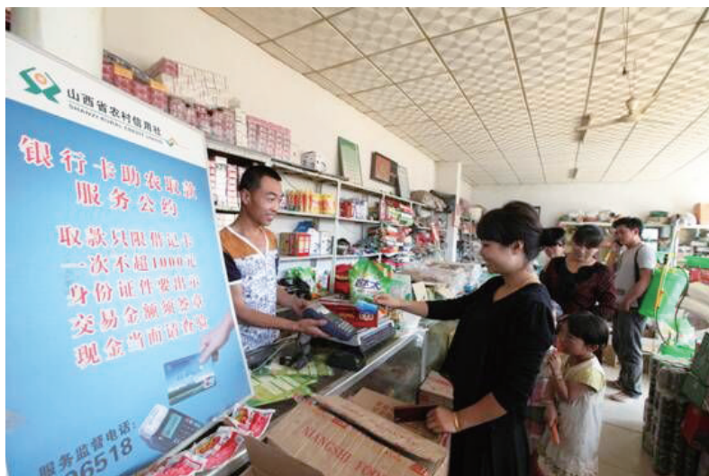
山西省阳高县长城乡边堡村的“农信助农取款机”