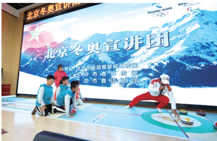
北京冬奥宣讲团走进小学进行宣讲

北京冬奥宣讲团开展的“燃动青春 助力冬奥”走进百所高校系列宣讲活动,历时一年时间,分三季走进全国100所高校,走近百万名大学生,点燃了青年学子助力冬奥的火热情怀。清华大学的一位同学在听完宣讲后感言:“通过这次宣讲会,我感觉自己离冬奥更近了,作为大学生,虽然不能像运动健儿们有身披国旗的机会,但可以像宣讲员一样用自己的