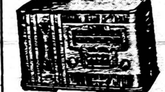
Naujos Radijos, 8 tubų, gražiose kabinetuose, vertos $69.50 - parsiduoda už $34.50