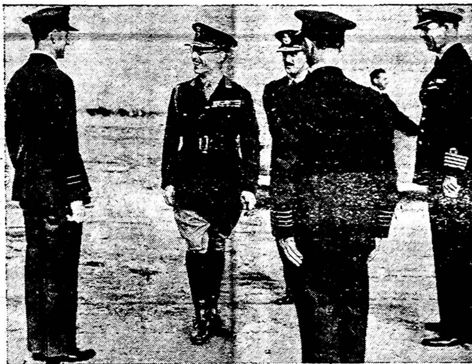
Graikijos karalius Jurgis II (su akiniais) lanko karinės oro bazes. Jis kalbasi su britais ir graikais karininkais.