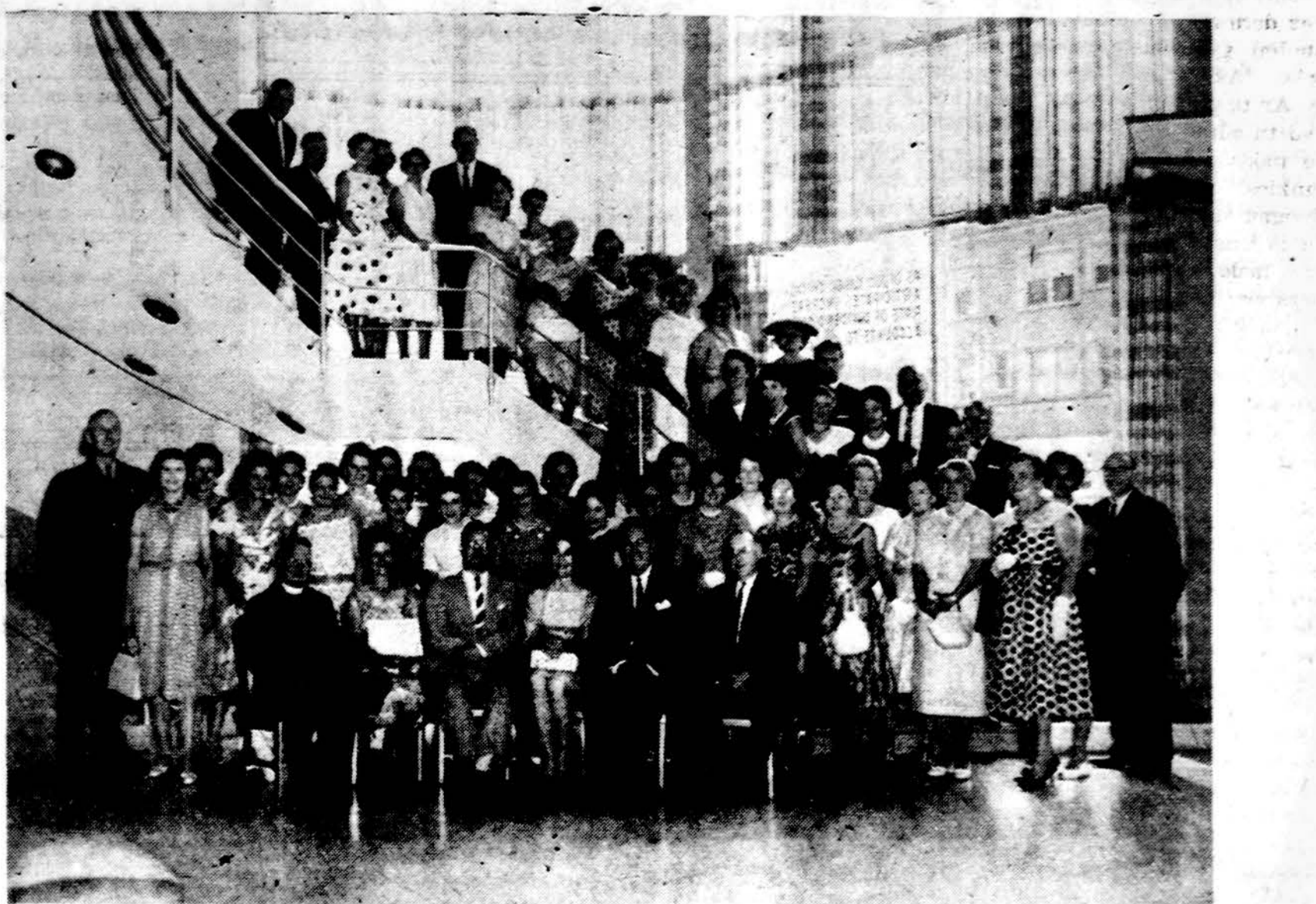
Nuotraukoje grupė 100 vietinių kryžgatvių sargybinių (School Crossing Guards), kurie Susisieikimo Saugumo Komiteto buvo pakviesti užkandžiai. Susirinkimas įvyko CHICAGO SAVINGS & LOAN ASSN., 6245 S. Western Ave. Community Room-kambarys. Šį kambary organizacijos gauna nemokamai savo susirinkimams bei priėmimams