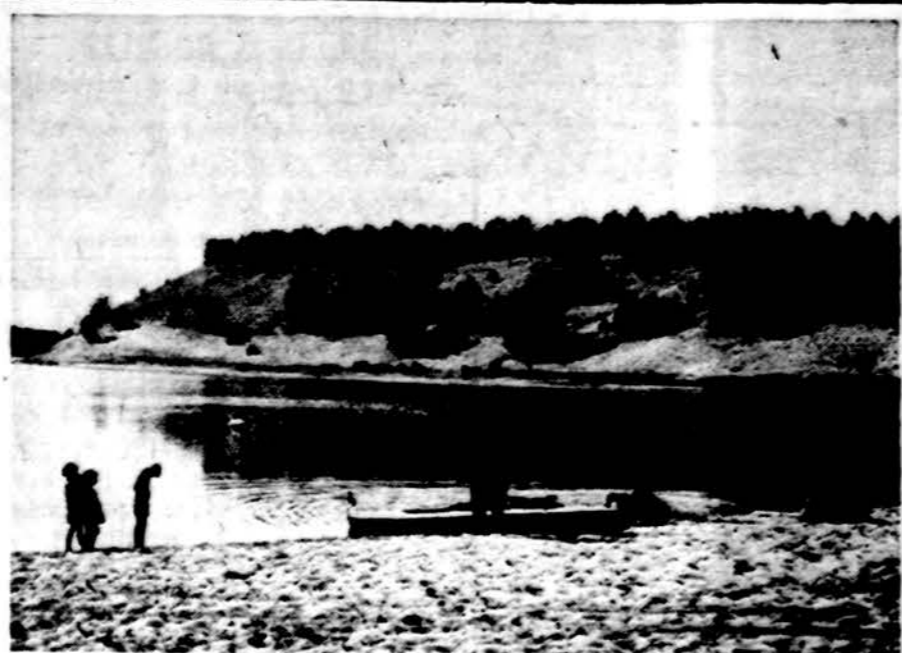
Vaizdas iš Vilniaus krašto

Bell romanai ir novelės liečia dabarties Vokietijos vidurinės klasės žemesnius žmones. Jie džiaugiasi pokario geru gyvenimu, bet ir jaučia moralinę de-presiją. Jis duoda socialinę be-ltristiką, kuri nėra per daug ap-sunkinta intelektualiniais sam-protavimais, ir tačiau meniškai gili. Jo kalba konkreči ir jaut-ri. Jo moralinis ryžtas dažnai apprendžiamas kokio revoliu-