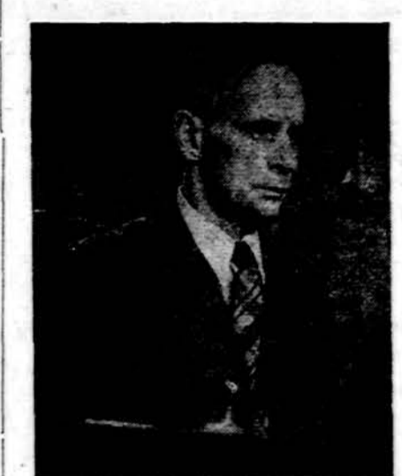
Prof. Vladas Jakubėnas Sąsiuvinyje dainų pavadinimai ir tvarka yra sekanti: