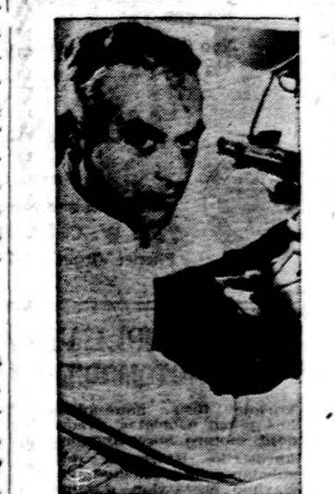
Dr. Petras Brian Medawar, 45 m., vienas iš laimėtojų šių metų Nobelio premijos medicinoje. Čia jį matome Londono Universiteto laboratorijoje. Antras mokslininkas, su kuriuo jis pasidalys premija $43,627, yra Sir Frank MacFarlane Burnet, 61 m., gyvenęs Melbourne, Australijoje. Nobelio premiją juodu laimėjo už savo atradimus persodinant kūno audinius iš vieno žmogaus į kitą.

Pagrindinis romano veikėjas apie šią savo būseną suteikia šitokių tolimesnių paaiškinimų: "Ka jums, Riteri, aš dar galėčiau papasakoti apie tą nepaprastą būseną, kurion pateko mano širdis? Kaip aš galėčiau jums ją pavaizduoti pasaulietiška-