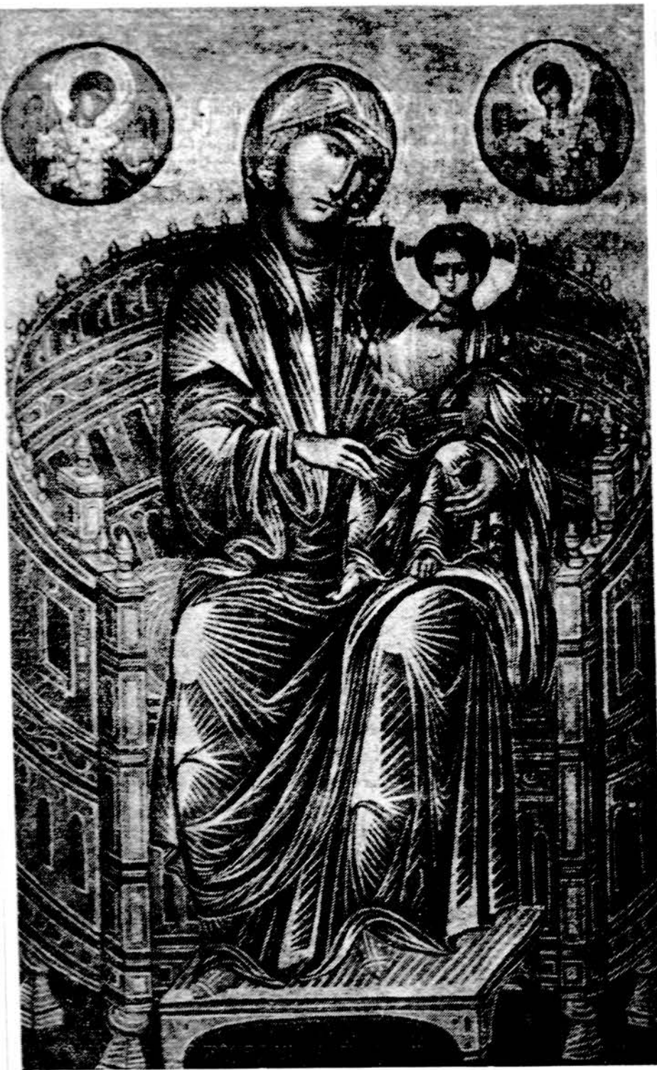
Madona (Bizantinis mokykla apie 1200 m. Paveikslas yra Tautinėje Meno Galerijoje Washingtone).