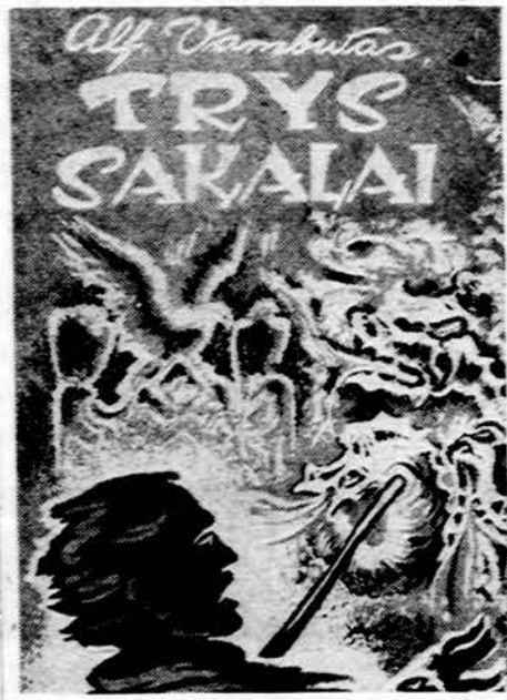
Knygos viršelis, pieštas V. Stančikaitės.

Šioje dalyje autoriaus stiprybė — pasakos eiga. Užumaz-