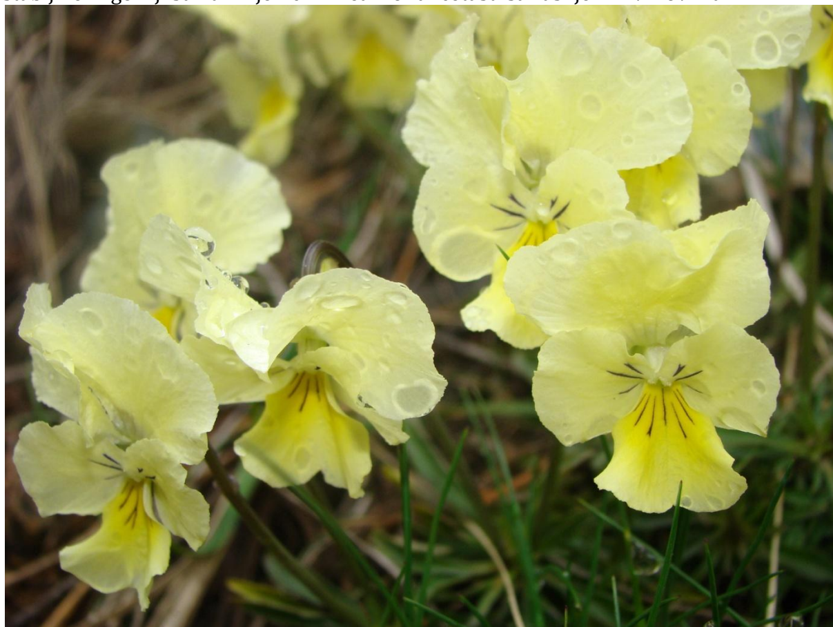
Slika 1

Opis vrste : trajnica sa izduženim stolonima, na trobridim, golim do 25 cm dugim stabljikama koje formiraju busene mogu se razlikovati gornji i donji listovi. Listovi stabljike ili gornji su naizmjenični linearno-lancetasti sa zašiljenim vrhovima.