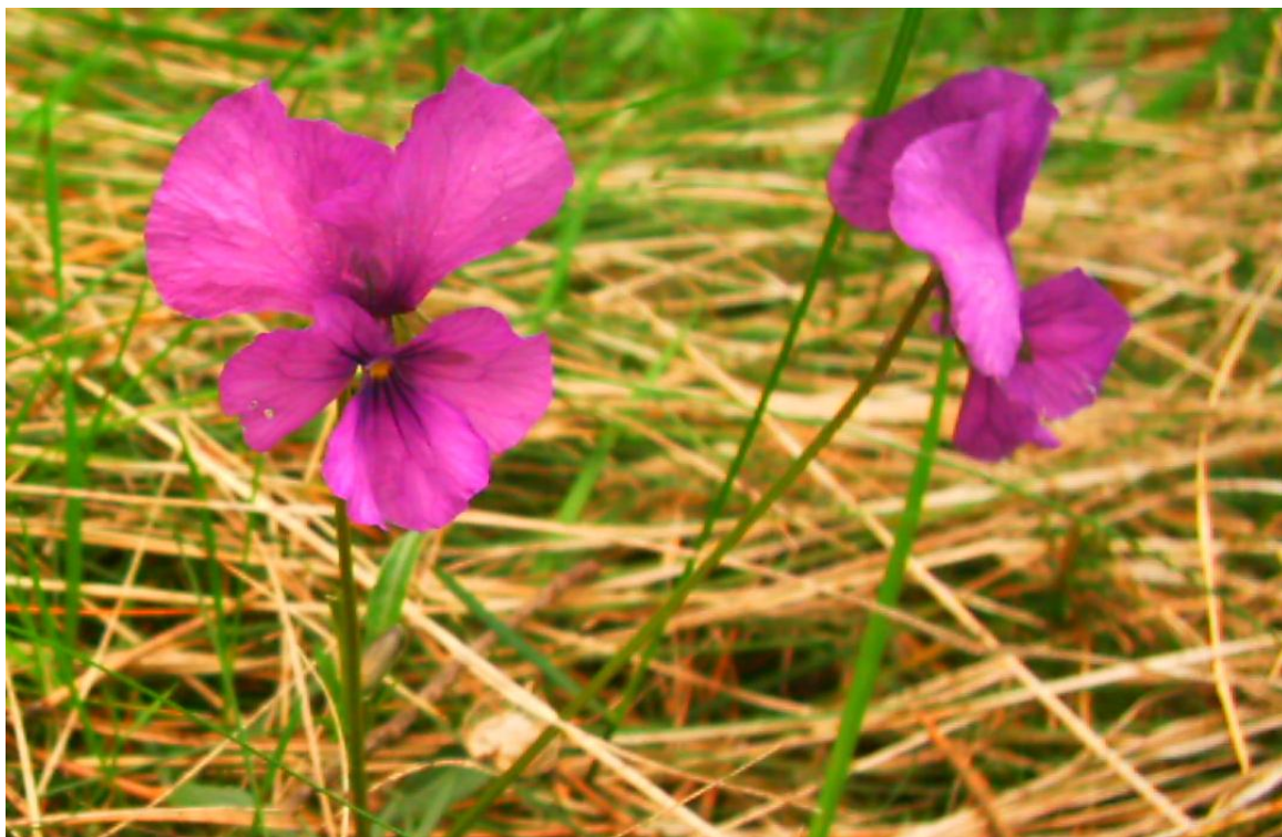
Slika 3