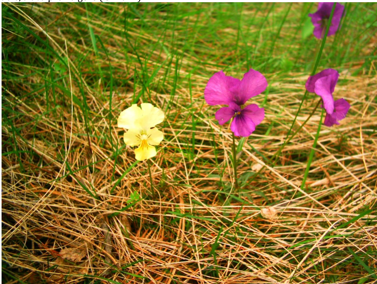
Slika 2

Cvjetovi su zigomorfni tj. nepravilni sa 5 krupnih latica od kojih su tri okrenuti prema dole, a dva prema gore ( slika 1 ).