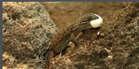
Weiterverwertung unbefruchteter Eier.

H. uruguayensis gehört mit ca. 5 cm KRL zu den kleineren Geckoarten. Wir halten unsere H. uruguayensis in einer Gruppe von 5 adulten Tieren, die wir von unseren Freund Jens Felka erhalten haben und 2 Jungtieren. Die Nachzucht der beiden Jungtiere ist bei uns im Terrarium erfolgt, diese werden von den adulten völlig akzeptiert. Anders wie bei Jungtieren die außerhalb des Terrariums inkubiert werden und dann bei den Adulten wieder eingesetzt werden. Ansonsten wird eine Inkubation im Sand/Humus Gemisch zw. 25°C und 30°C mit einer Nachtabsenkung auf 18°C empfohlen. Das Terrarium sollte eine gut strukturierte Rückwand sowie viele Versteckmöglichkeiten für „Groß und Klein“ haben. Auch sollte man darauf achten, dass auch sehr kleines Futter angeboten wird bei der Aufzucht im Terrarium der Adulten. Gefressen wird alles in passender Größe von Asseln über Ofenfischchen bis zu Heimchen und Grillen. Auf eine ausreichende Vitamin- und Mineralstoffversorgung ist ebenfalls zu achten.