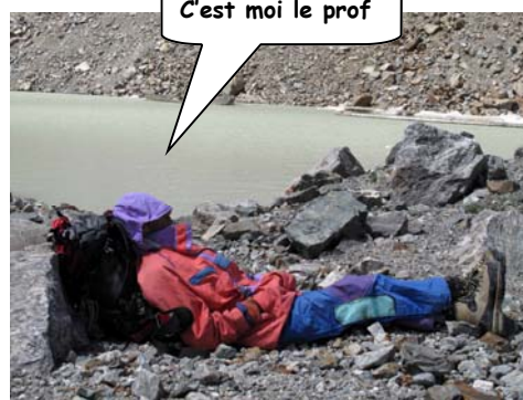
C'est moi le prof