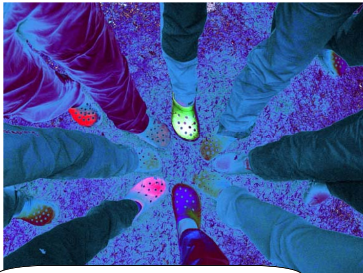
Le test des croc's avant de saluer le Pic Coolidge. froids, indifférents et allumés