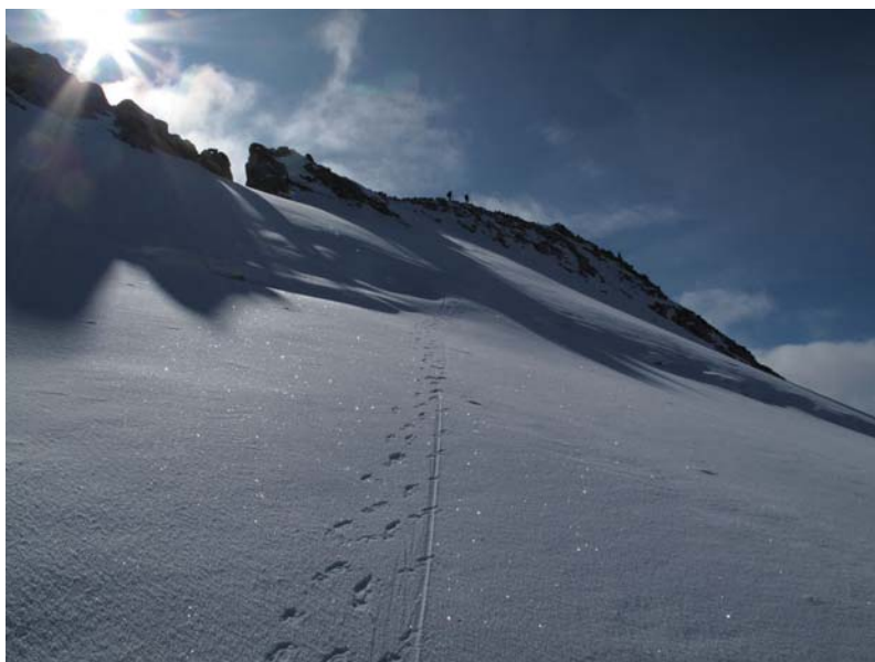
Dammastock - 3630m

Tél. 03 29 31 97 88 enfantsduroc@wanadoo.fr