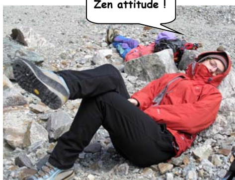
Zen attitude !