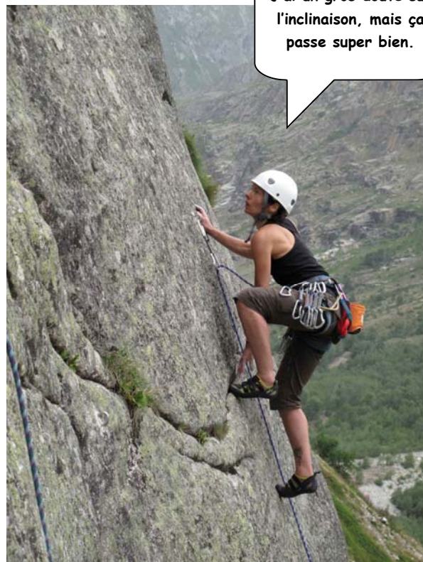
J'ai un gros doute sur l'inclinaison, mais ça passe super bien.