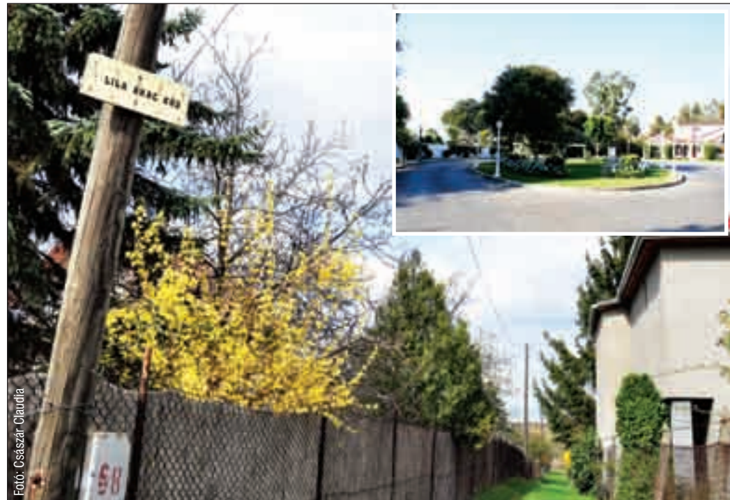
Az ürömi és a Los Angeles-i Lila akác köz

Minden héten több tízezer ülnek le csak Magyarországon, hogy megnézzék, mi történt a Lila akác közben. Itt játszódik ugyanis a világ egyik legsikeresebb, több díjjal kitüntetett sorozata, a Született feleségek. A film legnagyobb rajongói valószínűleg Ürömon élhetnek, hiszen az egyik kis utca lakói önhatalmúlag Lila akác köznek nevezték el az egyik közterületet.