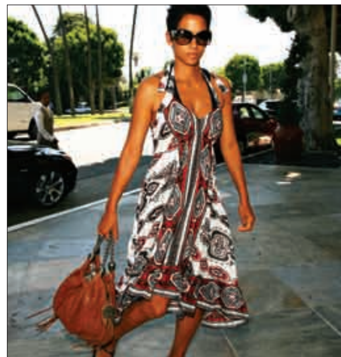
Halle Berry megunt Beverly Hillst?