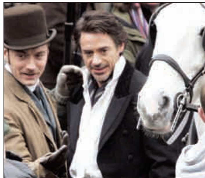
Jude Law és Robert Downey Jr. a Sherlock Holmes című filmben