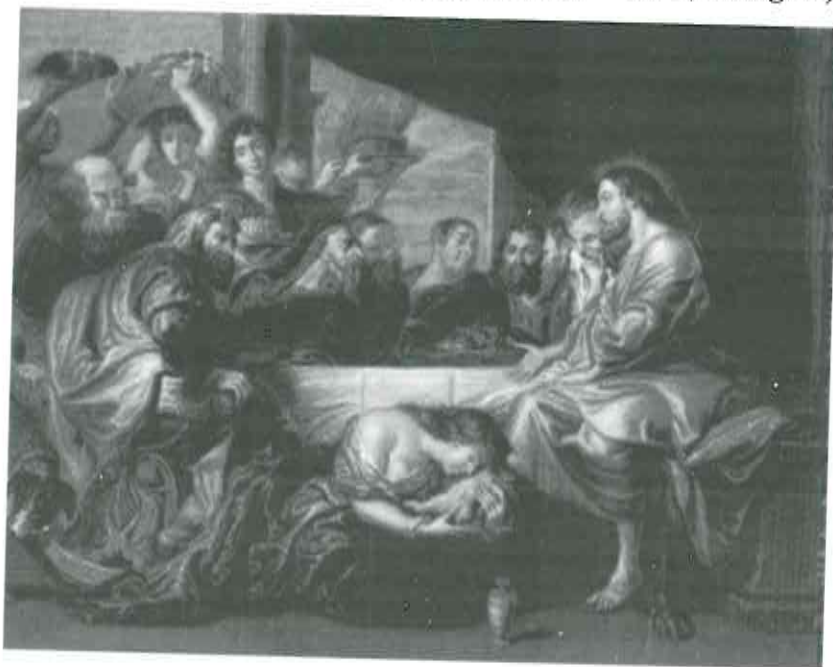
Maria Magdalena lavas la piedojn de Kristo, pentraĵo de Pieter Paul Rubens (Getty Museum)