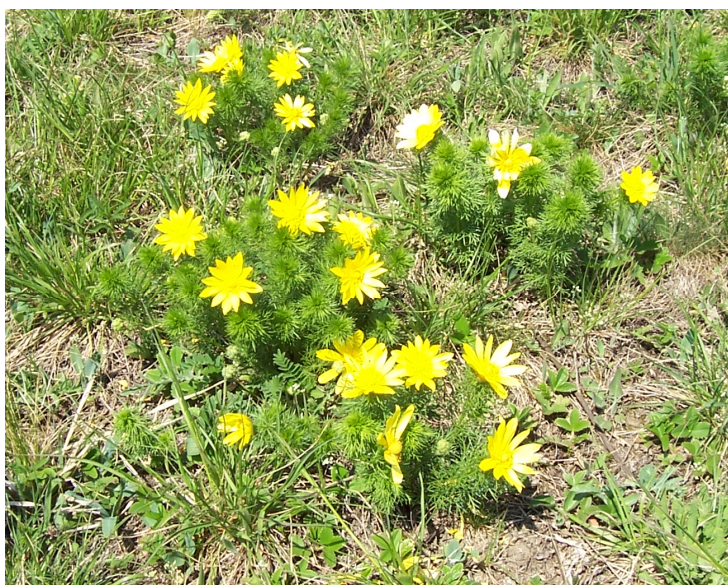
Hlaváček jarní = Printempa adonido