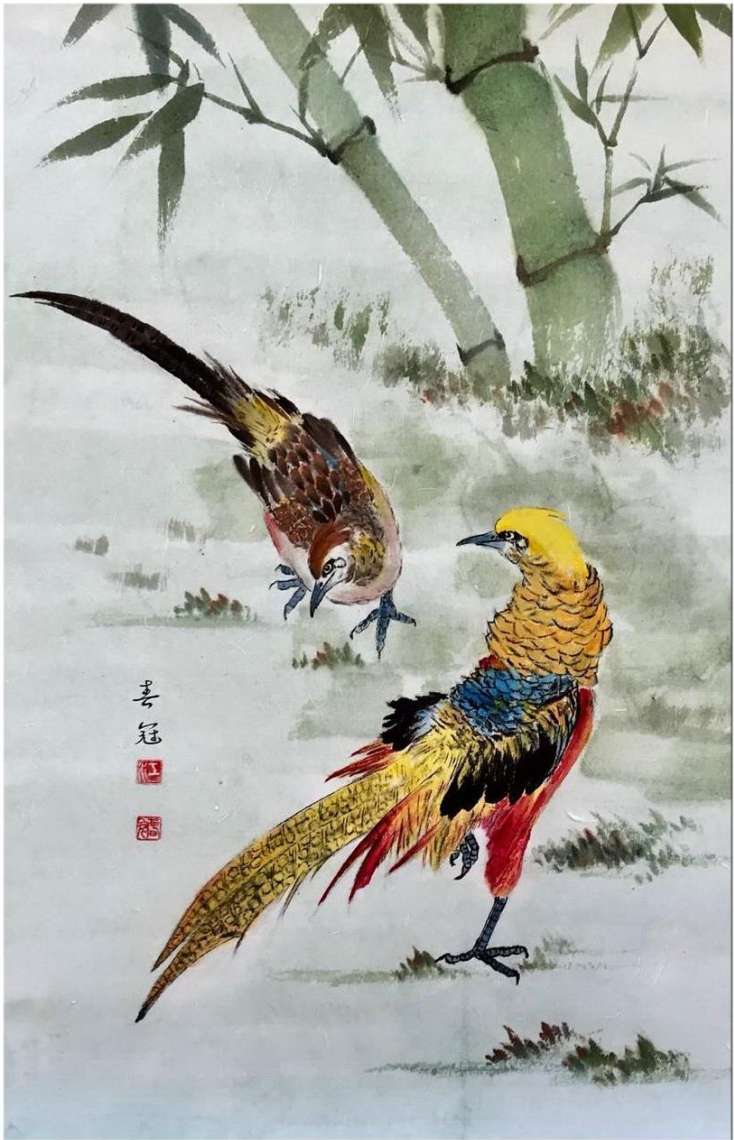
洛杉磯江春冠國畫《錦雞圖》