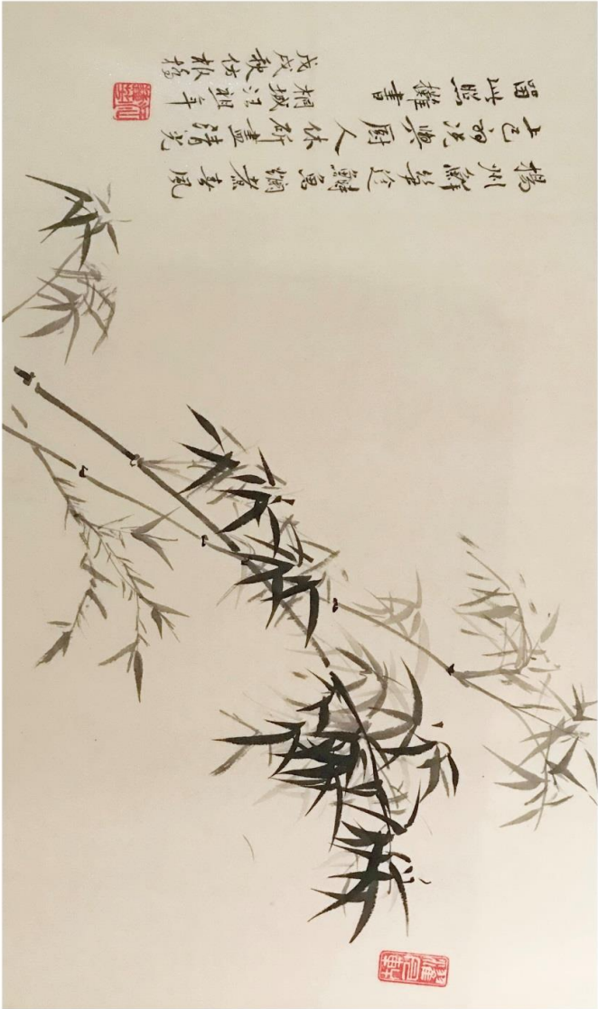
洛杉磯汪蓮芳國畫《墨竹》