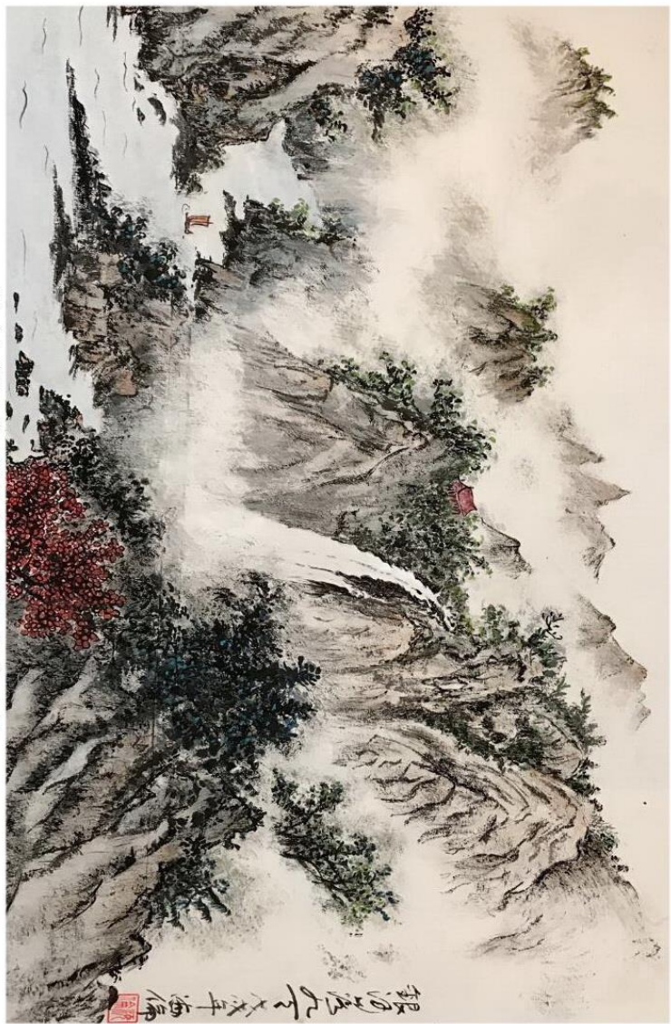
洛杉磯汪孝后國畫《銀河落九天》