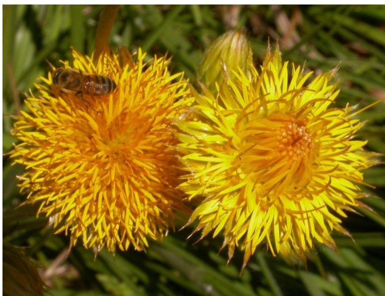
Figura 1. Inflorescências de Schlechtendalia luzulifolia em pleno florescimento.

Schlechtendalia luzulifolia Less., conhecida como bolão-de-ouro, pertencente à subfamília Barnadesioideae , considerada basal para Asteraceae (JANSEN e PALMER, 1987). É uma espécie de porte herbáceo e ereto, com folhas opostas, lineares e nervação paralela, com capítulos medindo entre 20 e 35 mm de diâmetro. As flores são amarelas e as cipselas são turbinadas e densamente pilosas (MELO et al., 2009). O florescimento ocorre de setembro a dezembro e a maturação das cipselas em janeiro e fevereiro (Figura 1).