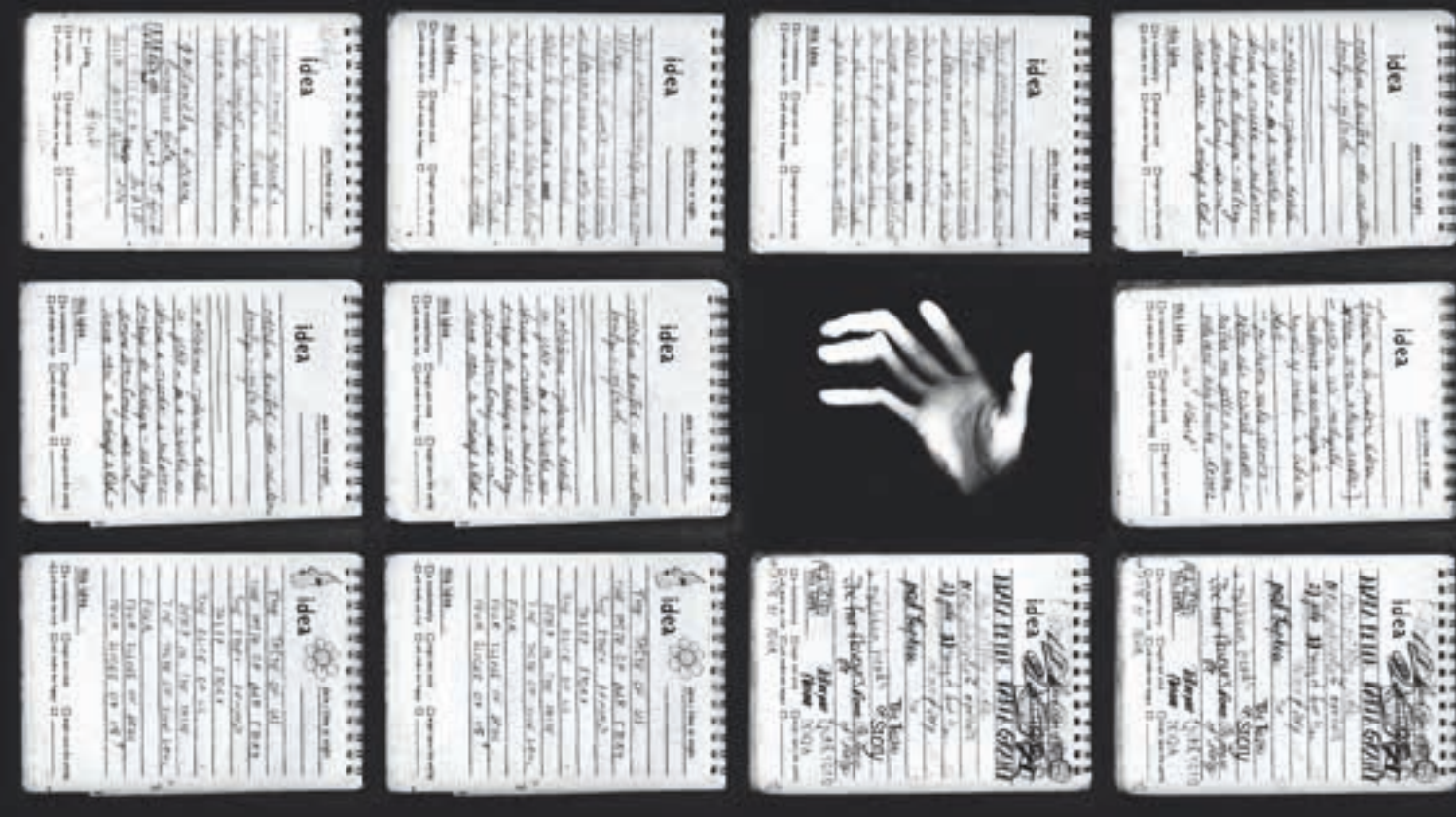
Volám sa Edgar a mám kravu (r. Filip Diviak) —

— text: Lea Pagáčová —