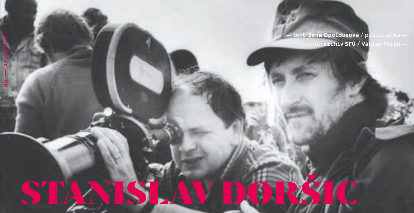
— text: Jena Opoldusová / publicistka — foto: archív SFÚ / Václav Polák —