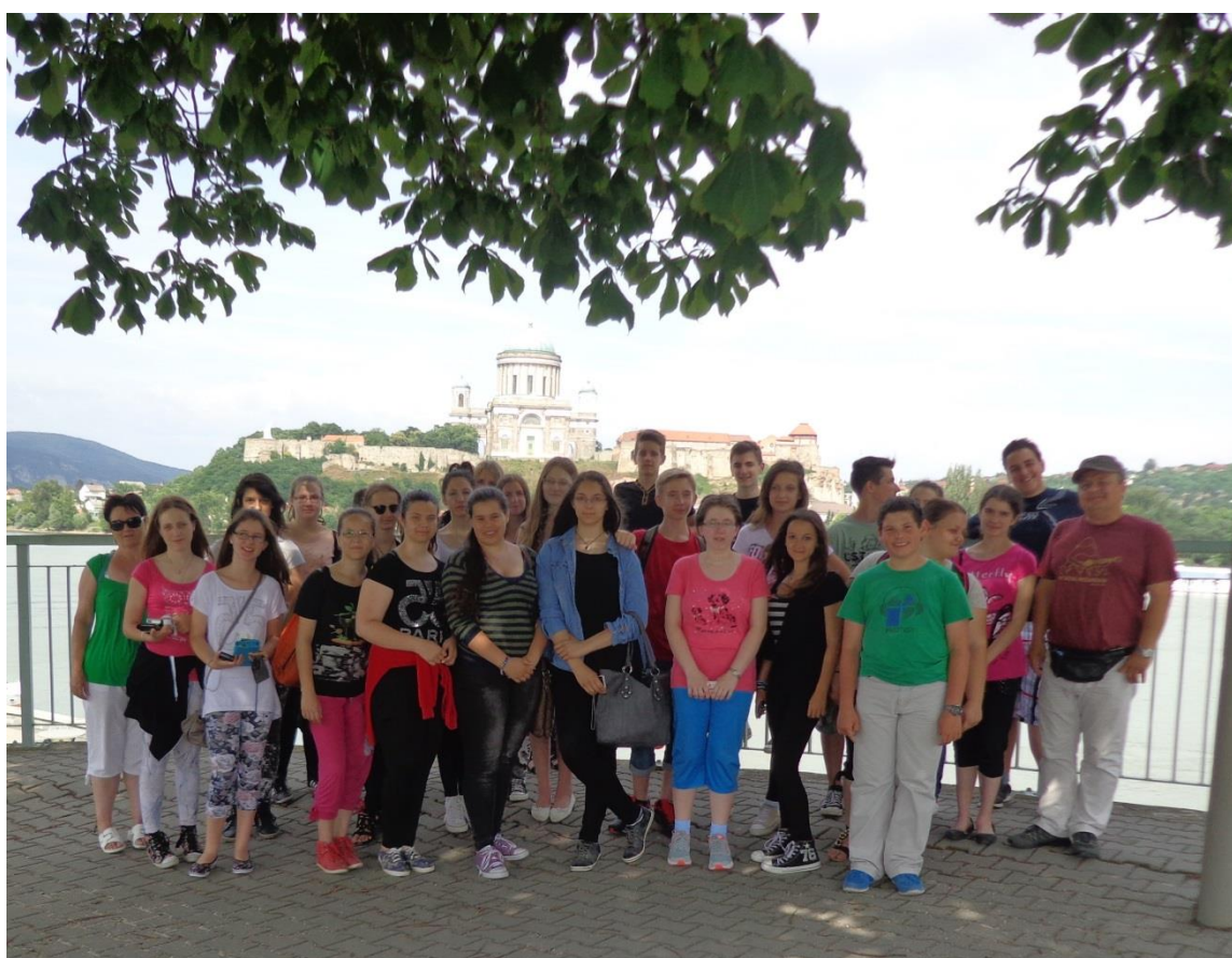
Utolsó osztálykirándulás 2015