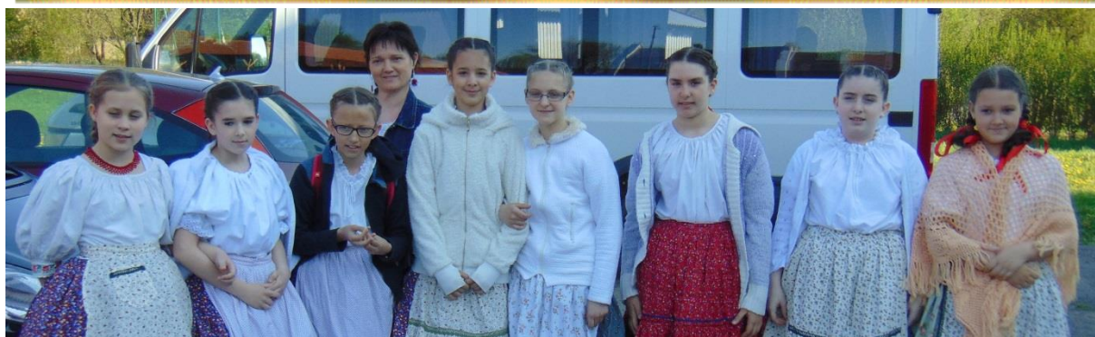
Népdaléneklő versenyen ezüst minősítést szereztek