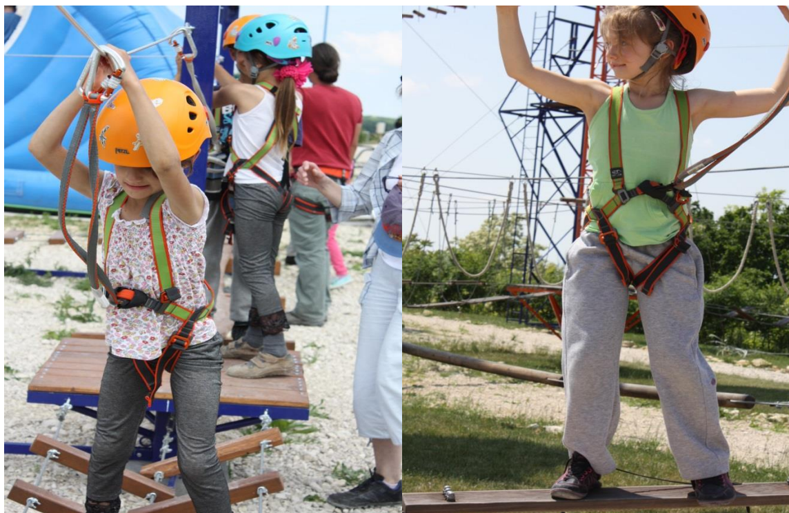
Reziben kirándult az iskola apraja-nagyja