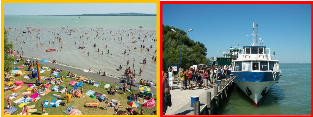
Strandolj és hajózz a Balatonon