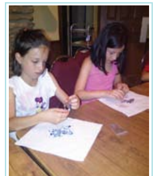
Mariasole and Sophia Bracelet