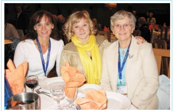
The three generations / Lis tre genrasions.

It was superbly put together. It's unfortunate more friulani didn't come out to benefit from the terrific workshops. I wish I could have attended all of them. They each offered a plethora of information we couldn't get enough of - these are the kinds of workshops our Congressi should be focusing on. Hats off to all organizers - from the workshops to the gatherings (wine and cheese, gala banquet, thanksgiving mass and lunch), to the city tour and cultural show, to the youth outings!!