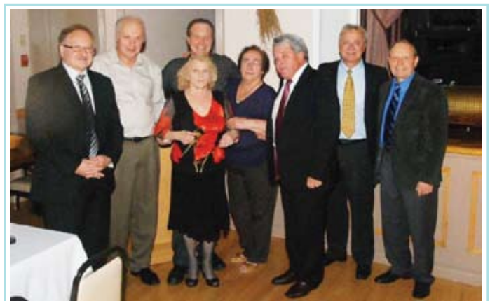
Some of the Board at San Martin Banquet

Merry Christmas and best wishes for a Happy 2013!