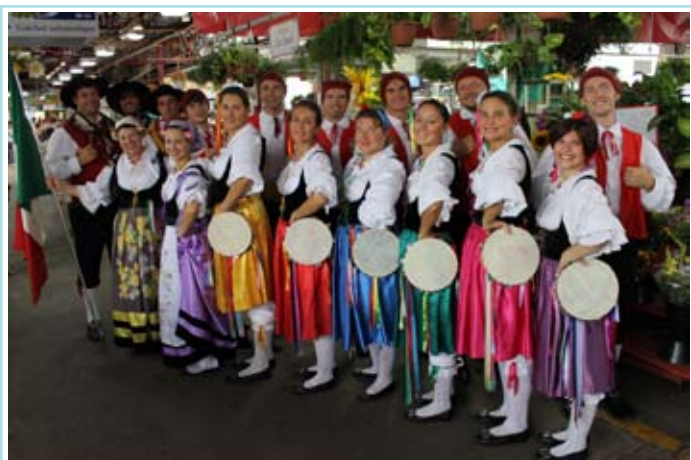
I Danzerini di Lucinico al Marché Jean-Talon