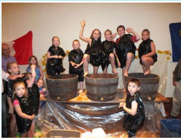
Fieste d'autun - I fruz che à frucin la ue