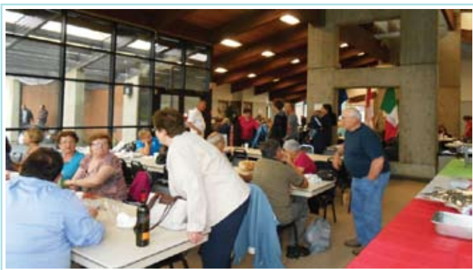
Visiting at the picnic