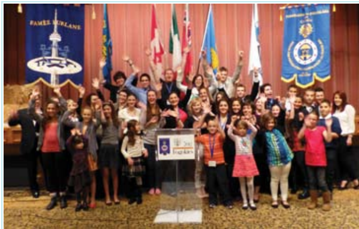
Ariviodesi in Friul al Congres 2014!

La direziòn us ringrazie pal vuestri sostegn