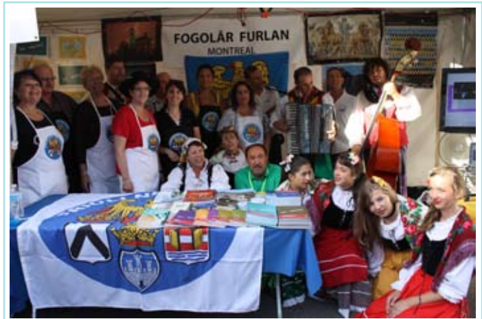
Volontari e membri del direttivo al chiosco

Visitatori che diventavano schiere durante le degustazioni di prosciutto crudo di San Daniele e di formaggio Montasio. Nelle pochissime ore di distribuzione al pubblico nell’arco dei tre giorni, cinque prosciutti e venti chili di formaggio sono stati ottimi portavoce della nostra terra. Tra i visitatori anche diversi friulani di seconda e terza generazione che, pur non frequentando la nostra associazione, hanno ritrovato con il chiosco interesse per le proprie origini culturali e per le attività svolte dal sodalizio montrealese. Tra i visitatori anche il sindaco di Montréal, che non ha lesinato i complimenti dopo aver assaggiato i due prodotti tipici della gastronomia regionale. Il materiale divulgativo inviatoci dalla Regione è letteralmente evaporato e molto interesse ha destato anche il video sul Friuli Venezia Giulia creato dall’Agenzia Turistica Regionale e proiettato in continuo su un grande schermo.