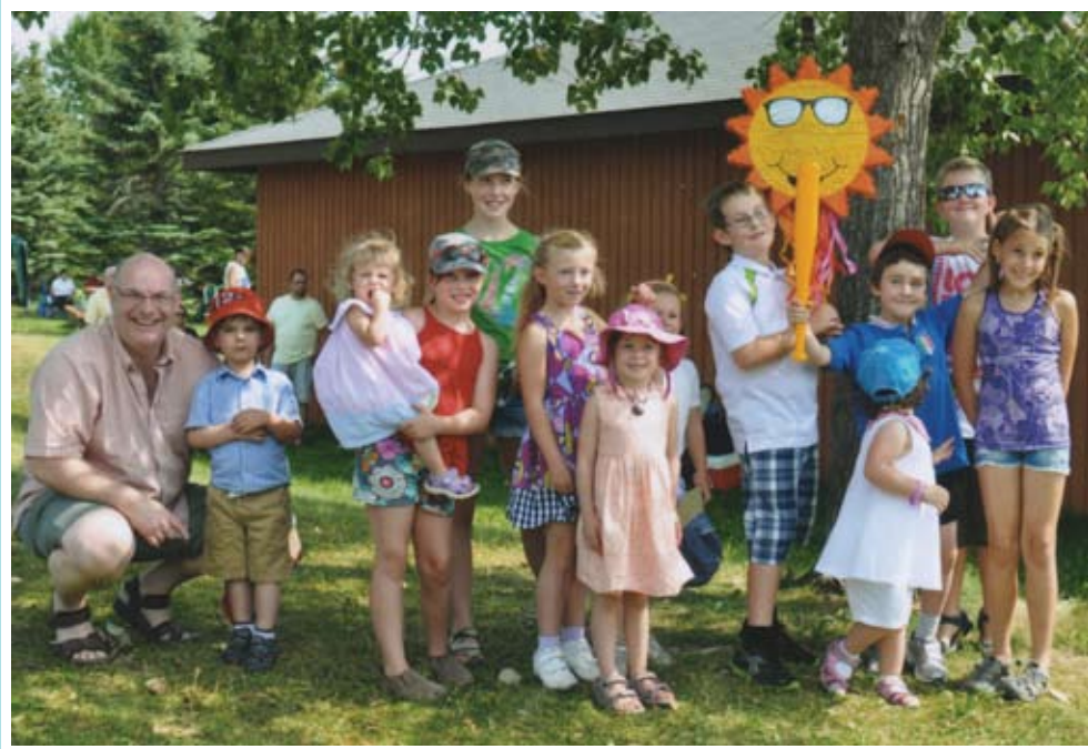
Calgary - canais cha si gioldin al picnic dal Fogolar