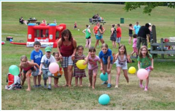
Children playing games at the picnic

Since the last time, the fogolar has held two successful events: the summer picnic and our Festa dell'Uva Dinner and Dance. Our summer picnic in July brought many friends and families together to spend a day at the Park enjoying each other's company. Although the weather could have been better, those that were there still managed to have a great time between the moments of rain. As always, delicious pasta with home-made ragu was prepared and served to all in attendance for lunch. After that, the children took part in various relay games as well as the piñata. To try to have a more cultural element and get the children a little more focused on Friuli, we tried a game where children were given questions that they had to seek answers for by conversing and asking the older generation of Furlans. This was a great way for them to learn a little bit about the language, landscape and geography of Friuli. We are very fortunate to have a new generation of Furlans between the ages of 2 and 10 and are focused to keep the culture preserved for them.