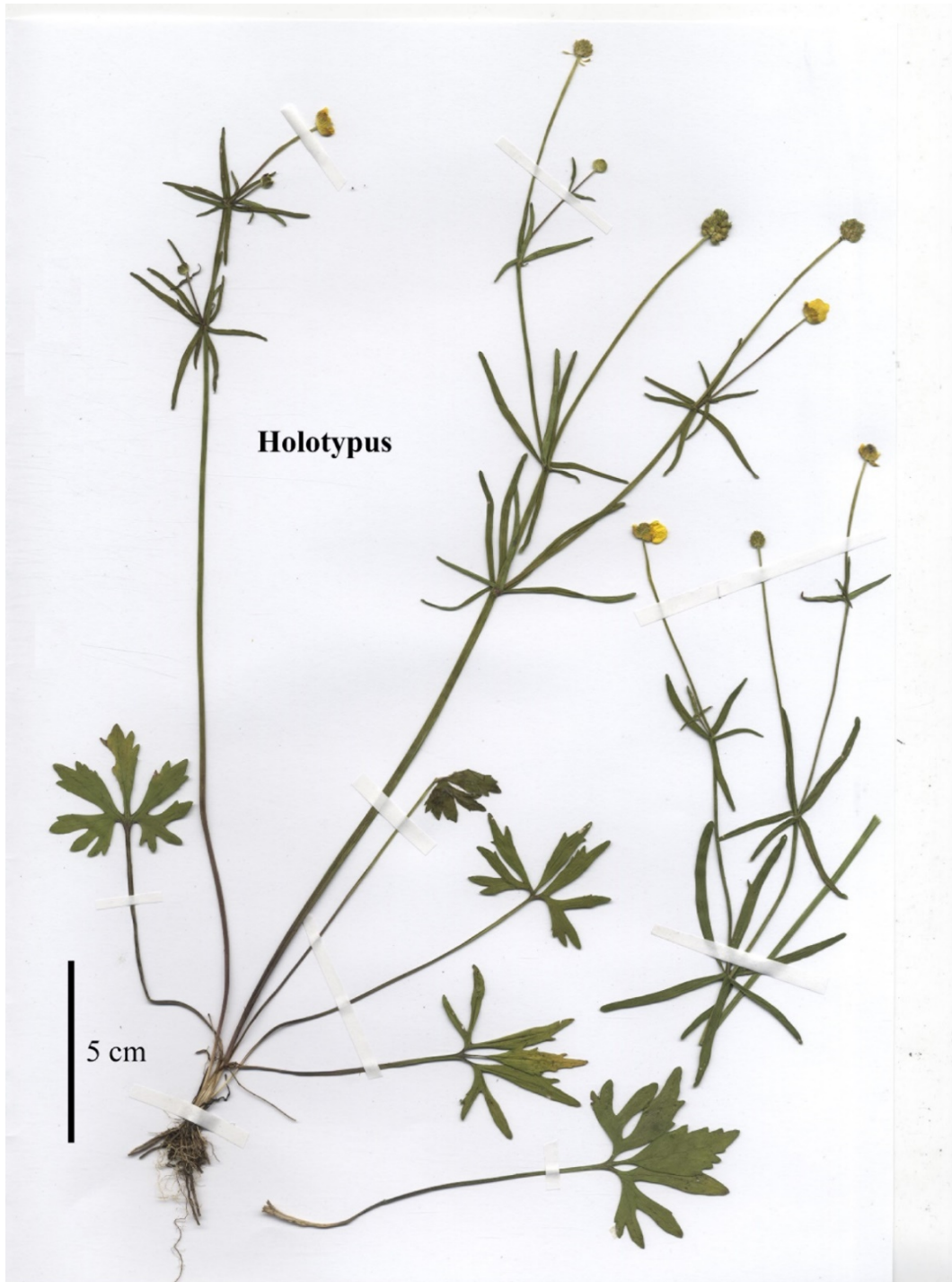
Abb. 2 Holotypus of Ranunculus sarntheinianus Fig. 2 Holotype of Ranunculus sarntheinianus

Haupteinschnitt bis 30%, bei R. sarntheinianus beträgt der Haupteinschnitt des 7. Grundblattes 70–85%. Das 5. Blatt des Grundblattzyklus trägt bei R. variabilis weniger Blatt- randzähne: bei R. variabilis <15, bei R. sarntheinianus >25.