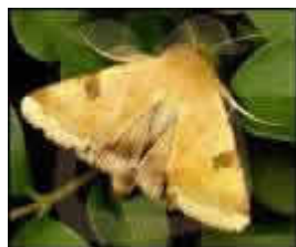
Heliiothis peltigera (Dennis y Schiff) (LEPIDOPTERA: NOCTUIDAE),