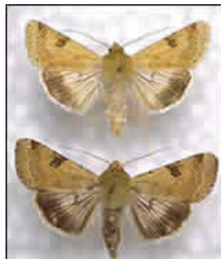
Chrysodeisis chalcites (Esper) (LEPIDOPTERA: NOCTUIDAE),