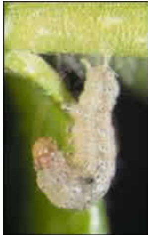
Heliiothis armigera (Hübner) (LEPIDOPTERA: NOCTUIDAE),