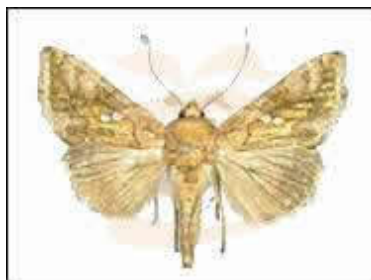
Autographa gamma (L.) (LEPIDOPTERA: NOCTUIDAE).