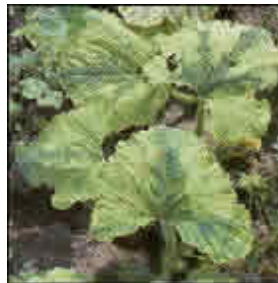
WMV-2 (Watermelon Mosaic Virus-2) (Virus de Mosaico de la Sandía)