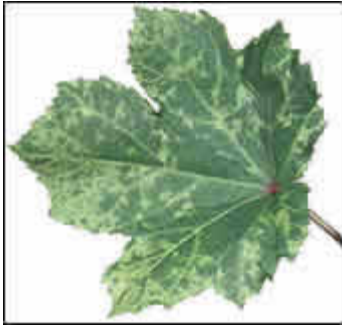
MNSV (Melon Necrotic Spot Virus) (Virus del Cribado del Melón)