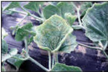
CMV (Cucumber Mosaic Virus) (Virus del Mosaico del Pepino)