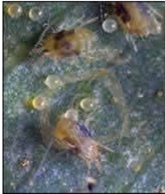
Tetranychus urticae (koch)