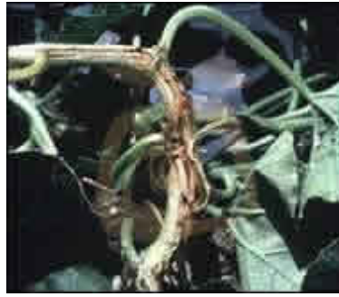
ZYMV (Zucchini Yellow Mosaic Virus) (Virus de Mosaico Amarillo del Calabacín)