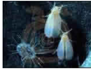
y Bemisia tabaci (Genn.) (HOMOPTERA: ALEYRODIDAE).