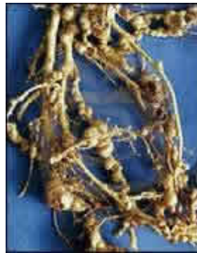
" Raíz atacada por el nemátodo Meloidogyne "

Meloidogyne spp. (TYLENCHIDA: HETERODERIDAE).