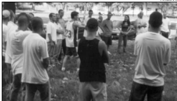
Trote solidário realizado na FAMECA em 2001 pelo Grupo de Oração Universitário.

Para coibir o trote na FAMECA, a direção solicitou o empenho e a colaboração de toda a comunidade universitária e providenciou que a sua proibição fosse amplamente divulgada pela faculdade a veteranos, calouros e