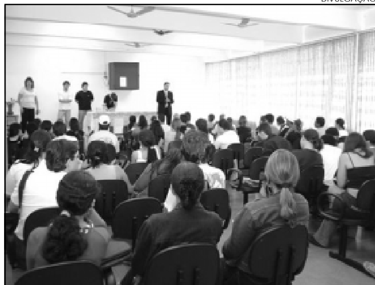
Alunos e professores do Curso de Direito da Fundação Padre Albino levam cidadania à comunidade de Catanduva e região.

Apoio Jurídico a Entidades Assistenciais (NAJEA) é órgão da estrutura pedagógica do curso de Direito da Fundação Padre Albino, vinculado ao Centro de Prática Jurídica (CEPRAJUR) e tem a missão de auxiliar a administração das entidades assistenciais da cidade de Catanduva e região em suas relações jurídicas diuturnas. Atuando em caráter preventivo, tem a função de evitar conflitos jurídicos nas diversas inter-relações entre a entidade assistencial e a comunidade em que é inserida e foi criado com a perspectiva de propiciar aos alunos do Curso de Direito da Fundação Padre Albino uma atividade jurídica complementar ao currículo pleno da faculdade, que lhes permitam interagir com as ações sociais desenvolvidas na cidade de Catanduva e região.