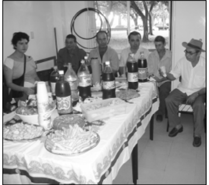
Pacientes da T.O. tiveram sua confraternização.

O Setor de Terapia Ocupacional realizou dia 13 de dezembro, no Hospital Emílio Carlos, uma confraternização pelo final do ano com os seus pacientes.