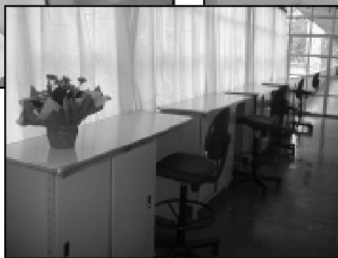
As instalações do laboratório