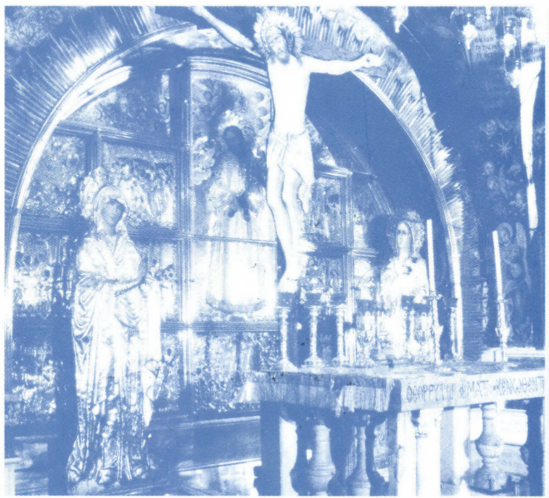
The place of the Crucifixion