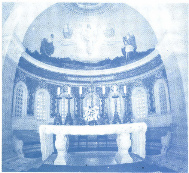
The main altar of the Basilica of the Transfiguration