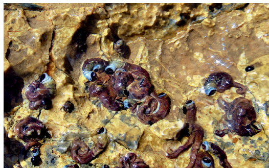
El mol·lusc Dendropoma petraeum . S. Pinedo