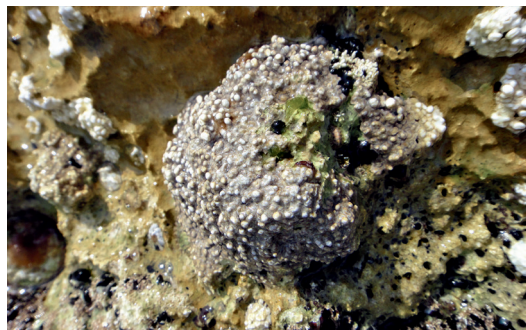
Detall de l'alga Lithophyllum papillosum . E Ballesteros