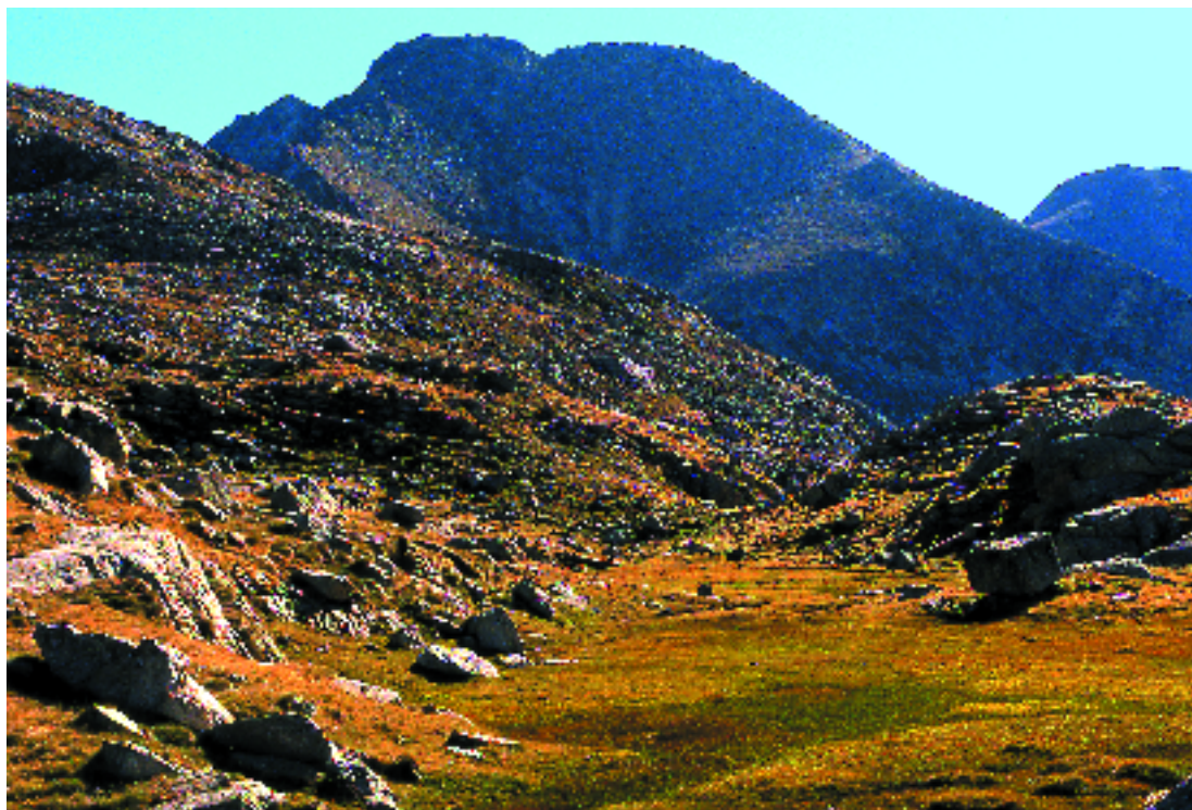
Mollera en un planell de la vall Fosca. A. Petit

Molleres de Scirpus cespitosus , àcides, pirinenques