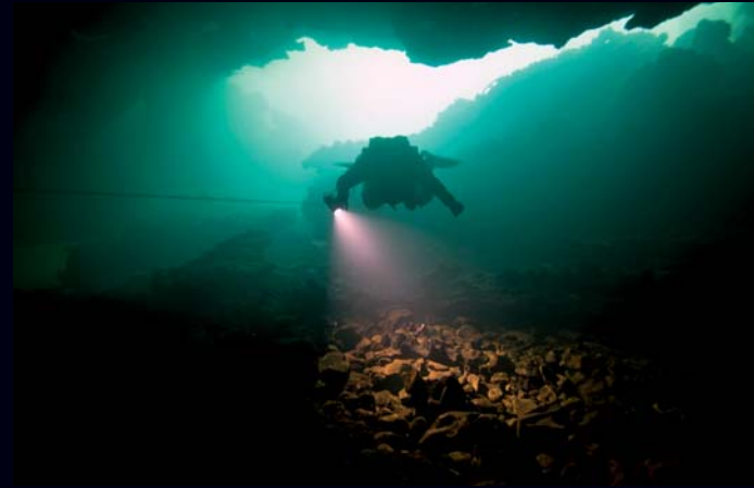
Potopljeni kanali Izvora Zagorske Mrežnice protežu se u raznim pravcima, i to u duljini od više stotina metara od ulaza. Pojedini dijelovi potopljenih kanala izvora mjestimice su široki dvadeset i pet metara, a ukupne su duljine od 1070 m.