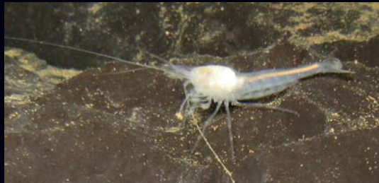
Kapelska špiljska kozica ( Troglocaris kapelana ) endem je Velike kapele i špilja u njenom podnožju.