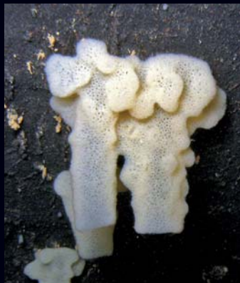
Ogulinska špiljska spužvica ( Eunapius subterraneus ), hrvatski endem, jedina je prava podzemna slatkovodna spužva na svijetu.