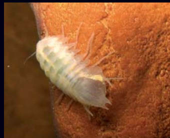
Na dva lokaliteta na širem ogulinskom području utvrđena je nova vrsta kuglašice ( Monolistra n. sp.).