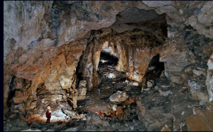
Volumenom veliki prostori u špilji Kuštrovki jedinstveni su za ogulinsko podzemlje.

Najveća kolonija šišmiša na istraživanom području jest zimska kolonija dugokrilog pršnjaka ( Miniopterus schreibersi ), procijenjena je na oko 15 000 primjeraka. Jedna je od najugroženijih vrsta sisavaca u Hrvatskoj.