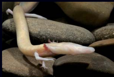
Jedan od najpoznatijih špiljskih organizama na svijetu, čovječja ribica ( Proteus anguinus ), također je stanovnik ogulinskog podzemlja. Endem je Dinarida i rasprostranjena je od tršćanskog krša u Italiji sve do Popovog polja u Hercegovini. U Hrvatskoj je utvrđena u više od 60 nalazišta koja su raspoređena u četiri izolirane populacije s područja Istre, Ogulina i sjeverozapadne Like, srednje Dalmacije i dubrovačkog područja.