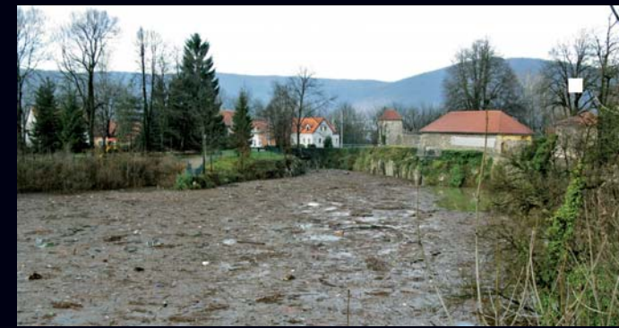
Zbog zagađenja Đulin ponor se povremeno začepi i uzrokuje poplave, a špiljska se staništa devastiraju i dolazi do uništenja špiljske faune.

Špilje i jame u Hrvatskoj vrlo često služe kao odlagališta otpada i kao septičke jame, a taj otpad redovito završi u podzemnim vodama.