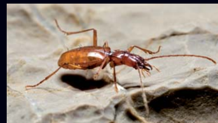
Čak jedanaest špiljskih svojti kornjaša živi na širem ogulinskom području. Langhofferov golemaš ( Duvalius langhofferi ) opisan iz Špilje u Mekoti kod Košara, vrlo je rijedak i poznat je samo iz tri špilje na Kordunu.