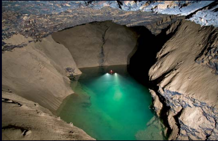
Zagorska peć je podvodno za sada istražena do 70 m dubine. Vode do Zagorske peći dolaze iz Jasenačkog, Drežničkog, Crnačkog i Stajničkog polja.