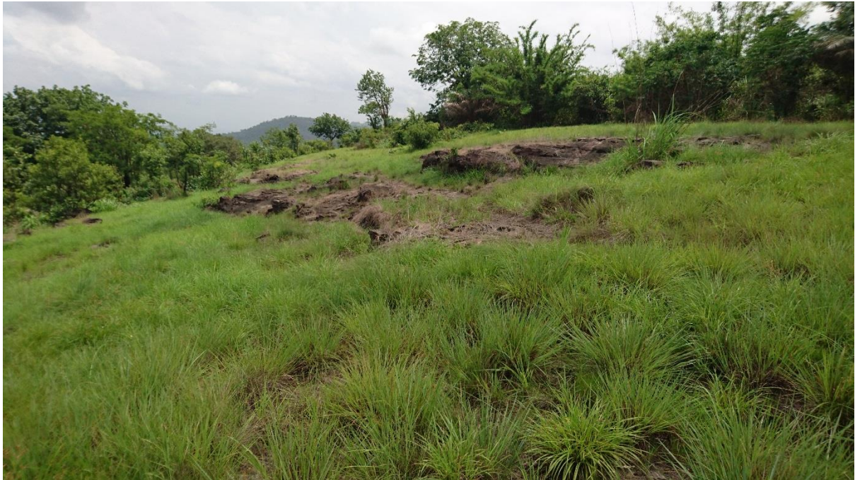
Forêt Classée de Grandes Chutes, juin 2016