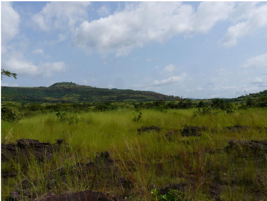
Forêt Classée de Grandes Chutes, octobre 2016