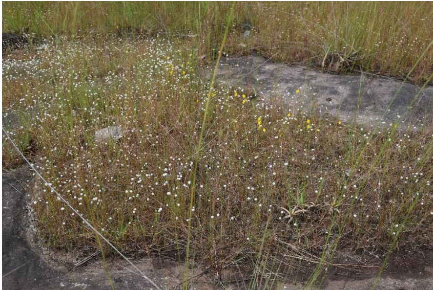
Assemblage d'espèces dans la végétation humide, Grandes Chutes, octobre 2016