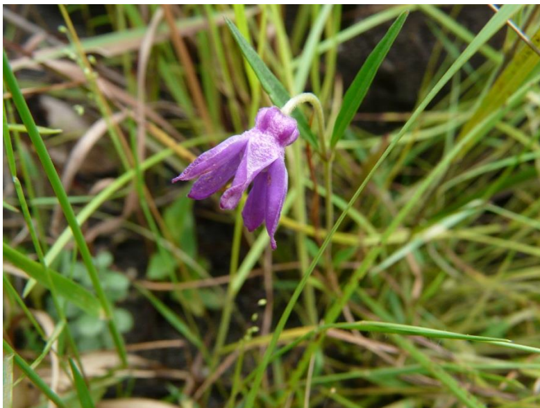
Raphionacme caerulea