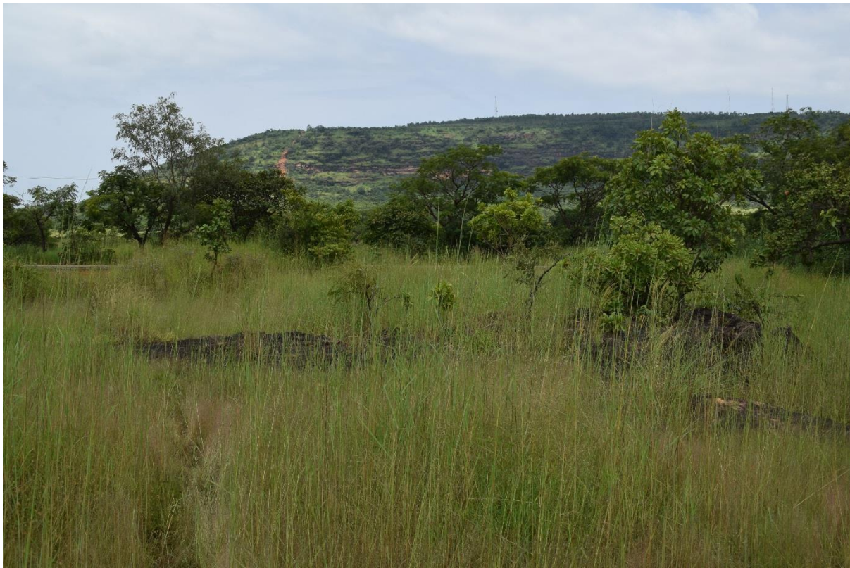
Forêt Classée de Grandes Chutes, octobre 2016