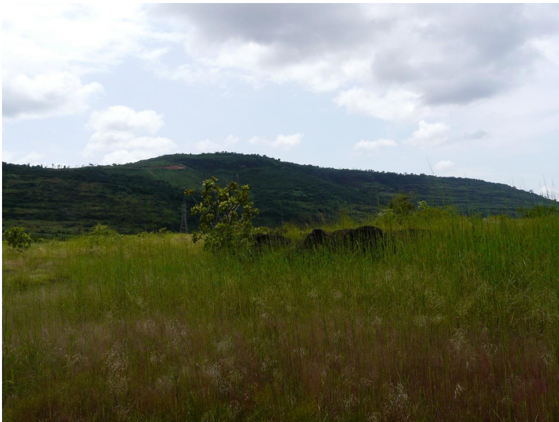
Forêt Classée de Grandes Chutes, octobre 2016