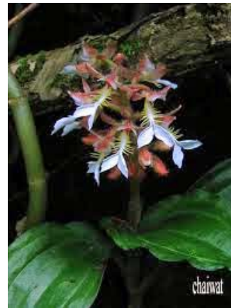
Ảnh: Orchid species