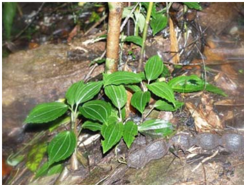
Ảnh: Orchid species

Đồng danh: Anoectochilus densiflorus Mansf. 1930; *Anoectochilus tortus (King & Pantl.) King & Pantl. 1898; Odontochilus densiflorus (Mansf.) Tang & F.T.Wang ex Merr. & Metcalf 1945; Pristiglottis torta (King & Pantl.) Aver. 1996.