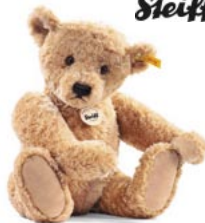
Artikel: SP-66 - Steiff Teddybär "Elmar"

Original Steiff Teddybär aus kuschelweichem Plüsch. Goldbraun, gegliedert und waschmaschinenfest bei 30°C.