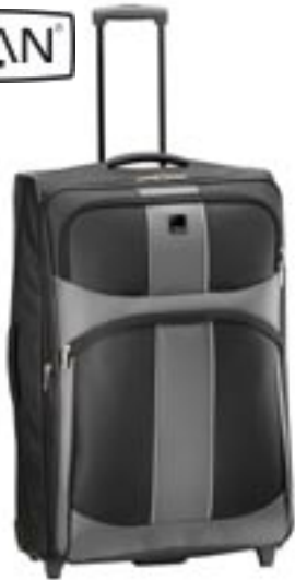
Artikel: PP41/1S - Titan Trolley "Arizona"