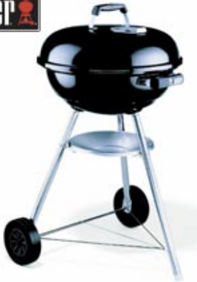
Artikel: K-326 - Weber Kugelgrill „Compact Kettle“, 47 cm

Das preisbewusste Einstiegsmodell überzeugt mit allen Qualitäts- und Sicherheitsmerkmalen eines Weber Grills und heizt kräftig ein. Günstig im Preis, benötigen der Compact Kettle bei der Montage einige Handgriffe mehr. 100 % Grillspaß garantiert!