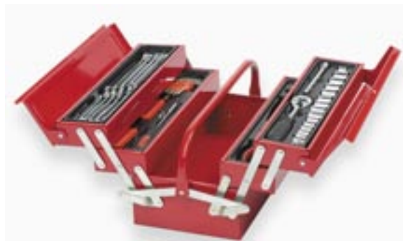
Artikel: ST-77 - 61-tlg. Werkzeugset im Metall-Werkzeugkasten

Netzanschluss: 230 V ~ 50 Hz; Leistung: 1.010 Watt, Drehzahl: 11.000 min -1 , Scheiben-Ø 125 mm