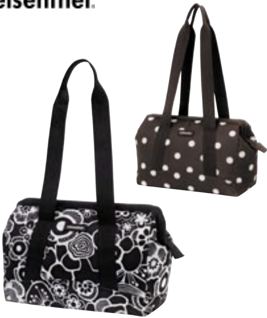
Artikel: P-97 - Reisensthe Allrounder S Farben: fleur schwarz und mokka dots

Der allrounder S kann und will seine Herkunft nicht verbergen: Auch er baut in seiner Ausstattung auf das Beste einer klassischen Arzttasche, erhöht aber mit der Verwendung als Handtasche die modische Fieberkurve. Die Tragehenkel sind lang genug, um sich den allrounder S auch über die Schulter zu hängen. Die Steckfächer sowohl an den langen als auch schmalen Seiten schaffen Ordnung und Übersicht im großzügig bemessenen Innenraum. Ein in die Öffnung eingearbeiteter, unsichtbarer Metallbügel optimiert den Zugriff.