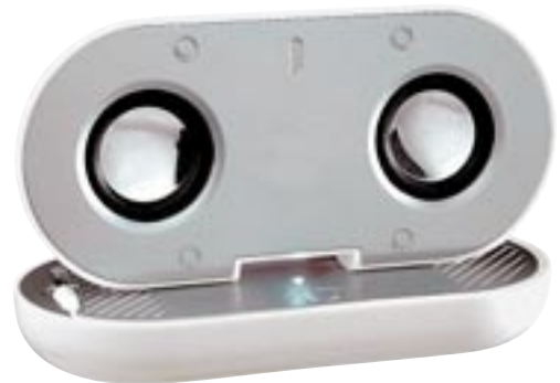
Artikel: KH-39 - Mobiles Lautsprechersystem

Dieses mobile Design-Lautsprechersystem können Sie an Ihren PC, MP3-, MP4- oder CD-Player anschließen um immer und überall Musik zu hören. Inkl. Standard 3,5 mm Stereo-Audiostecker. 2 klangvolle Lautsprecher mit je 3 Watt Ausgangsleistung. Benötigt 4 x 1,5V AAA Batterien (nicht im Lieferumfang enthalten)