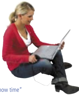
Artikel: C-65 - Finger Mouse „Show time“

Optische Fingermause für mehr Mobilität am Arbeitsplatz. 2 Mousebuttons, Scrollrad, Fingerhalterung mit Klettverschluss, textillumanteltes USB-Kabel (Länge ca. 115,0 cm), mit gummiertem Gehäuse. Verpackt in Geschenkbox.