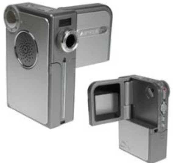
Artikel: KA-81 - Aiptek digitaler Camcorder