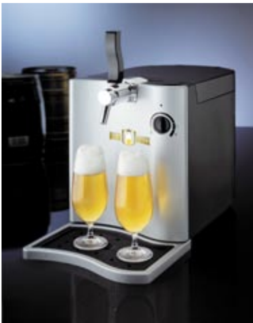
Artikel: K-202 - Bier Maxx

Ihr Stammlokal sieht Sie in Zukunft seltener!