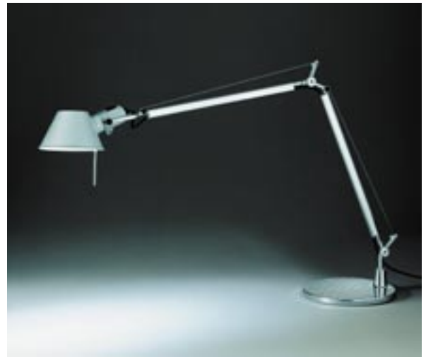
Artikel: L-77 - Artemide Tolomeo Tavolo Schreibtischlampe

Die Tolomeo Tavolo ist der absolute Klassiker! Die Schreibtischleuchte bietet ideales Licht für einen großen Arbeitsbereich, ist an Kopf und Arm individuell ausrichtbar und wird – ganz praktisch – mit Glühlampen bestückt. Ob zu Hause oder im Büro, die Tolomeo passt überall hin. Designer: M. De Lucchi, G. Fossina Jahr: 1987 Material: Aluminium Fassung: E27 Auszeichnungen: Compasso d'Oro Haus Industrieform SNAI-Oscar des Arch. d'Intérieur