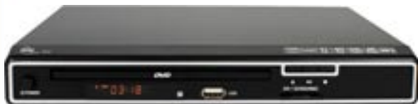
Artikel: BE-300 - Elta DVD-Player

5.1 Kanal DVD Player mit MPEG4 Funktion, USB-Anschluss, 3in1 Kartenleser und 5.1 Decoder. Außerdem verfügt dieses Gerät über eine MP3-Aufnahmefunktion (Encoding) über USB und Kartenleser, d. h. beim Abspielen einer Audio CD kann diese direkt in das MP3-Format umgewandelt und auf einen USB-Stick, MP3-Player oder SD/MMC/MS-Karte aufgenommen werden.