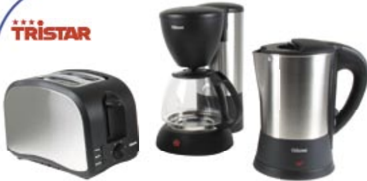
Artikel: K-250 - Tristar 3-tlg. Frühstücks-Set