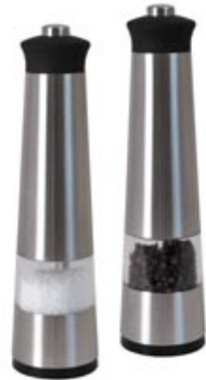
Artikel: K-760 - Elektrische Salz- und Pfeffermühle, 2er Set

Platzsparend und jederzeit griffbereit dank einklappbarer Wiegefläche. Mit separater Halterung zur leichten Wandmontage. Glas-Wiegefläche aus Sicherheitsglas (d=16 cm) Zifferngröße: 12 mm Mit Timer und Uhr 1 g Einteilung 5 kg Tragkraft Tara-Zuwegfunktion Abschaltautomatik Umstellung von g/lb/ml/fl.oz Inklusive 2x AA 1,5V Batterien