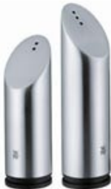
Artikel: WMF-139 - WMF Salz- und Pfefferstreuer „Evolution“

Cromagan 18/10, matt, Bodenstopfen ABS Kunststoff schwarz