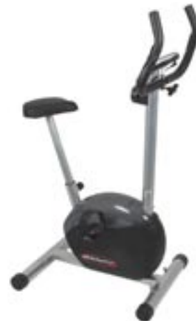
Artikel: F-241 - Heimtrainer mit magnetischem Bremssystem

Maße: Lauffläche: ca. 102,0 x 33,5 cm Gerät (aufgestellt): ca. 116,0 x 56,5 x 106,0 cm zusammengeklappt: ca. 116,0 x 56,5 x 38,0 cm