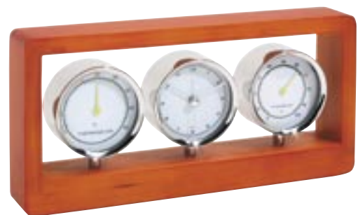
Artikel: T-300 - Wetterstation „Frame“

Exklusives Set aus Damen- und Herren Armbanduhr im klassischen Design, 3 ATM wasserdicht, echtes Lederarmband in hellbraun, hochwertiges Quartz Uhrenwerk mit Stunden-, Minuten- und Sekundenzeiger Verpackung: Ansprechende Geschenkbox