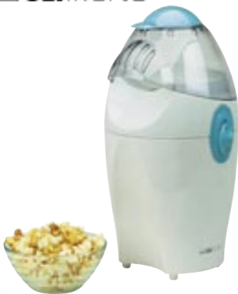
Artikel: K-165 - Clatronic Popcorn-Maschine

Popcorn-Herstellung durch Heißluft - dadurch weniger Kalorien - Ein gesunder und schmackhafter Snack für die ganze Familie!