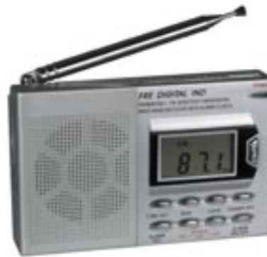
Artikel: BE-60 - Weltempfänger mit Digitalanzeige

9-Band Weltempfänger, UKW / MW und 7 Kurzwelle mit Digitalanzeige und Uhr mit Weckfunktion, Hintergrund beleuchtet, Kopfhöreranschlußbuchse, integrierter Lautsprecher, ausziehbare Teleskopantenne, Trageschlaufe und LED-Anzeigeleuchten.