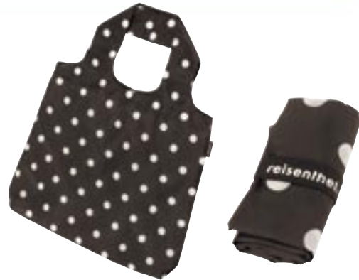
Artikel: P-385MD - Reisen thel Mini Maxi Shopper, mokka dots

Weil jeder so gut wie 1.000 Taschen ist! Wenn man auch an die Kleinigkeiten denkt, kann alles nur besser werden. Deshalb hat der Mini Maxi Shopper statt des Etuis jetzt ein breites Flexband. So geht das Zusammenklappen noch unkomplizierter und macht ihn noch schneller einsatzbereit. Außerdem sind die längeren Henkel jetzt bequemer über die Schulter zu tragen. Aber vor allem spart die Verwendung des Mini Maxi Shopper der Umwelt eine unzählige Menge an Plastiktüten - ihn immer dabei zu haben, ist also eine gute, grüne Idee!