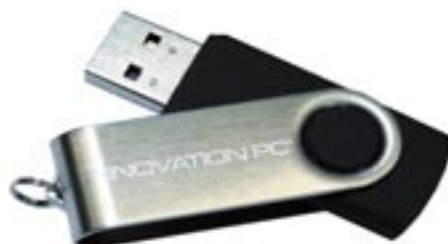
Artikel: C-114 - USB Stick

USB Universalsset bestehend aus: - Mini optischer Maus, ausziehbar - Ohrhörer, ausziehbar - USB Hub mit 4 Anschlüssen - USB A/M nach A/F Kabel - IEEE 1394 nach 1394 Kabel - USB A/M nach mini 5P - USB A/M nach A/M - USB A/M nach BM - USB A/M nach mini 4P - IEEE 1394 Firewire - 2 Stück A/F nach RJ45