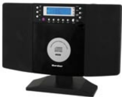
Artikel: BE-22 - Karcher Micro Musik-Center mit CD-Player

Aktuelles, modernes Design, programmierbarer CD-Player (20 Titel), Repeat 1/all, Wiederholung eines oder aller Titel der CD, CD-R und CD-RW kompatibel, Radioteil mit UKW/MW-Empfang, digitale Radio-Frequenzanzeige (Digital Readout), Weckfunktion durch CD, Radio oder Alarmton, Digitaluhr mit 24 Stunden Anzeige, Fernbedienung. Mit AUX-Eingang inklusive Adapterkabel, dadurch wird das Gerät zum Verstärker für einen MP3-, CD-, MD-Player, etc., UKW-Wurfantenne, LCD-Anzeige mit blauer Hintergrundbeleuchtung, Stereo-Lautsprecher, Kopfhöreranschluss, intelligente Kabelführung bei Wandmontage und stehendem Gerät, Gangreserve durch 1x 9V Blockbatterie (nicht im Lieferumfang enthalten), 230 Volt Netzbetrieb über beiliegenden Adapter, 40 Watt PMPO