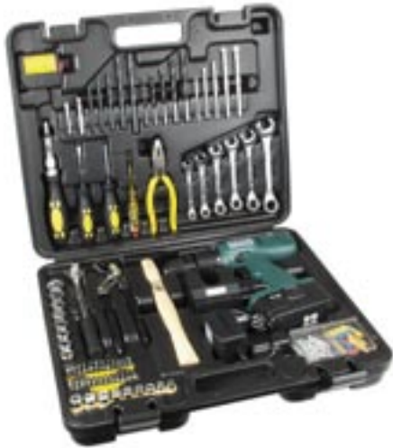
Artikel: ST-75 - Akkuboehrschrauberset im Koffer, 75-tlg.

Das komplette 75-tlg. Akkuboehrschrauberset enthaelt einen 18 Volt Akkuboehrschrauber mit Rechts-/Linkslauf, elektronische Regulierung und ein Ladegeraet, 2 Meter Maessband, 2 Zangen, Hammer, 3 Schraubendreher, je 5 Holz-, Stein- und Metallbohrer, Steckschlüssel, Knarre mit diversen Aufsätzen, Dübel und Schrauben. Verpackt im Kunststoffkoffer.