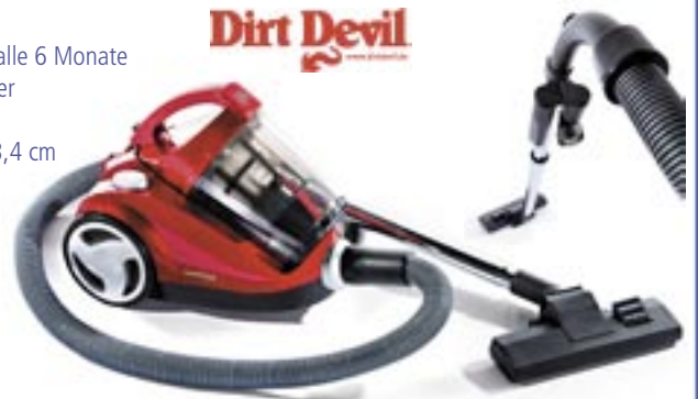
Artikel: K-340 - DirtDevil Centrino clean control