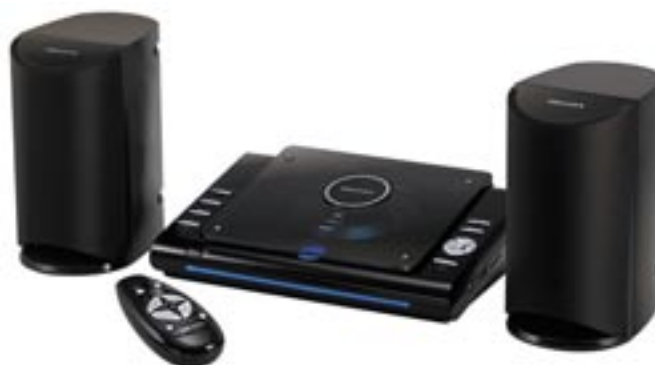
Artikel: BE-249 - SCOTT Musikanlage mit CD-Player