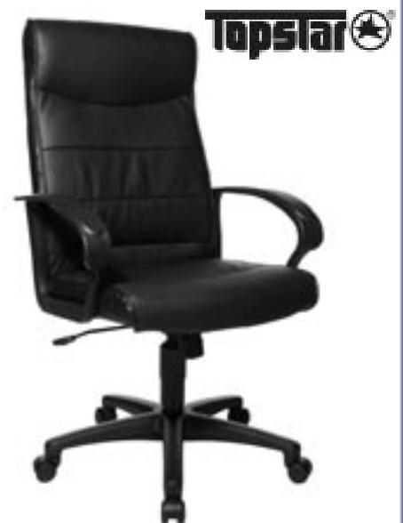
Artikel: M-38 - Topstar Chief Point Ledersessel

Maße aufgebaut: ca. 60,0 x 45,0 x 54,0 cm