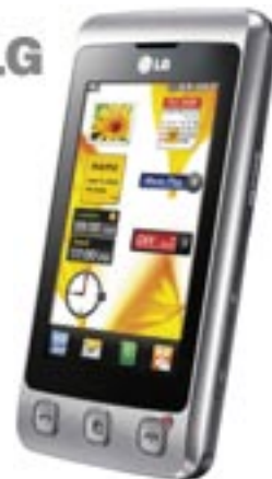
Artikel: X-420 - LG Handy KP500 „Cookie“

Stylisches, ultraflaches Handy mit 3,0 Zoll TFT-Touchscreen, 3,0 MP Autofokus-Kamera, QWERTZ-Tastatur und Buchstabenerkennung. Der Touchscreen lässt sich wahlweise mit dem Finger oder mit dem dazugehörigen Stift bedienen. Inkl. MP3- und Videoplayer, umfangreichen Organizer-Elementen, Dokumentenviewer (Word, Excel, PDF) u.v.m. Testurteil von Stiftung Warentest: gut. Lieferumfang: Akku, Stereo-Kabel-Headset, Bedienungsanleitung, USB-Datenkabel und PC-Software.