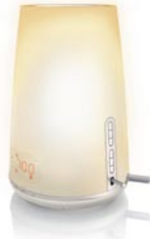
Artikel: K-677 - Philips Wake-up Light

Das Wake-up Light weckt Sie auf natürliche Art und Weise mit Licht, das schrittweise heller wird. Ab sofort wird das Aufwachen wesentlich angenehmer. Sie können sich auch ganz individuell wecken lassen, indem Sie neue Wecktöne und Musik von USB-Geräten nutzen.