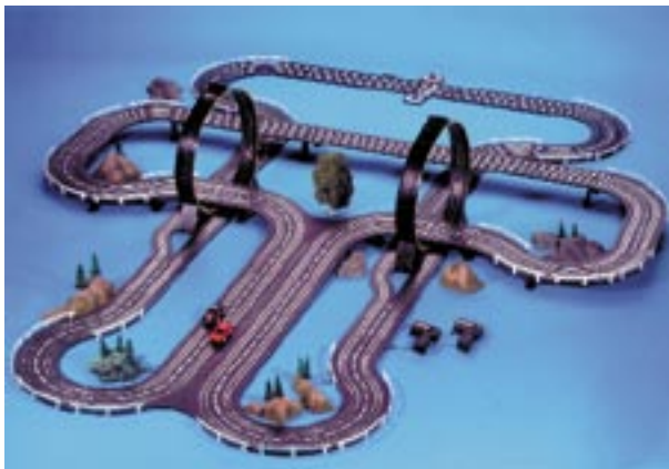
Artikel: SP-84 - Autorennbahn

Autorennbahn mit 2 Loopings, Brücken, 2 Pistol-Handsteuerungen, Rundenzähler, Trafo und 2 Fahrzeugen.