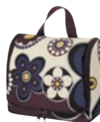
Reienthel Reisekosmetik L

Der Beziehungskrach ist vorprogrammiert: Denn bei der reisekosmetik wird der mannliche Trieb zum Praktischen und der weibliche Sinn fur Ordnung gleichermaen wach. Kein Wunder, denn wo und wie sonst lassen sich unterwegs die Dinge fur die Korperpflege besser und griffgunstiger unterbringen?