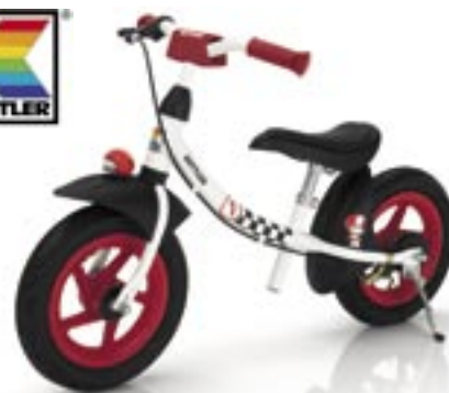
Artikel: F-277 - Kettler Laufrad „SPRINT AIR RACING“

Stahlrohrrahmen mit kratzfester Polyesterbeschichtung, Kugelgelagerte 12,5"-Räder mit Luftbereifung, von 35-43 cm höhenverstellbarer, gepolsterter Sattel, Sicherheitsgriffe mit kindgerechter Handbremse und Lenkerpolster, stabiler Seitenständer, keine Lenkereinschlagsbegrenzung, einfache Montage