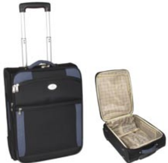
Artikel: PP19/1 - Reisetrolley

Aufwendig gearbeiteter Reisetrolley mit Leichtlauf-Inline-Skater Rollen und Kantenschutz, 2 Innentaschen, innen Gepäckspanngurte, Teleskopziehgriff, 2 Fronttaschen mit Reißverschluß einer davon mit Innenaufteilung, 1 zusätzlicher Rundumreißverschluß zur Vergrößerung des Trolleys, 1 Reißverschlusstasche auf der Hinterseite, 2 gepolsterte Tragegriffe - 1 oben / 1 seitlich.