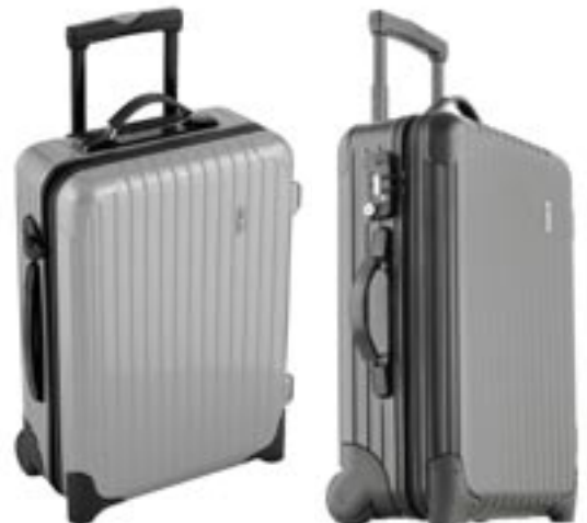
Artikel: PP28/1 - Rimowa Salsa Cabin Trolley IATA Farben: silber und schwarz

Salsa Gepäckstücke geraten nie aus der Fassung. Denn die nahezu unverwüstlichen Polycarbonat-Koffer springen in ihre ursprüngliche Form zurück, sobald der Druck nachläßt. Nicht zuletzt das überzeugte den TÜV Rheinland: Salsa wurde 2004 und 2005 in einer groß angelegten Testreihe als „der Leichteste und Beste“ zum Testsieger gekürt.