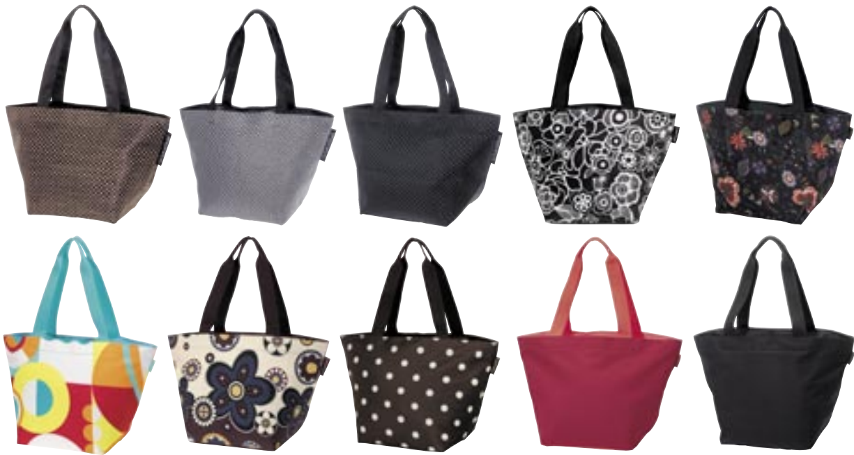
Artikel: P-71 - Reistenthel Shopper M

Farben: barock sand, air bronze, air silber, air schwarz, fleur schwarz, folklore, grafik türkis, marigold, mokka dots, rot und schwarz