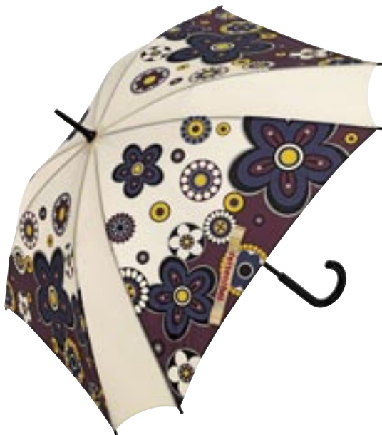
Artikel: P-103MG - Reisenhel Umbrella, marigold

Großer Regenschirm mit sehr stabilem Gestänge. Regen bringt Segen – zumindest für alles, was da grünt, sprosst und blüht. Daher schlägt jetzt auch der Regenschirm dem grauen Himmel ein Schnippen und setzt auf Power! Der Stoff des Regenschirms ist über einen vielfach bewährten Mechanismus gespannt. Dieser verleiht ihm nicht nur seine ungewöhnliche achteckige Form, sondern gibt sich äußerst tolerant gegenüber jedem Windstoß: Das Gestänge ist so biegsam und geschmeidig, dass es sich nach plötzlichem Umstülpen ganz einfach wieder in Form ziehen lässt. - Griff und Schaft aus Echtholz gefertigt - windunempfindliches Gestänge