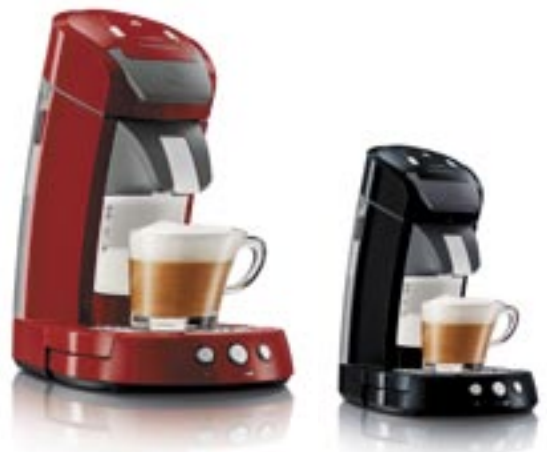
Artikel: K-428 - Philips Senseo Latte Select Farben: rot und schwarz