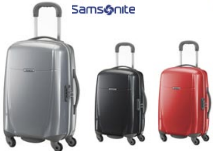
Artikel: PP56/1 - Samsonite Bright Lite Spinner Farben: silber, schwarz und rot

Für Reisende, die Spaß und Abenteuer suchen - mit Bright Lite kommt modischer Schick und Schwung ins Reisen. Volumen: 32 Liter, 4 hochwertige Rollen, Kabinengepäck, Zugriff mit Arretierknopf, beidseitig zu Packen, Material: Aussen: Polycarbonat - Innen: Polyester, großes Hauptfach mit Zwei-Wege-Reißverschluss, Zahlenschloss mit TSA-Funktion