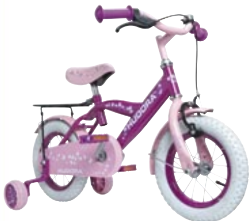
Artikel: SP-232 - Kinderfahrrad, 12"

Maße: ca. 94,0 x 57,0 x 42,0 cm Gewicht: ca. 6,5 kg