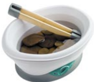
Artikel: F-81 - Medisana Wellness-Steine