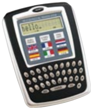
Artikel: T-236 - Übersetzer

Übersetzer für 6 Sprachen (Deutsch, Englisch, Spanisch, Französisch, Italienisch, Niederländisch) mit 5000 Wörtern je Sprache, 10-stelligem Display, mit Datenbank, Taschenrechner und Uhr, inkl. Knopfzelle.