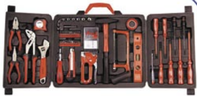
Artikel: ST-129 - 60-tlg. Werkzeugkoffer

60-tlg. Werkzeugsortiment im Klappkoffer, die gebräuchlichsten Qualitätswerkzeuge für den Haushalt.