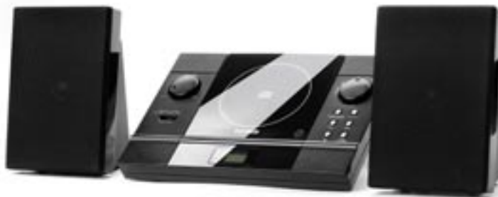
Artikel: BE-328 - Telefunken USB/CD Stereo System

Tuner für UKW/MW vertikal CD-Player mit Zufallswiedergabe Programm- und Wiederholfunktion Wiedergabe von CD, CD-R, CD-RW und MP3-CD USB-Anschluss für MP3-Wiedergabe AUX-IN Audioeingang LCD-Anzeige mit Hintergrundbeleuchtung Kopfhöreranschluss Fernbedienung Wandmontag möglich