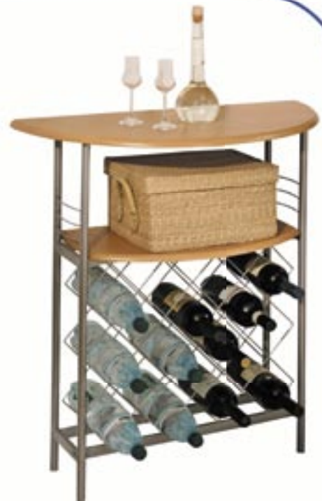
Artikel: M-309 - Flaschenregal „Barolli“

Maße aufgebaut: ca. 56,0 x 37,0 x 81,0 cm