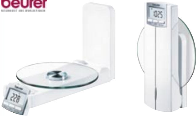
Artikel: K-256 - Beurer Wandküchenwaage

Platzsparend und jederzeit griffbereit dank einklappbarer Wiegefläche. Mit separater Halterung zur leichten Wandmontage. Glas-Wiegefläche aus Sicherheitsglas (d=16 cm) Zifferngröße: 12 mm Mit Timer und Uhr 1 g Einteilung 5 kg Tragkraft Tara-Zuwegfunktion Abschaltautomatik Umstellung von g/lb/ml/fl.oz Inklusive 2x AA 1,5V Batterien