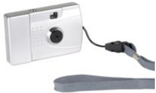
Artikel: KA-89 - Digitalkamera im Scheckkartenformat

Digicam im Scheckkartenformat, 1,3 Megapixel interpoliert (Software), 64MB interner Speicher, hohe Bildschärfe durch optische Glaslinse, 25 Bilder in Hi-Resolution, ausführliche deutsche Software auf CD-ROM - LCD-Display - Selbstauslöser (10 Sekunden) - Funktion zum Aufnehmen von Filmsequenzen von bis zu 58 Sekunden Länge - Serienfotos für Filmsequenz - Löschen aller Fotos - Automatisches Abschalten zum Schonen der Batterien - Zwei Auflösungsmodi: Hoch (Hi) und Niedrig (Lo). In hoher Auflösung können bis zu 25 Fotos und in niedriger Auflösung bis zu 102 Fotos aufgenommen werden - Festobjektiv, 0,5 m bis unendlich - USB-Kabel, Batterien und Software im Lieferumfang