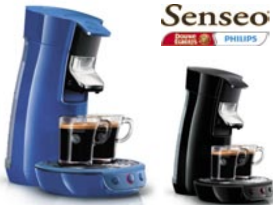
Artikel: K-427 - Philips Senseo Kaffeautomat „Viva Café“ Farben: blau und schwarz

Teilen und genießen Sie besondere Kaffeemomente mit SENSEO® Viva Café. Unterhalten Sie sich bei einer Tasse SENSEO® Kaffee, und genießen Sie gemeinsam das weiche und cremige Aroma. Die benutzerfreundliche Kaffeemaschine SENSEO® Viva Café mit ihren neuen, weicheren Formen ist das nächste Kapitel in der innovativen Geschichte von SENSEO®. Optimaler Komfort - 1 oder 2 Tassen SENSEO® Kaffee in weniger als einer Minute - Höhenverstellbarer Kaffeeauslauf für Ihren Lieblingsbecher. - Automatische Abschaltung für geringeren Energieverbrauch - Großer abnehmbarer Wasserbehälter, der seltener aufgefüllt werden muss - Die Calc-Clean-Anzeige erinnert Sie an die Entkalkung Sensationeller Kaffee - Einzigartiges Brühsystem für besten Geschmack - Große Vielfalt an Kaffeepads für jeden Geschmack - Leckere Crema für Ihren besonderen Kaffeemoment Design - Kaffeeauslauf aus poliertem Edelstahl für einen hochwertigen Look