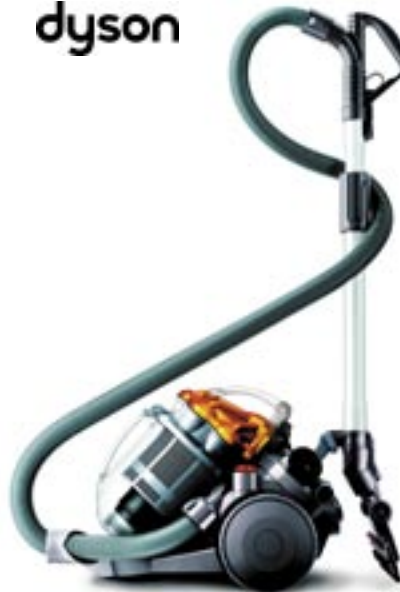
Artikel: K-247 - Dyson Bodenstaubsauger