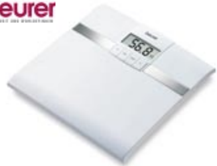
Artikel: K-218 - Beurer Diagnosewaage