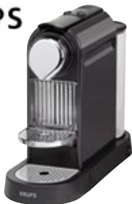
Artikel: K-358 - Krups NESPRESSO CitiZ

Die neue kompakte Krups NESPRESSO CitiZ, perfekt für jede Umgebung, 19 bar Pumpendruck, um die feine Geschmacks- und Aromafülle jedes Grand Cru zu entfalten, automatischer Standby-Modus nach 30 Minuten, einfachste Bedienung per Knopfdruck, Tassen-Programmierung: Für individuelle Tassenfüllmenge, „Flow-Stop“-Funktion: Automatische Abschaltung, kein Überlaufen des Espressos, automatischer Auswurf der benutzten Kapseln beim Öffnen, die leeren Kapseln fallen direkt in den Kapselcontainer. Kapazität ca. 12 Stück, hochklappbare Abtropfschale zur Zubereitung von Latte Macchiato, Abnehmbarer Wassertank; Kapazität: 1 l, Beleuchtete Tasten, Taste zum Starten/Beenden des Brühvorgangs Leistung: 1.260 Watt