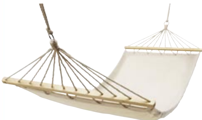
Artikel: M-130 - Hängematte

Endlich mal richtig entspannen, mit dieser Hängematte sind Sie auf dem besten Wege dorthin! Baumwoll-Hängematte mit Seildurchführungen aus Holz. Tragfähigkeit ca. 100,0 kg