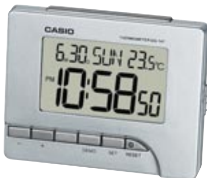
Artikel: T-95 - Casio digital Wecker