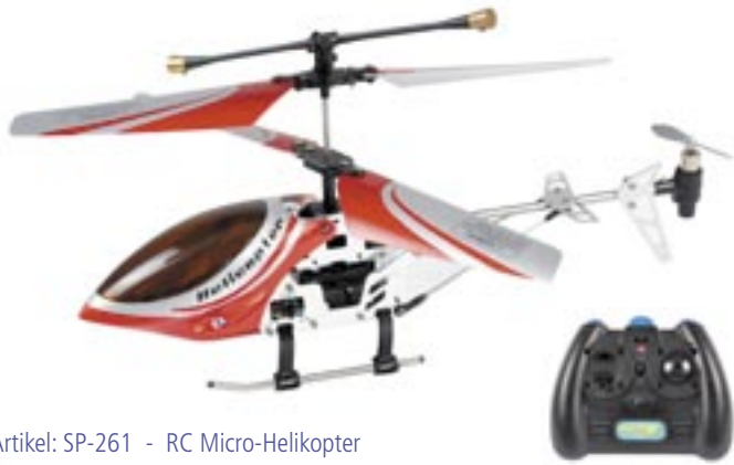
Artikel: SP-261 - RC Micro-Helikopter