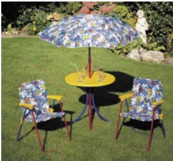
Artikel: M-704 - Kinder-Camping-Set

Balkon-Set bestehend aus 1 Tisch, 70 x 70 x 74 cm und 2 Stühlen, je ca. 47 x 61 x 91,5 cm. Aus FSC-zertifiziertem Eukalyptusholz; sehr dicht, fest und dauerhaft. Guter Witterungsschutz durch offenporige Lasur. Alle Beschlagteile sind galvanisiert.