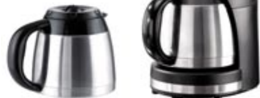
Artikel: K-364 - Coffee Maxx „Thermo Twin“

Für extra langen Kaffeegenuss! Ob auf Familienfeiern, bei Umzügen oder im Büro: Es gibt Situationen, da darf es gern etwas mehr Kaffee sein! Schön, wenn man dann die „Coffee Maxx Thermo Twin“ hat! 2 Isolierkannen mit jeweils 1,4 l Fassungsvermögen halten Ihren Kaffee oder andere Heißgetränke lange warm. Toll auch, um beispielsweise normalen und entkoffeinierten Kaffee gleichzeitig anbieten zu können. Das edle Design macht sowohl die Kaffeemaschine selbst als auch die Isolierkannen durchaus vorzeigbar – auf der Kaffeetafel wie im Konferenzraum. Selbstverständlich bietet Ihnen die moderne Kaffeemaschine auch komfortable Funktionen wie eine Abschaltautomatik und einen Tropfstopp.