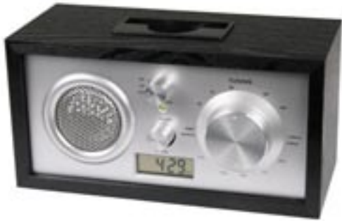
Artikel: BE-70 - Uhrenradio mit Anschluss für MP3/MP4-Player

Echt Retro! Optisch orientiert am Look der 60er aber technisch absolut 21. Jahrhundert. Hochmodernes Uhrenradio in edlem Holzdesign mit AM/FM-Tuner, integriertem Anschluss für alle gängigen MP3- und MP4-Player sowie Weckfunktion.