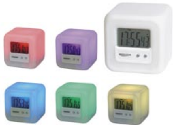
Artikel: T-90 - Radio mit Stimmungslicht

Maße: Touch-Screen-Rechner: ca. 11,0 x 7,0 x 2,0 cm Basisstation: ca. 13,0 x 19,5 x 5,5 cm