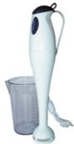
Artikel: K-99 - Stabmixer

Maße ca. 38,6 x 18,5 x 23,0 cm Gewicht: ca. 4,5 kg