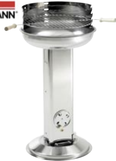
Artikel: K-177 - Landmann Säulengrill

Attraktiver Säulengrill in kompletter Edelstahlausführung. Mit verchromtem Grillrost und Kohlerost. Mit Hilfe des Lüftungsreglers in der Säule kann durch die zusätzliche Sauerstoffzufuhr ein schnelleres Durchglühen des Brennstoffes erreicht werden. Der Ascheauffangbehälter im unteren Säulenbereich ermöglicht nach dem Grillen eine bequeme Reinigung.