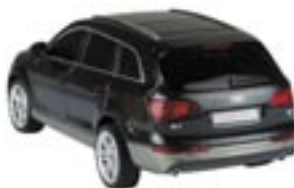
Artikel: SP-223 - RC Audi Q7, Maßstab 1:24

Ferngesteuerter Audi Q7 im Maßstab 1:24. Verpackt im Geschenkkarton mit Sichtfenster. Batterie: 5x AA (im Lieferumfang enthalten)