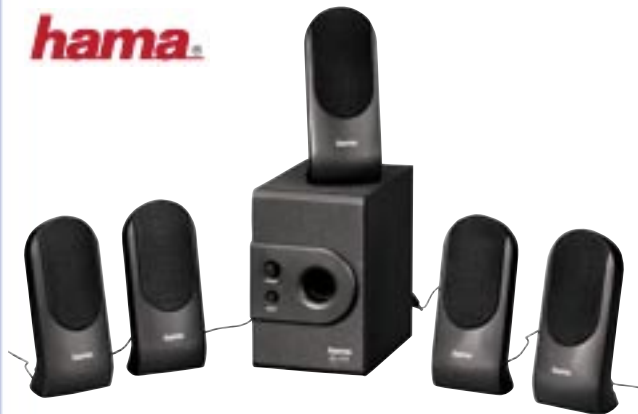
Artikel: BE-81 - Hama 5.1 Subwoofer-System