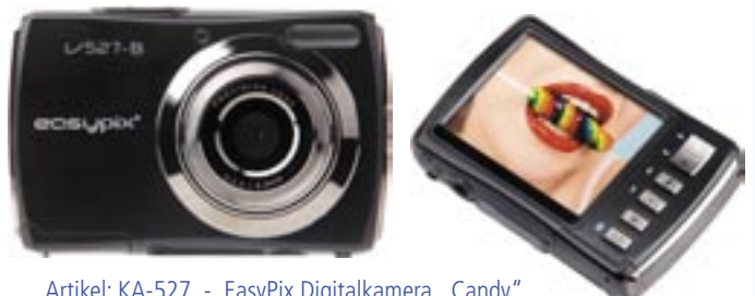
Artikel: KA-527 - EasyPix Digitalkamera „Candy“ Farben: schwarz, rot und pink

Digitalkamera mit 5,0MP (12MP interpoliert), 2,7" TFT LCD Display, Video-Funktion mit Ton, Micro SD Speicherkarten bis zu 8GB, 16MB interner Flash-Speicher. Lieferumfang: Kamera, USB-Kabel, TV-Kabel, Handschlaufe, Tasche, CD-Rom, Gebrauchsanleitung, 2 x AAA Batterien