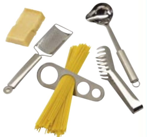
Artikel: K-729 - 4-tlg. Spaghetti-Set

Spaghetti-Set mit Käseibe, Spaghetti-Portinoierer, Nudelzange und Soßenkelle.