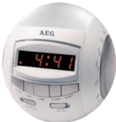
Artikel: BE-56 - AEG Radiowecker