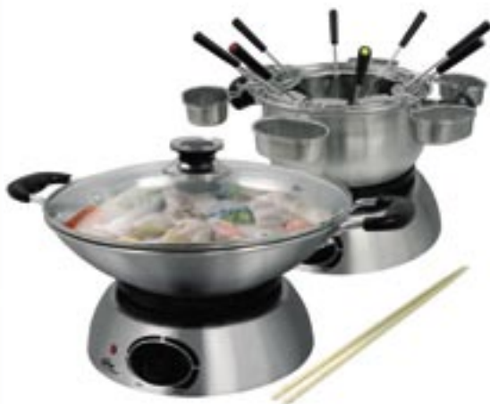
Artikel: K-379 - Elektrisches Wok-/Fondue-Set

Wok- und Fondueset, großer Edelstahlwok mit Glasdeckel, Chrom-Grillgitter und Holz-Spachtel, Fonduepotf mit Fondueeinsetz, 8 Gabeln, Halterung für 6 Soßentöpfchen, 6 Edelstahl-Soßentöpfe, regelbarer Thermostat, edelstahlverkleidete Basisstation, Kontrollleuchte. Leistung: 1300 Watt