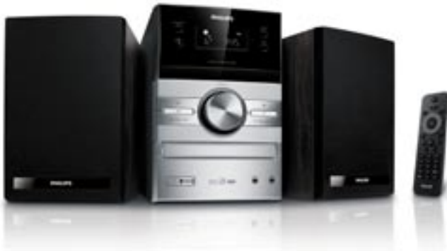
Artikel: BE-228 - Philips HiFi-Microsystem

Hervorragender Sound, klassisches Design, mit Kassetten- und USB Direct-Wiedergabe. Genießen Sie hervorragenden Sound mit dem Philips HiFi-Microsystem MCM207. Geben Sie Ihre liebste MP3/WMA-Musik mittels USB Direct oder MP3 Link wieder. Die Lautsprecher verfügen über ein elegantes Holzdesign für einen klassischen Look, der nie aus der Mode kommt.