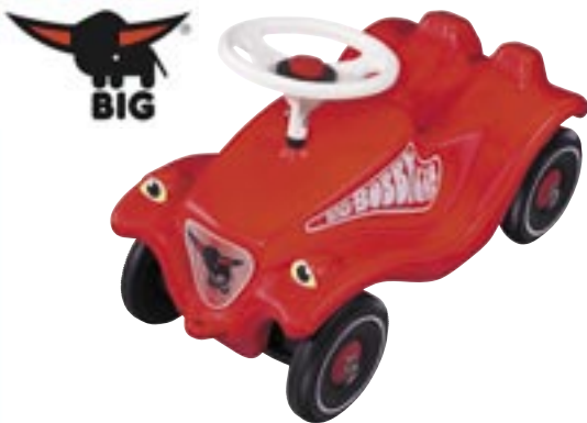
Artikel: SP-229 - Big Bobby-Car „Classic“

Kindgerechtes Rutschfahrzeug aus hochwertigem Kunststoff, ergonomisches Design und tief liegender Schwerpunkt für hohe Fahrsicherheit, mit Kniemulde für größere Kinder.