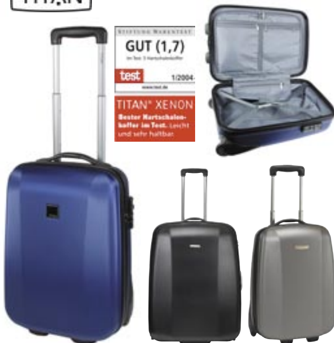
Titan Xenon Trolley

Der besonders leichte TITAN® Xenon ist mit einer extrem schlagfesten und zähelastischen 100% Polykarbonatschale ausgestattet. Weiche und ergonomisch geformte Griffe, ein optimiertes arretierbares Aluminiumausziehsystem mit Druckknopf, integrierte Leichtlaufrollen, eine Bodengriffschale und ein abschließbares integriertes Sicherheitszahlenschloss, sind die äußeren Merkmale des formschönen TITAN® Xenon. Innen wurde der Trolley mit Kreuzgurten, einer Packplatte (um eine beidseitige Packmöglichkeit zugewähren) und einem geschäumten Vollfutter mit seitlicher Reißverschluss tasche ausgestattet.