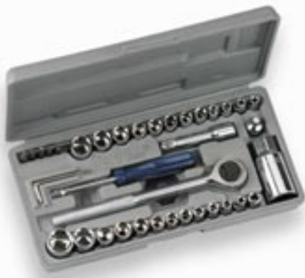
Artikel: ST-40 - 40-tlg. Steckschlüsselsatz

Aus Spezialstahl geschmiedet, verchromt, hochglanzpoliert, 24 Steckschlüsseleinsätze, 1 Zündkerzeneinsatz, 1 Verlängerung, 1 Handantrieb, 1 Knarre, 3 Stiftschlüssel, 1 Schnellschraubrädchen, 1 Reduzierstück, 2 Schlitzklingen, 3 Kreuzklingen, 1 Bithalter, in Kunststoffkassette.