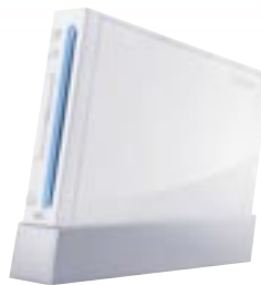
Artikel: SP-460 - Nintendo Wii Konsole mit Sports Resort Bundle Farben: schwarz und weiß

Erleben Sie Spielspaß für die ganze Familie Nintendo Wii mit umfangreichem Zubehör: Wii Fernbedienung, Wii Nunchuck und Wii Motion Plus Controller sowie die beliebten Spiele Wii Sports und Wii Sports Resort. Insgesamt 15 abwechslungsreiche Sportarten stehen Ihnen zur Verfügung. Spielen Sie Frisbee am Strand, fahren Sie Jetski oder trainieren Sie Ihre Fitness bei Tennis oder Golf - und alles bequem bei Ihnen zu Hause.