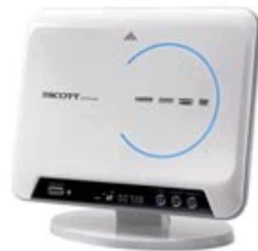
Artikel: BE-227 - SCOTT DVD-Player

DVD video, video cd, svcd, MPEG4/xvid, JPG Betrachter, DVD+R/RW, DVD-R/RW, CD-R/-RW/ MP3-CD/ Audio CD, PAL/NTSC, Senkrecht Laden von DVD/CD, automatischer Auswurf, USB Anschluss, HDMI, Dolby digital, CD ripping, Wandbefestigung