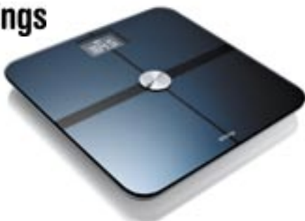
Artikel: K-453 - Withings Internet Personenwaage

Eine technologische Revolution für Ihre Gesundheit in kleinem Format: Bleiben Sie fit mit Ihrer Withings Online-Waage. In ihrem extraflachen Format und dem schwarzen, metallisch glänzenden Design ist diese Personenwaage mit Bio-Impedanz-Analyse ein wahrhaftiges Schmuckstück in Ihrem Badezimmer und besticht durch technologischen Fortschritt und die einfache Handhabung: Dank der integrierten Wifi-Verbindung werden die Angaben zu Ihrem Gewicht und Ihrer Bio-Impedanz automatisch gespeichert. Kombiniert mit einer kostenlosen iPhone-Anwendung, die über den App Store verfügbar ist, zeigt die Withings Online-Waage die Verlaufskurven über Ihr Gewicht, den Körperfettanteil sowie und die fettfreie Körpermasse vollständig angezeigt: Sie haben also stets einen Fitnesscoach in der Tasche, den Sie konsultieren können, wann und wo immer Sie es wünschen. Diese neuartige Personenwaage integriert die innovativsten Technologien und garantiert somit Präzision und Komfort durch das automatische Einschalten dank der kontinuierlichen elektronischen Abgleichung, medizinische Multifrequenz-Impedanz-Analyse, transparente ITO-Elektroden, automatische Wiedererkennung der Benutzer.