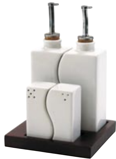
Artikel: K-753 - Salat Würzset

Salat Würzset auf einem Holztablett, bestehend aus Salz- und Pfefferstreuer, Öl- und Essigwürzer, aus Keramik