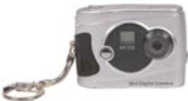
Artikel: KA-56 - Digitalkamera und Webcam mit Schlüsselanhänger

Maße: ca. 9,1 x 6,0 x 2,3 cm Gewicht: ca. 125,0 g