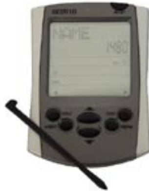
Artikel: T-211 - Datenbank mit Touchscreen

Maße: ca. 11,7 x 8,6 x 1,1 cm Gewicht: ca. 65,0 g