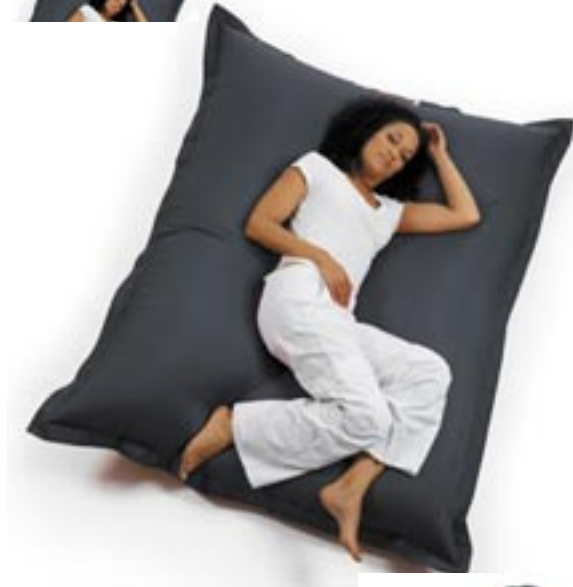
Artikel: M-118 - Sitting Bull Sitzsack Farben: schwarz, orange und rot

Vergessen Sie alles, was Sie bisher über Sitzsäcke gehört haben. Der Sitting Bull setzt einen neuen Standard: