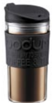
Artikel: K-401 - Bodum Travel Mug 0,35L

Wenn Sie unterwegs ein warmes Getränk wünschen, es aber nicht zubereiten wollen, ist der TRAVEL MUG genau das Richtige für Sie. Der Becher besitzt ist ideal, um Ihre Getränke sicher und mit der gewünschten Temperatur ans Ziel zu bringen. Fassungsvermögen: 0,35L