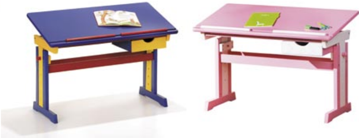
Artikel: M-325 - ABC Schreibtisch

Äußerst stabiler Funktionsschreibtisch in bunten Farben. Der optimale Schreibtisch für die nächsten Schuljahre. Er ist höhenverstellbar und wächst mit Ihrem Kind mit. Zahlreiche Funktionen wie eine schwenk- und höhenverstellbare Arbeitsplatte mit Stoppleisten sowie eine Schubfach in griffnaher Höhe erleichtern das Arbeiten und Spielen. Die Arbeitsplatte ist aus hochwertigen MDF gefertigt, der Unterbau ist aus massivem Kiefernholz. Die Arbeitsplatte ist 6-fach höhenverstellbar (von 62 cm bis 88 cm) zusätzlich lässt sich die Neigung der Tischplatte verstellen.