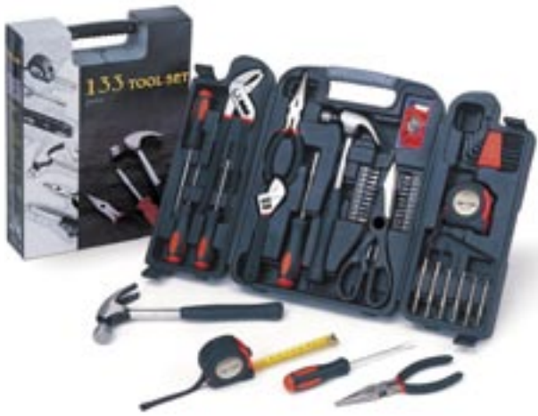
Artikel: ST-93 - 133-tlg. Werkzeugset

Das 133-tlg. Werkzeugset im Koffer beinhaltet: