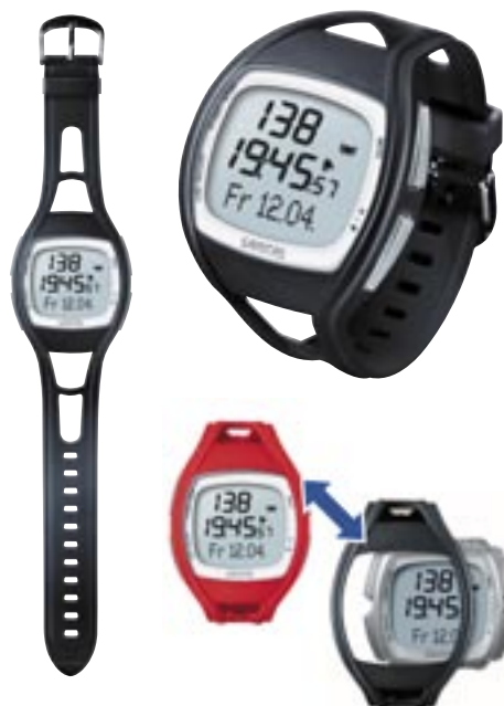
Artikel: T-205 - Sanitas Pulsuhr