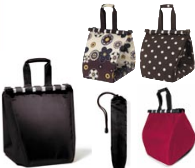
Artikel: P-380 - Reisenthel Easyschoppingbag Farben: schwarz, marigold, mokka dots und rot

Easybag- der clevere Einkaufshelfer, Einfach in den Einkaufswagen einhängen und los geht die Shopping-Tour zum Supermarkt. Nach dem Zahlen einfach Ihre Waren wieder in den EASYBAG und ab ins Auto oder aufs Fahrrad. Kein lästiges Umpacken, kein Stress mehr mit Tüten und Beuteln. Ein Chip ist bereits in dem EASYBAG integriert.