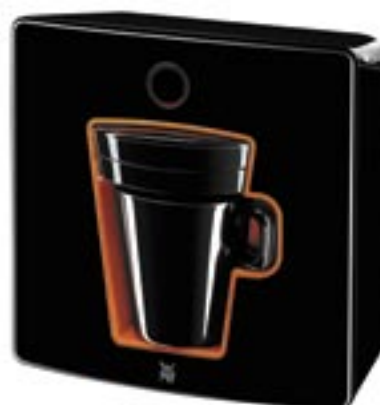
Artikel: WMF-133 - WMF „1“ Kaffeepadmaschine

Die Kaffeepadmaschine WMF 1 für portionierten Filterkaffee im Pad. WMF 1 überrascht mit außergewöhnlichem Design und Formgebung. Die integrierte Tasse macht jede Kaffeepause zu einem besonderen Ereignis. Die Kaffeepadmaschine lässt sich nahezu überall dort verwenden wo man frisch gebrühten Kaffee genießen möchte: im Büro, auf der Terrasse oder sogar im Schlafzimmer. Funktion: In weniger als einer Minute bereitet Ihre WMF 1 eine Tasse duftend frischen Kaffee zu. Der Wassertank fasst so viel, wie Sie für eine Tasse Kaffee brauchen. Sie brühen also immer mit frischem Wasser. Legen Sie in den Padhalter ein handelsübliches Kaffeepad Ihrer Wahl. Einfach Knopf drücken und in weniger als einer Minute ist Ihre Tasse duftend frischer Kaffee fertig. Integrierter Wassertank, Kabelaufwicklung im Boden, Einknopfbedienung, Netzanschluss 220-230 V