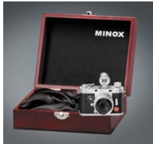
Artikel: KA-550 - Minox DCC Leica M3 5.0 in exklusiver Holzbox

Eine Hommage an die deutsche Ingenieurskunst aus den 50er Jahren. Doch die nostalgische Optik täuscht, denn die Minox DCC 5.1 ist technisch gesehen eine moderne Digitalkamera. 5,1 Megapixel sorgen für scharfe und detailreiche Fotos. Der klassische optische Sucher wird ergänzt durch das 2,0-Zoll-TFT LCD Display. Im Video-Modus lassen sich Filmsequenzen im AVI-Format erstellen. Mit internem 128 MB Speicher. Geeignet für externe SD-Karten bis 16 GB. Inkl. auswechselbarem Lithium-Ionen-Akku.