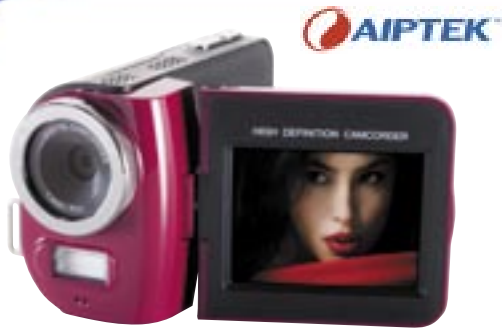
Artikel: KA-684 - Aiptek digitaler Camcorder