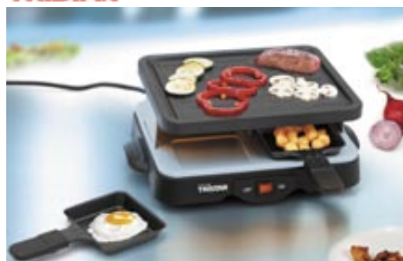
Artikel: K-384 - Tristar Mini-Raclette