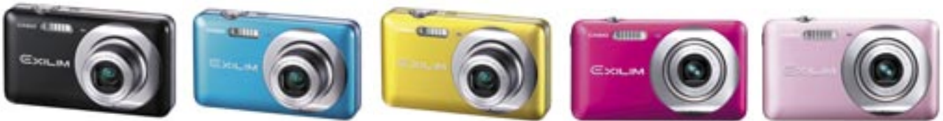
Artikel: KA-780 - Casio Digitalkamera Exilim Zoom EX-Z800 Farben: silber, schwarz, blau, gelb, pink und rosé