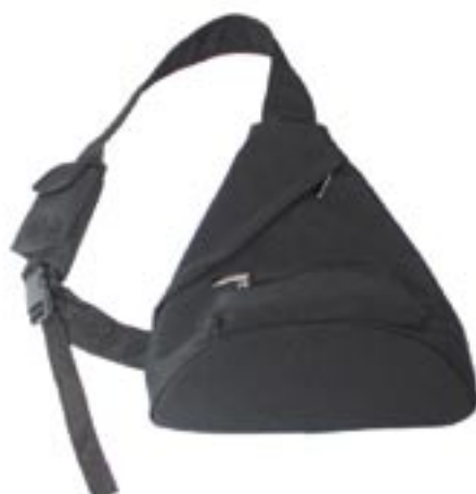
Artikel: P-342 - Body-Bag aus Microfaser

Body-Bag aus Microfaser mit 2 vorderen Reißverschlüssen, 1 rückseitiger Reißverschluß und 1 innerer Reißverschluß, abnehmbare Handytasche, verstellbarer Schultergurt