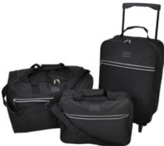
Artikel: PP8/3 - 3-tlg. Reiseset

Maße: Trolley: ca. 52,0 x 36,0 x 18,0 cm Reisetasche: ca. 46,0 x 28,5 x 32,0 cm