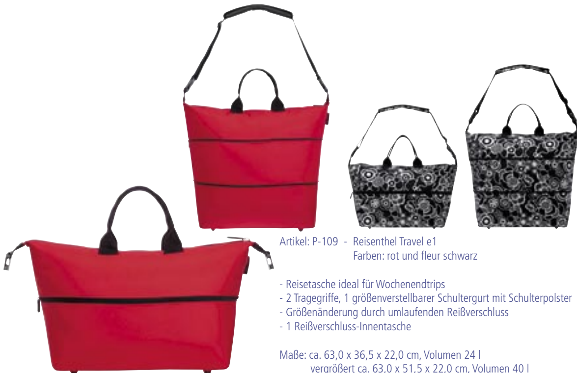
Artikel: P-109 - Reisensthe Travel e1 Farben: rot und fleur schwarz