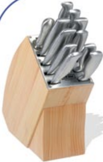
Artikel: K-717 - Starline Messerblock, 12-tlg.