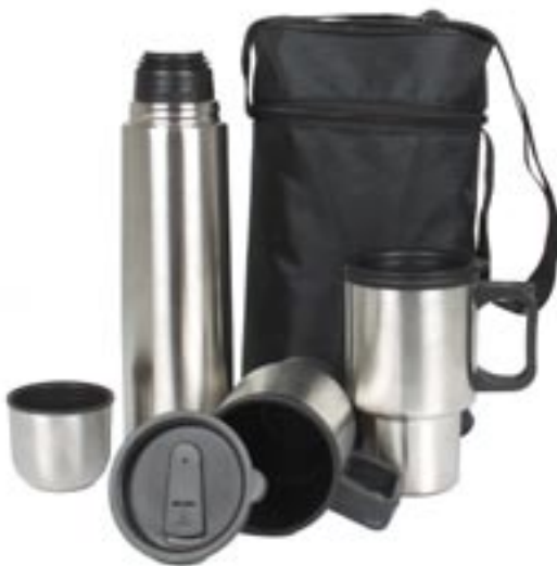
Artikel: K-750 - Edelstahl Thermo-Set, 3-tlg.

Maße: ca. 29,0 x 8,0 x 42,0 cm inkl. Haube