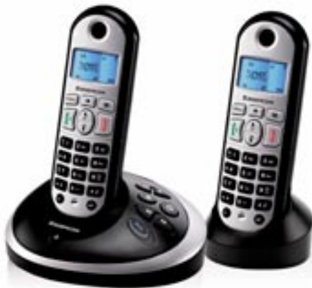
Artikel: X-210/2 - Sagem schnurloses Duo DECT-Telefon mit AB