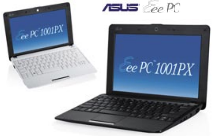
Artikel: C-701 - Asus Eee PC 1001PX Farben: schwarz und weiß