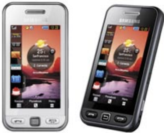
Artikel: X-5230 - Samsung Handy S5230 Farben: silber und schwarz

Handlich, individuell und einzigartig - das ist das Samsung S5230 Star. Das Touchscreen-Handy verzaubert seine Nutzer mit einer Vielfalt an persönlichen Einstellungen und macht somit jedes Samsung S5230 Star einzigartig. Drei individuelle Desktop-Oberflächen bringen Abwechslung und lassen sich den eigenen Wünschen anpassen. Neben der 3-Megapixel-Kamera sorgen der MP3-Player und das UKW-Radio für beste multimediale Unterhaltung. Das besondere Klangerlebnis ist dank DNSe™-Klangoptimierung garantiert.