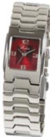
Artikel: D-50 - Lady-Watch „Rubin“

Damen-Armbanduhr mit Edelstahl Armband, rubinrotem Zifferblatt, Water Resistant - 3 ATM, hochwertiges Quarzlaufwerk.