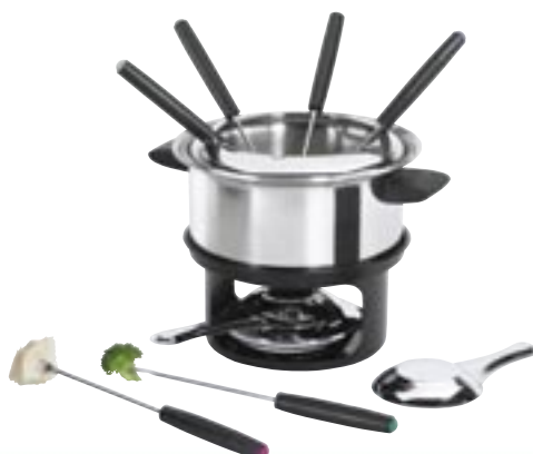
Artikel: K-333 - Fondue-Set

Bestehend aus Topf, Aufsatz, Untergestell, Brenner und 6 Fleischgabeln.