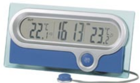
Artikel: T-219 - Wetterstation mit Außensensor

Die Wetterstation mit Außensensor hat ein transparentes LCD Display, Zeitanzeige 12/24 Stunden Anzeige, Innen und Außen-Temperaturanzeige, Frostwarnung, Temperatur-Tendenz-Anzeige, Min. & Max. Temperatur-Funktion, C° und F° Anzeige.