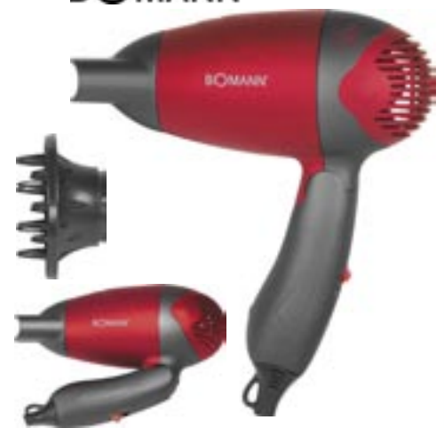
Artikel: K-260 - Bomann Reisehaartrockner