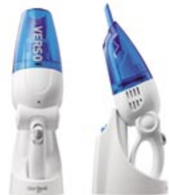
Artikel: K-410 - DirtDevil Nass- und Trocken-Akkusauger „Verso“