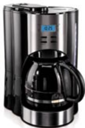
Artikel: K-369 - Coffee Maxx „Classic“