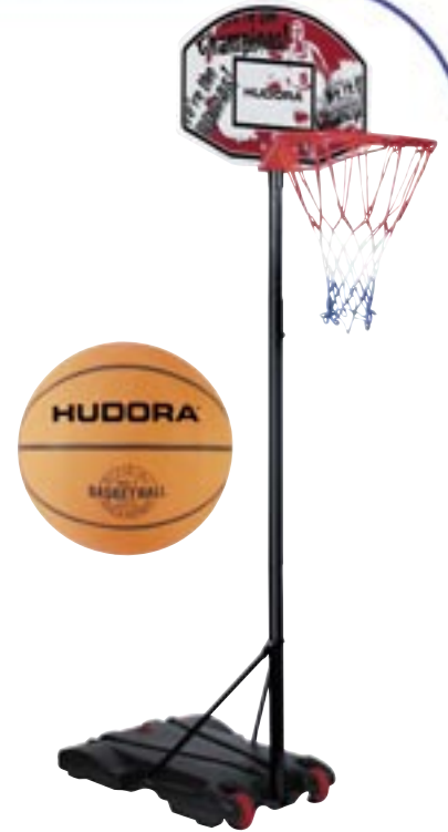
Artikel: SP-271 - Basketballständer „All Stars“ & Basketball

Outdoor Basketballständer für Kinder. Der transportable Ständer für Haus und Garten; beweglich und rollbar durch zwei Räder. Wächst mit, höhenverstellbar von 165 bis 205 cm. Basketballbrett (70x45 cm) aus robustem Kunststoff. Basketballkorb, bestehend aus pulverbeschichtetem Metallring in 15,5 mm Stärke und mit 42,5 cm Ringdurchmesser, mit Netzösen und 53 cm langem Netz. Metallstange in 40 – 50 mm Ø, pulverbeschichtet und mit zwei zusätzlichen Spannstrangen am Standfuß befestigt. Sicherer Standfuß aus stabilem Vinyl. Wird für optimale Standsicherheit einfach mit Wasser oder Sand befüllt (26,5 l).