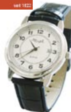
Artikel: H-45 - Kienzle Alpha Enlarged Uhr mit Datumsanzeige

Diese Sportuhr im taucherdesign ist der ideale Begleiter im Wasser und im Alltag. Das ergonomische weiche Armband aus Gummi bietet einen guten Tragekomfort. Diese schicke Sportuhr ist 3 ATM wasserdicht, hat eine drehbare Lunette, fluoreszierende Zeiger, Datumsanzeige und ein hochwertiges Quarzwerk.