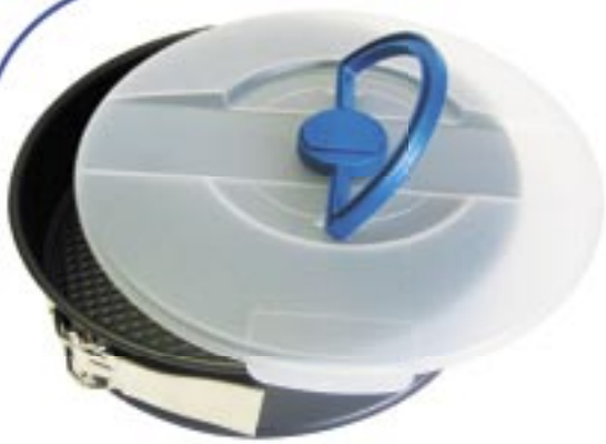
Artikel: K-732 - Springformcontainer

Er ist einfach superpraktisch; backen, frischhalten, transportieren. Bestehend aus einer antihafbeschichteten Teflon-Springform und einer Frischhaltehaube mit abklappbarem Tragegriff sowie einem sicheren Transportverschluss.