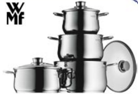
Artikel: WMF-314 - WMF Kochtopf-Set „Diadem Plus“, 4-tlg.

Kochen und servieren im Landhausstil. Die elegante, gebaute Serie für anspruchsvolles Kochen. Jeder Kochtopf ist selbstverständlich aus hochwertigem Cromargan, damit unverwüstlich, pflegeleicht, hygienisch. Die Diadem Plus Kochtopf-Serie darf ohne Deckel unbegrenzt in den Backofen gegeben werden. Mit Deckel bis maximal 180°Grad.