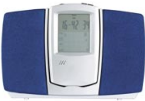
Artikel: BE-61 - Radio mit Lautsprecher-Station und Touch-Screen-Rechner

UKW Radio und Touch-Screen-Rechner mit Uhrzeit- und Datums-Anzeige, 2 Alarmzeiten mit drei verschiedenen Wecktönen, Einstellung der Sommer- und Winterzeit, Währungs-Umrechner, Weltzeitanzeige, Lautstärkeregelung der Basis-Lautsprecher sowie der Ohrhörer. Basisstation mit 2 Stereo-Lautsprechern. Inkl. Ohrhörer.