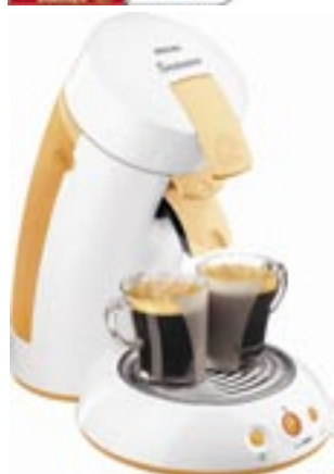
Artikel: K-127W - Philips Senseo Kaffeautomat

Die revolutionäre Art Kaffee zu genießen! Durch den speziellen Sprühkopf wird das Wasser, mit sanftem Druck, schnell und gleichmäßig durch den Kaffee gefiltert, durch die kurze Kontaktzeit zwischen Wasser und Kaffee entsteht keine Überextraktion (wenig Bitterstoffe, rundes Aroma). Der 1.450 W-Boiler erreicht immer genau die richtige Temperatur für perfekten Kaffeegenuss. Dieser Senseo Kaffeautomat schaltet sich automatisch nach 1 Stunde ab und alle abnehmbaren Teile sind spülmaschinenfest (außer Elektronik). Die speziellen Kaffeepads sind im Handel in verschiedenen Geschmacksrichtungen erhältlich.