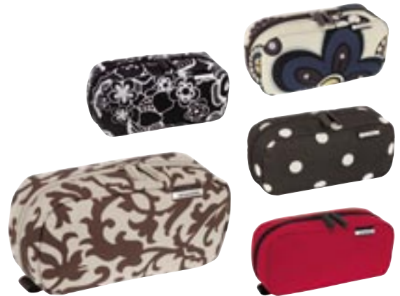
Artikel: P-33 - Reisenhel Multicase Farben: barock sand, fleur schwarz, marigold, mokka dots und rot

Multitalent und Mitnehmsel. Hätte Vielseitigkeit eine Farbe, wäre das Multicase ein Regenbogen: Es macht den Alltag in Schule, Uni oder Büro ein ganzes Stück bunter und bringt als kleines Kosmetik-Necessaire Übersicht und Ordnung in Lippenstift, Wimperntusche, Creme und Rouge. Hauptfach mit Reißverschluss: 1 flaches Reißverschlussfach innen und 2 Steckfächer innen. Zahlreiche Anwendungsmöglichkeiten, vielfach kombinierbar.