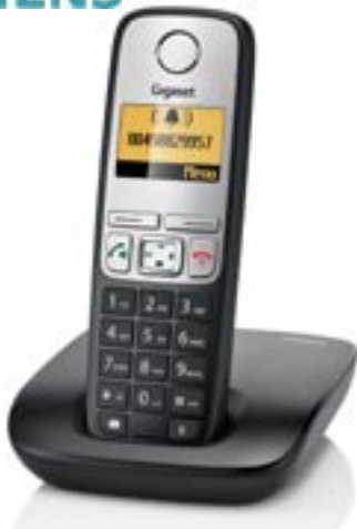
Artikel: X-399 - Siemens Gigaset A400

Das elegante Telefon in schlichter, ergonomischer Ausführung und überzeugenden inneren Werten. In bewährter Gigaset Qualität hergestellt, präsentiert sich das Gigaset A400 schlicht und unkompliziert. Das ergonomische Design sichert eine einfache Bedienung, die durch die hochwertige Tastatur und dem funktionellen 4-Wege Navigationskey in den Vordergrund gestellt wird. Die komfortable Freisprechfunktion des Gigaset A400 bietet noch mehr Freiheit. Bei aktiviertem ECO-Modus Plus ist das Gigaset A400 strahlungsfrei im Standby-Betrieb.