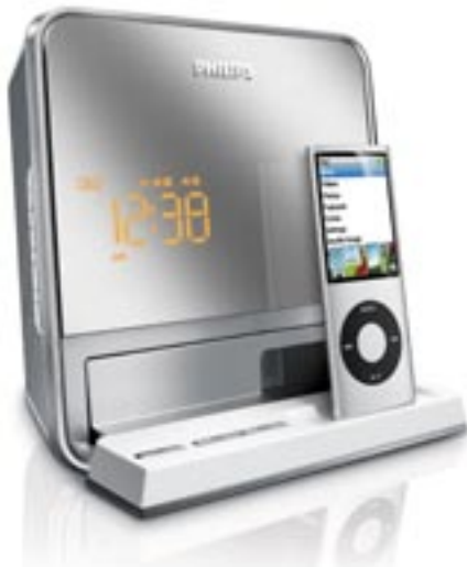
Artikel: BE-75 - Philips Docking-Entertainment-System

Mit dem Docking-Entertainment-System DC190 von Philips können Sie jetzt zu Musik von Ihrem iPod aufwachen. Dieses elegante Gerät mit verspiegeltem Design verfügt nicht nur über zwei Weckzeiten, es ermöglicht Ihnen über den MP3 Link auch einen perfekten Start in den Tag zu Musik von anderen tragbaren Geräten. Genießen Sie Musik aus verschiedenen Quellen