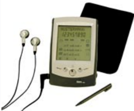
Artikel: T-220 - Datenbank mit Autoscan-Radio

Autoscan Radio (FM), 8-KB Speicher, Touchscreen-Bedienung, Adressbücher für Telefonnummern und E-Mail-Adressen, Terminplaner, 10-stelliger Taschenrechner, Währungsumrechnung, Kalender-, Datums- und Zeitanzeige, Weltzeit- und Sommerzeitfunktion, 2 Alarmzeiten, Passwortfunktion. inkl. Batterien, Schutzhülle, PDA-Stift und Ohrhörer.