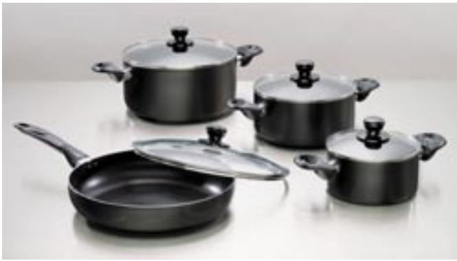
Artikel: K-392 - Brat Maxx Kochtopfset, 8-tlg.