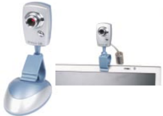
Artikel: C-61 - USB-Webcam

Die Webcam kann auf zwei unterschiedliche Arten genutzt werden: Für den Desktop am festen Arbeitsplatz, indem man den mitgelieferten Fuß benutzt oder für den Notebook/TFT-Monitor, indem man die Kamera bei dem Notebook oder TFT-Monitor einklickt. USB 1.1/2.0 kompatibel, Schnappschuss-Knopf um Aufnahmen zu machen, Auflösung: 352 x 288 Pixel, Auto-elektronische Belichtung: 1/60 bis 1/2000 Sekunde, Bildfrequenz: bis zu 30 fps (35 fps QCIF), justierbare Linse, automatischer optischer Ausgleich für Verstärkung bei Nachtaufnahmen, automatische Belichtung, Stromversorgung über USB-Port.