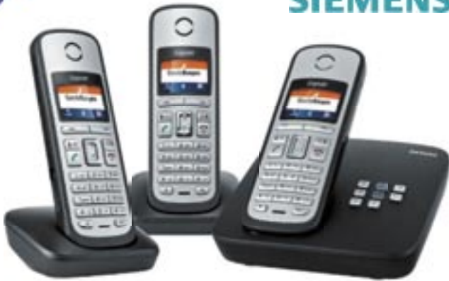
Artikel: X-600/3 - Siemens Gigaset A600A Trio mit AB

Hochwertiges Telefon-Trio für gelungene Kommunikation. Jedes Mobilteil verfügt über ein 1,5-Zoll großes, beleuchtetes Farb-Display. Mit beleuchteter Tastatur, Tastenschutz, Telefonbuch für bis zu 150 Nummern, Wahlwiederholung, Kurzwahltafeln und Anruferanzeige. Plus integriertem Anrufbeantworter mit bis zu 25 Minuten Aufnahmezeit. Die drei Mobilteile ermöglichen es Ihnen, intern kostenlos zu telefonieren und 2 Gespräche gleichzeitig zu führen. Freisprechen in herausragender Akustik mit eigenem Lautsprecher im Mobilteil möglich. Besonders strahlungsarm dank ECO Modus und geringer Energieverbrauch. Die Mobilteile verfügen über eine Reichweite von 50 m in Gebäuden und bis zu 300 m im Freien. Standby-Zeit bis zu 190 Std. Sprechzeit bis zu 20 Std