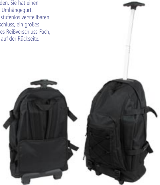
Artikel: PP29/1 - Rucksack-Trolley

Maße: Tasche ca. 35,0 x 29,0 x 13,5 cm Trolley ca. 55,5 x 34,0 x 19,0 cm