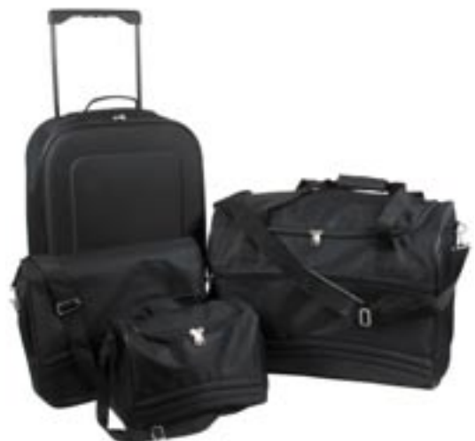
Artikel: PP9/4 - 4-tlg. Reiseset

Maße: Trolley: ca. 51,0 x 32,0 x 17,0 cm Reisetasche: ca. 45,0 x 29,0 x 25,0 cm Notebooktasche: ca. 36,0 x 26,0 x 10,0 cm