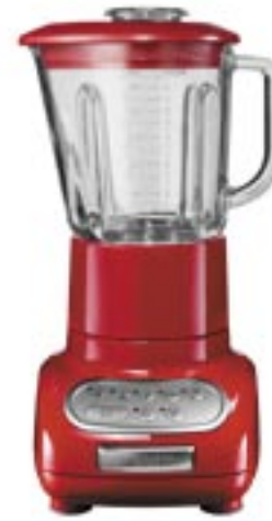
Artikel: K-736R - KitchenAid Standmixer "Artisan"

Metallgehäuse und robuster Glasaufsatz leistungsstarker und einzigartige Messerdesign "Clean Touch" leicht zu reinigendes Bedienfeld mit einfachen Symbolen Bedienerfreundlich und vielseitig Extra Funktion: „ICE Crushing „ Intelligenter elektronischer Sensor mit "Soft Start" Funktion für perfekt gestossenes Eis und cremige Shakes Sicherheitsfunktion: Interlock-System Hindert das Messer am Rotieren bis der Krug richtig eingerastet ist Volumen: 1.500 ml Umdrehungen: 4000-11.500 U/min Kupplung: beschichtetes Metall Wattleistung Direktantrieb: 550 W Spannung (V): 220-240 V Hertz (Hz) 50-60 Hz