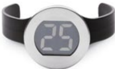
Artikel: K-286 - Digitales Weinthermometer

Digitales Weinthermometer aus Edelstahl. Dieses Thermometer informiert präzise über die Flaschen-Temperatur.