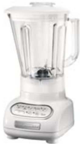
Artikel: K-736 - KitchenAid Standmixer "Classic"

Für köstliche Frucht-Smoothies und leckere Milchshakes! Unkompliziert im Gebrauch und einfach zu reinigen. Leise und zuverlässig. Leistungsstarker Motor für perfekt zerstoßenes Eis und cremige Shakes. »Clean Touch«: leicht zu reinigendes Bedienfeld mit einfachen Symbolen, dadurch sehr bedienerfreundlich. »Soft Start«: sanfter Start ohne Spritzen und elektronische Drehzahlüberwachung Umdrehungen pro Minute 4000-10000 (Stufe 1-5) Kunststoffaufsatz 1,5 l Inhalt