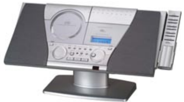
Artikel: BE-133 - Karcher Design Stereo Musik-Center mit CD- Player, PLL- Tuner und MP3

Digitales UKW/MW Radio mit PLL Tuner für UKW / MW-Empfang, programmierbarer CD-Player mit MP3-Funktion: Titel-Programmspeicher, 20 Titel, Skip & Search-Funktion (vor und zurück), Repeat1/ Repeat all-, Random-Funktion, CD-R kompatibel. Das Musik-Center verfügt über ein LCD-Display mit Hintergrundbeleuchtung, ein hochwertiges Lautsprecher-System, ein Cassetdeck mit Auto Stop und Soft Eject. Eine Wandmontage ist möglich, Lieferung enthält Befestigungsmaterial. Außerdem verfügt dieses Musik-Center über einen Sleptimer, X-Bass-Funktion, Digitaluhr mit Weckfunktion, eine Fernbedienung. Leistung: 200 Watt (PMPO)