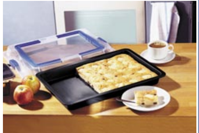
Artikel: K-731 - Blechkuchencontainer

Maße: Durchmesser: ca. 26,0 cm Höhe ohne Deckel: ca. 6,8 cm Höhe mit Deckel: ca. 7,6 cm