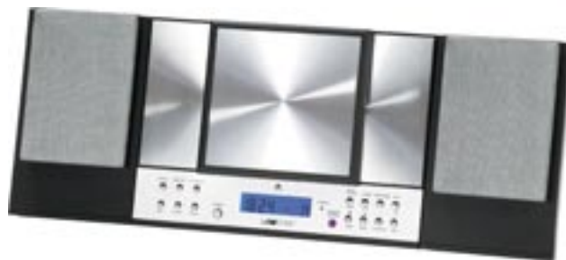
Artikel: BE-301 - Clatronic Design Musik-Center mit CD-/ MP3-Player

- UKW/MW-Tuner mit digitaler Frequenzanzeige