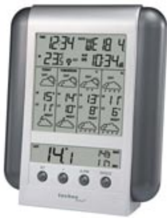
Artikel: T-237 - Meteotronic Wetterstation