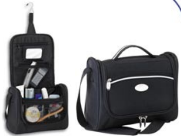
Artikel: P-351 - Kosmetiktasche „Sydney“

Diese Kosmetiktasche aus 600D Polyester/EVA hat einen versenkbaren Tragegriff, einen verstellbaren Schultergurt mit hochwertigem Schulterpolster aus 600D Material, eine Reißverschluss-Vortasche, ein großes Hauptfach mit Reißverschluss. Im geöffneten Zustand ist diese Tasche aufhängbar mit Gelenkhaken. Innen befindet sich ein Reißverschluss-Fach, zwei Netzfächer mit Reißverschluss, drei Strupptaschen, seitlich je ein Steckfach und ein durch Klettverschluss abnehmbarer Spiegel. Die Kosmetiktasche hat eine rückwärtige Schlaufe zum Aufsatteln auf Trolleys.