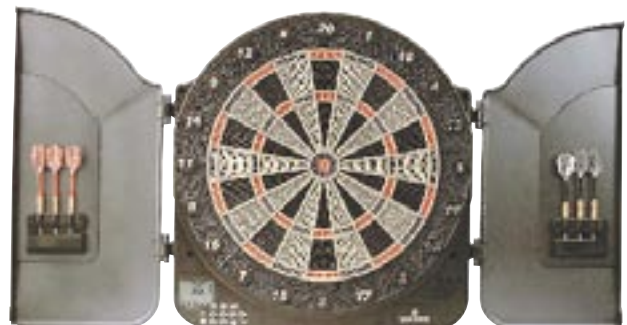
Artikel: SP-171 - Elektronisches Dartboard im Schrank „Raptor“

Elektronisches Dartboard für bis zu 8 Spielern bzw. Teams, 13 Spiele mit über 64 Spielvarianten, Handicap-Wahl für unterschiedliche Spiel-Levels, LCD-Display, Uhr mit Weckfunktion, inkl. 6 Softdarts und Spielanleitung.