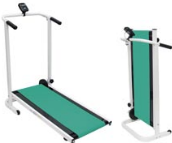
Artikel: F-233 - Fitness-Laufband

Rahmen/Gabel: Big-Tube-City-Einrohr-Rahmen, Unicrown Gabel Rahmen-Höhe: 50 cm Schaltung/Schalthebel: 3-Gang-Bremsnabe mit Drehgriffschalter Zahnkranz: 1-fach Naben: VR Stahl nabe , HR 3-Gang-Bremsnabe Felgen/Bereifung: Alu-Felgen, Bereifung 47-559 Vorbau: Alu-Look Vorbau Lenker: Alu-Look Lenker Tretlager/Achse: Kassetten-BSA-Achse Kettenschutz: Kettenkasten Schutzbleche: Metall-Schutzbleche Sattel: City-Sattel Beleuchtung: Beleuchtung nach StVZO, 10 Lux Halogenscheinwerfer, Trägerrücklicht mit Standlicht Reflektoren: nach StVZO Bremsen: V-Bremse und Rücktrittbremse Speichen: verzinkt Sonstiges: Alu-Seitenständer, City-Korb montiert