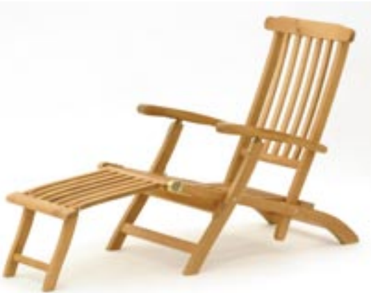
Artikel: M-109 - Deckchair „Notting Hill“

Deckchair aus Gmelina Arborea-Holz, FSC-zertifiziert. Guter Witterungsschutz durch offenporige Lasur. Die Beschlagteile sind aus Edelstahl gefertigt.