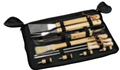
Artikel: K-166/1 - Grillbesteck, 10-tlg.

Maße: ca. 54,0 x 84,0 x 44,0 cm Durchmesser Grillfläche ca. 39,0 cm