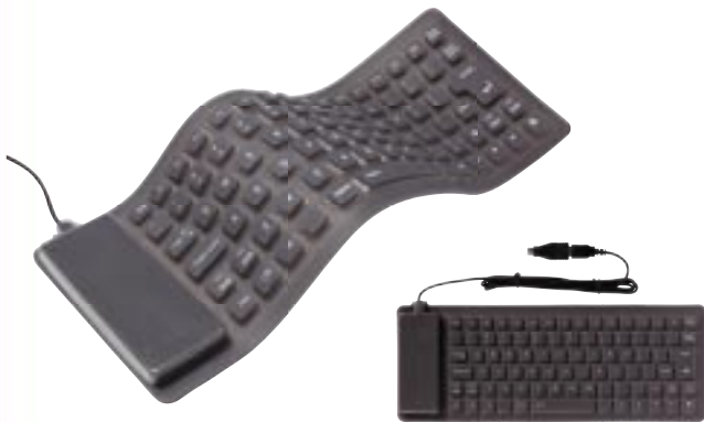
Artikel: C-72 - Flexible Tastatur aus Silikon

Die Webcam kann auf zwei unterschiedliche Arten genutzt werden: Für den Desktop am festen Arbeitsplatz, indem man den mitgelieferten Fuß benutzt oder für den Notebook/TFT-Monitor, indem man die Kamera bei dem Notebook oder TFT-Monitor einklickt. USB 1.1/2.0 kompatibel, Schnappschuss-Knopf um Aufnahmen zu machen, Auflösung: 352 x 288 Pixel, Auto-elektronische Belichtung: 1/60 bis 1/2000 Sekunde, Bildfrequenz: bis zu 30 fps (35 fps QCIF), justierbare Linse, automatischer optischer Ausgleich für Verstärkung bei Nachtaufnahmen, automatische Belichtung, Stromversorgung über USB-Port.