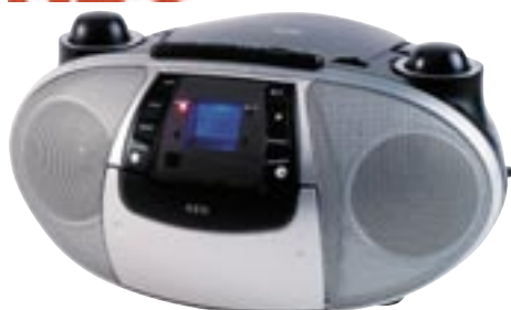
Artikel: BE-127 - AEG Stereo-Radio Recorder mit CD- und MP3-Player