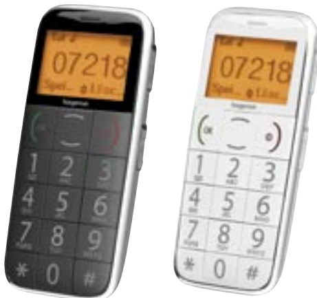
Artikel: X-111 - Hagenuk Handy e100 Farben: schwarz und weiß

GSM Frequenzen: Dualband-Betrieb in allen GSM Netzen (900/1800) Sprechzeit: bis zu 2,5 Stunden Standby Zeit: bis zu 150 Stunden Display: Schwarz-Weiß Display, 39 x 15 mm mit orangefarbener Hintergrundbeleuchtung für optimalen Kontrast Klingeltöne: 6 verschiedene polyphone Klingeltöne, besonders leistungsstarker Lautsprecher und Vibrationsalarm Telefonfunktionen: Wahlwiederholung der letzten 30 Rufnummern, integrierte Freisprecheinrichtung, Stummschaltung, Tastensperre SMS Funktionen: 160 Zeichen maximale Länge pro SMS, Speicher für bis zu 100 SMS Sicherheit: Notruftaste und Notruf SMS Funktion Multimedia: FM Radio - auch in Kombination mit Freisprecheinrichtung Organizer-Funktionen: Telefonbuch mit 500 Einträgen (+ SIM Speicher), Uhr mit Alarmfunktion (auch bei ausgeschaltetem Gerät), Taschenrechner Extras: Integrierte LED Taschenlampe Sprachen: Deutsch, Englisch, Französisch, Spanisch, Italienisch, Niederländisch, Türkisch Gewicht ca. 79 g (inkl. Standard-Akku) Schnittstellen: Headset Anschluss (2.5 mm), Stromversorgung Lieferumfang: hagenuk fono e100 Mobiltelefon, 900 mAh Li-Ion Akku, fono Stereo Headset, 100 - 240 V Reisetzteil