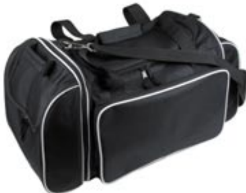
Artikel: P-73 - Sporttasche

Diese praktische Sporttasche hat ein großes Hauptfach mit einem integriertem Schmutzbeutel und einer Innentasche, eine Fronttasche mit Handyfach, ein seitliches Schuhfach und eine abnehmbare Kosmetiktasche mit diversen Staufächern und einer praktischen Anhängemöglichkeit. Der Tragegurt ist gepolstert.