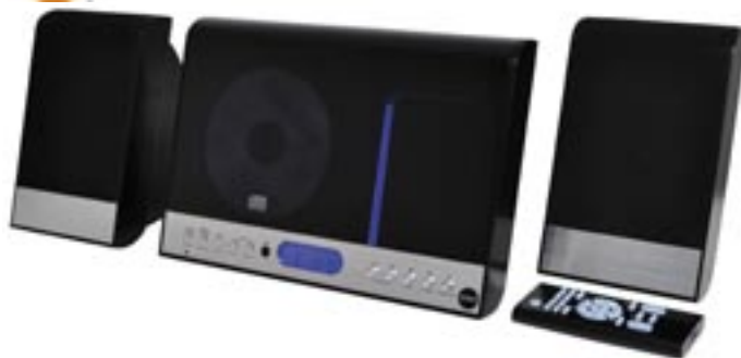
Artikel: BE-230 - CMX Design Vertikal-Musikanlage