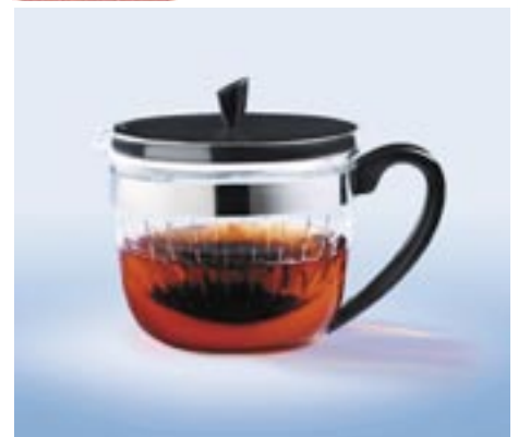
Artikel: K-373 - Rastal Teebereiter „Perfect Tea“

Teekanne aus Glas, mit schwarzem Kunststoffhenkel und schwarzem Kunststoffdeckel. Inhalt: 1 Liter