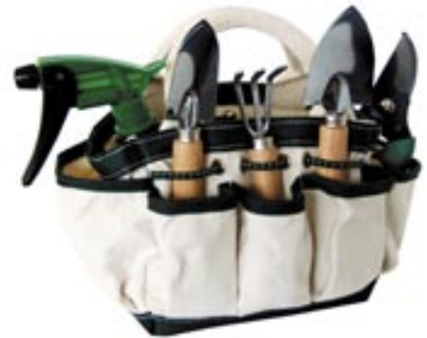
Artikel: ST-16 - Garten-Set mit Tragetasche, 6-tlg.

Maße geschlossen: ca. 24,0 x 13,7 x 4,8 cm