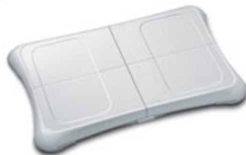
Artikel: SP-206 - Nintendo Wii Fit Plus inkl. Balance Board Sportspiel