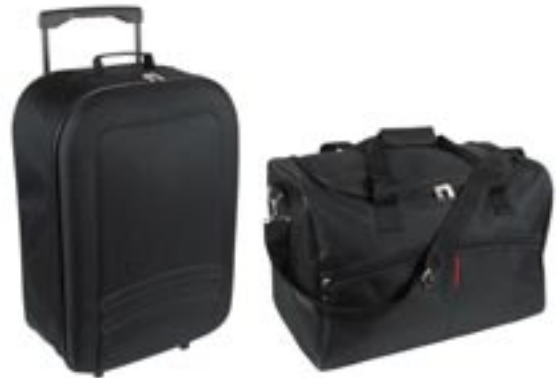
Artikel: PP7/2 - 2-tlg. Reiseset

Maße: Trolley: ca. 52,0 x 36,0 x 18,0 cm Reisetasche: ca. 46,0 x 28,5 x 32,0 cm Rucksack: ca. 34,0 x 15,0 x 41,0 cm