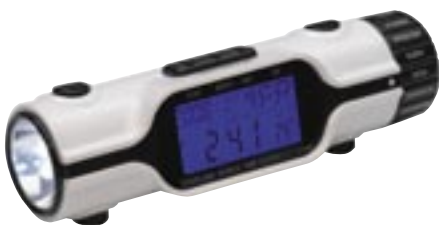
Artikel: L-35W - 3in1 LED Taschenlampe

Weltuhr, 18 Zeitzonen, Kalenderfunktion, Countdownfunktion, Alarmfunktion, LED-Taschenlampe