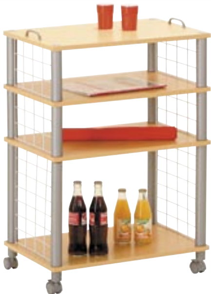
Artikel: M-328 - Küchenwagen „Oliveto“

Klassischer Küchenwagen auf Rollen mit vier buchefarbenen Ebenen für die unterschiedlichsten Küchenutensilien. KF-Board, Buchedekor