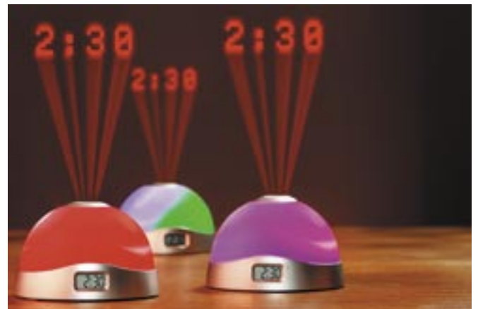
Artikel: BE-67 - Projektionsuhr

Digitale LCD-Uhr mit Wecker- und Schlummerfunktion. Projektion der Uhrzeit senkrecht auf ebenen Flächen (Abstand ca. 2 bis 3 Meter), integriertes Licht mit Farbwechsel. Batteriebetrieben (Batterie nicht im Lieferumfang enthalten)