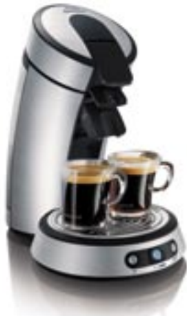
Artikel: K-127A - Philips Senseo Kaffeeautomat, Aluminium

Köstliche Kaffeespezialitäten auf Knopfdruck! Senseo bietet Ihnen köstlichen SENSEO® Kaffee in vielfältigen Geschmacksrichtungen auf Knopfdruck. So können Sie Ihren Kaffee schnell und bequem zubereiten und genießen, wie Sie es möchten! Das elegante Design macht die SENSEO® zu einer perfekten Ergänzung für jede Küche.