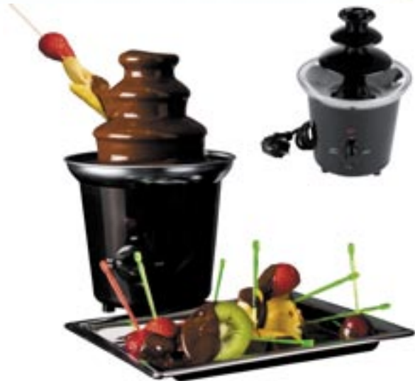
Artikel: K-372 - Schokoladenbrunnen „Como“

Bringen Sie Ihre Kunden zum schmelzen. Mit diesem einfach zu bedienenden Schokoladenbrunnen macht man jeder Naschkatze eine Freude. Einfach den Brunnen einige Zeit vorheizen und dann mit ca. 365g vorgeschmolzener Kuvertüre und ca. 35g Pflanzenöl (sorgt für einen geschmeidigen Fluss der Schokolade) befüllen und schon kann der Spaß losgehen. 220-240 Volt.