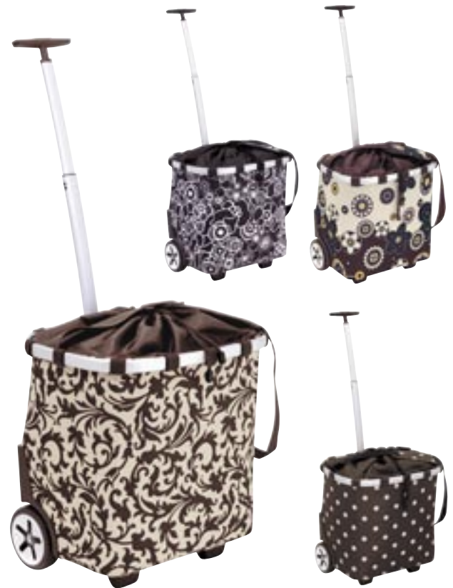
Artikel: PP36/1 - Reisenthel Carrycruiser Farben: barock sand, fleur schwarz, marigold und mokka dots

Der carrycruiser ist ein wahres Allround-Genie: Er hat genug Fassungsvermögen für einen Lebensmittel-Großeinkauf, aber trotzdem ist er gerade nur so hoch, dass man ihn sich auch bequem über die Schulter hängen kann – ideal im Gedränge von S-Bahn und Bus. Dabei kommt dann der Tragegurt zum Einsatz und der Zuggriff verschwindet in seinem Teleskop-Gehäuse. Durch sein pfiffiges Format lässt sich der carrycruiser auch als ständiger Beifahrer im Auto mitnehmen und ist allzeit bereit, um sämtliche Transportaufgaben zu erleichtern.