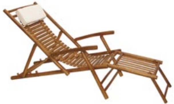
Artikel: M-100 - Relax-Liegestuhl

Relax-Liegestuhl aus braunem wetterfestem Bambus mit Fußteil, höhenverstellbare Lehne, gefütterte Canvas-Kopfauflage.