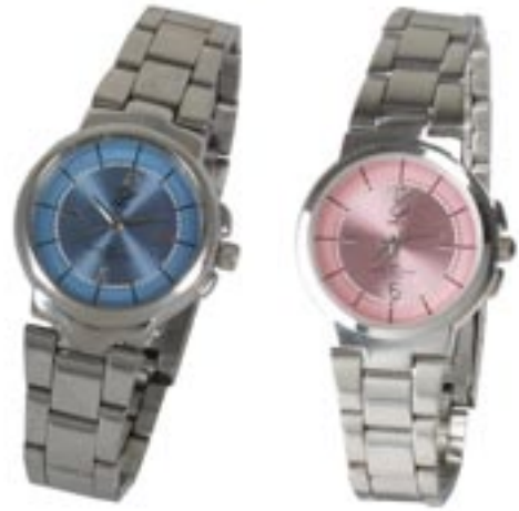
Artikel: D-14 - Bergmann Damenarmbanduhr

Ab einer Menge von 1.000 Stück produzieren wir jede Uhr nach Ihren Gestaltungsvorgaben zu guten Konditionen!