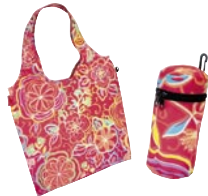
Artikel: P-385 - Reisen thel Mini Maxi Shopper L, flora 2

Maße: ca. 50,0 x 28,0 x 16,5 cm, Volumen 12 l vergrößert: ca. 50,0 x 35,5 x 16,5 cm, Volumen 18 l