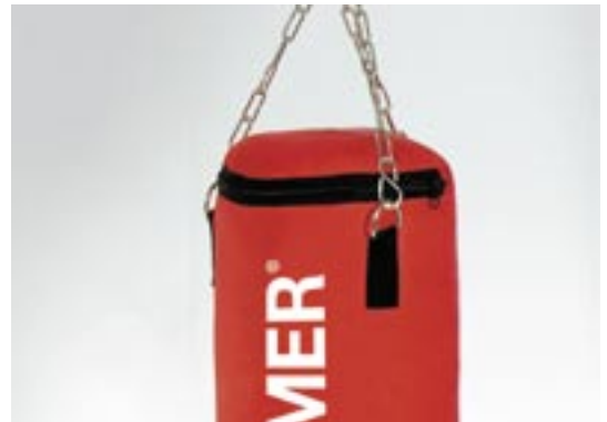
Artikel: F-225 - Trampolin

Maße: aufgebaut ca. 80,0 x 59,0 x 151,0 cm zusammengeklappt ca. 52,0 x 59,0 x 127,0 cm