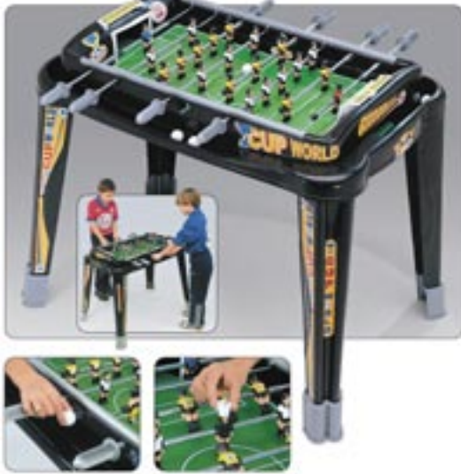
Artikel: SP-118 - Stand- / Tischfußballspiel

Stand- / Tischfußballspiel aus hochwertigem Kunststoff in modernem und attraktivem Design. Große Funktionalität ist unter anderem durch die Höhenverstellbarkeit, die zwei Balleinläufe, zwei Torzähler sowie die auswechselbaren Spielertricolors gegeben. Minutenschnelle Montage.