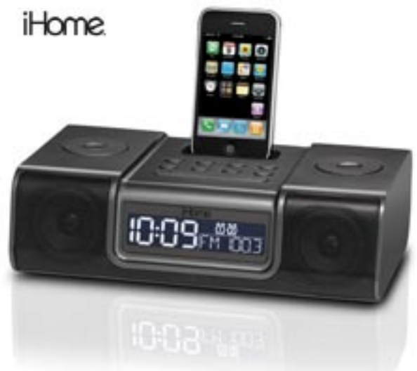
Artikel: BE-239 - iHome IP9 Soundsystem