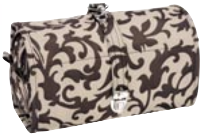
Artikel: P-389 - Reienthel Hangekosmetik L

Farben: barock sand, fleur schwarz, marigold und mokka dots