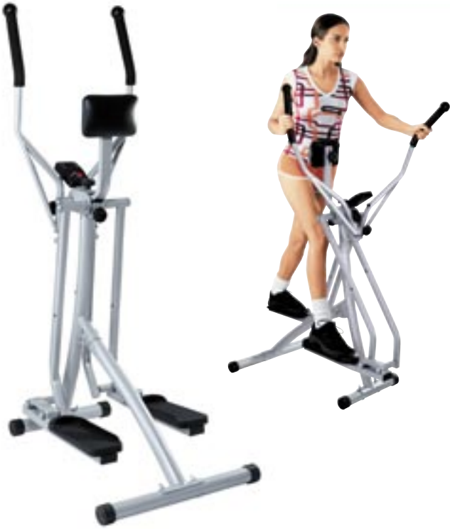
Artikel: F-258 - Nordic Walking Crosstrainer

Joggen war gestern - Nordic Walking ist heute! Dieses Sportgerät bietet Ihnen die Möglichkeit zum gelenkschonenden Ganzkörpertraining. Nordic Walking spricht sowohl Muskeln als auch das Herz-Kreislauf System an und kann bei gleichmäßigem Training im niedrigen Pulsbereich zur Körperstraffung beitragen. Das Bauchkissen kann individuell Ihrer Körpergröße angepaßt werden. Der Trainingscomputer zeigt Ihnen aktuelle Werte an: Trainingszeit, Anzahl der Schritte und durchschnittlichen Kalorienverbrauch. Zusätzlich können Sie auch Hanteln zum Armtraining benutzen (nicht im Lieferumfang enthalten). Das Gerät kann platzsparend zusammengeklappt werden. Max. Belastbarkeit: 120 kg.