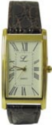
Artikel: D-40 - Damenarmbanduhr

Damenarmbanduhr mit Edelstahl Armband und 30 Meter Wasserdicht.