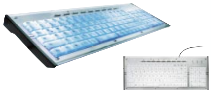
Artikel: C-74 - Beleuchtetes Multimedia-Keyboard "LumiBoard"

Das Multimedia LumiBoard besticht durch sein attraktives Design mit Acryloberfläche, seine Multimedia und Internet-Sondertasten und natürlich die (abschaltbar) blaue Hintergrundbeleuchtung. Endlich kann der Anwender auch im Dunkeln das Keyboard vernünftig benutzen, ohne sich ständig zu vertippen! Das ideale Keyboard für längere Chat- oder Spiel-Sessions! - blaue Hintergrundbeleuchtung, abschaltbar - Acryloberfläche mit dezenten Chromelementen und sichtbarer Verschraubung - 9 Multimedia- und Internet-Tasten - extra flache Tasten für angenehmes Schreiben - inkl. Treiber CD - USB-Anschluss - für Windows 98SE, 2000, ME, XP und Vista