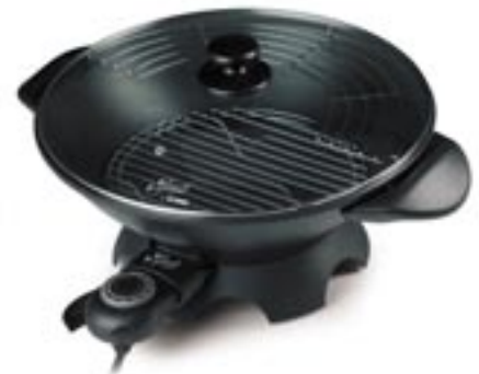
Artikel: K-390 - Domo Elektro-Wok