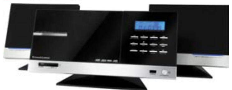
Artikel: BE-399 - Schaub Lorenz Design Vertikal-Musikanlage

Glasähnliche Oberfläche mit Aluminium, Geeignet für die Wandmontage, abnehmbare Standfüße, Breites LCD Display mit blauer Hintergrundbeleuchtung, Programmierbarer Vertikal-MP3-CD-Player, Motorisierte, schnell öffnende CD-Tür mit blauer Beleuchtung, Wiedergabemodus für Audio- und MP3-CD's, Programmierbarer CD/MP3-Player mit 20 Titelspeicher, Unterstützte CD-Typen: Audio-CD, CD-R und MP3-CD, Anzeige von ID3-Tags, USB-Anschluss und SD-Kartenslot zur direkten, Wiedergabe der Musikdateien von MP3-Playern, USB-Sticks und SD-Karten, Uhrzeitanzeige, Timer- und Alarmfunktionen, Tuner: UKW / MW Radio Tuner, PLL-Synthesizer-Tuner, 50 Senderspeicher, 20 MW, 30 UKW Verstärker: 120 Watt Musikspitzenleistung, Anschlüsse: AUX-Eingang, Subwoofer-Ausgang, Lautsprecher-Anschlüsse, Bedienung: Multifunktions-Infrarot-Fernbedienung, Hochwertige, elektronische Bedienelemente mit exaktem Druckpunkt, Lautsprechersystem: Optimal abgestimmte, magnetisch abgeschirmte 2, Wege-Bass-Reflex-Systeme Elegante blaue Beleuchtung an den Lautsprechern, Mitgeliefertes Zubehör: Multifunktions-Infrarot-Fernbedienung, Lautsprechersystem