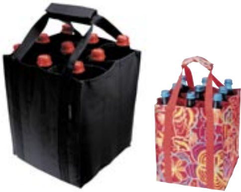
Artikel: P-363 - Reisen thel Bottlebag Farben: schwarz und flora 2

Die Tragetasche bringt Ihre Glasflaschen sicher nach Hause, ohne Bruchgefahr und lästiges Klappern. Platz für 9 Flaschen und andere Getränke. Es erleichtert nicht nur den Getränkeeinkauf, sondern leistet zugleich gute Dienste bei jedem Getränketransport von der Party bis zum Picknick. Aus strapazierfähigem Polyestergerewebe (100% Polyester), verstärkter Tragegriff mit Klettverschluss.