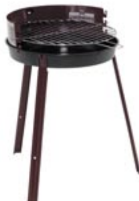
Artikel: K-166 - Landmann Holzkohlegrill

praktisch und klein, mit emaillierter Feuerschüssel und verchromtem Grillrost.