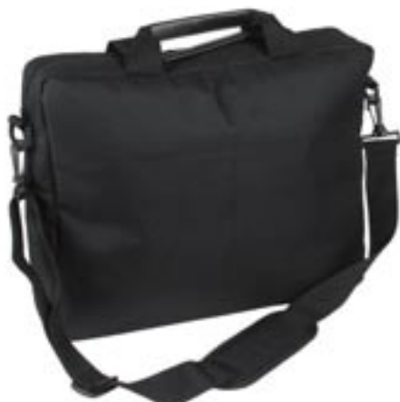
Artikel: AK-84 - Multifunktions Laptop-Tasche

Multifunktions-Schulter-Laptop-Tasche, gepolsterte Ausführung, mit 5 Innenfächer mit verschiedenen Ablagemöglichkeiten, hinten ein weiteres großes Ablagefach und verstellbarer und abnehmbarer Schultergurt mit Polsterung.