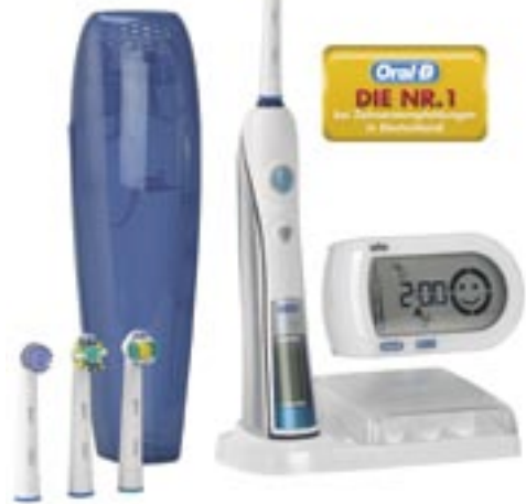
Artikel: K-328 - Braun Oral-B Triumph 5000 mit SmartGuide