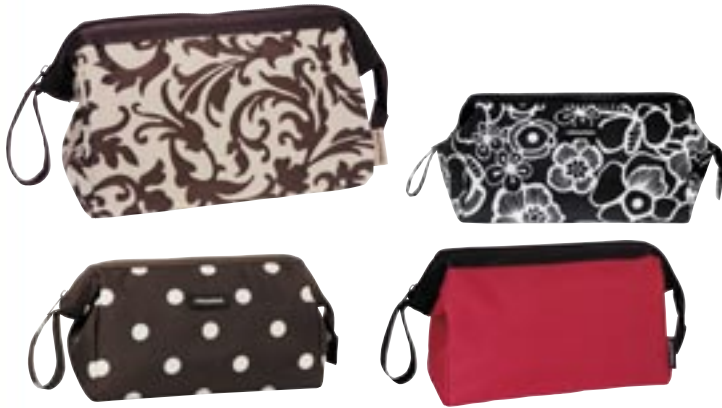
Artikel: P-96 - Reisenhel Travelcosmetic Farben: barock sand, fleur schwarz, mokka dots und rot

Der Klassiker, neu erfunden. In guter Tradition setzt die travelcosmetic auf eine mit soliden Metallbügeln in Form gehaltene, große Öffnung. Dies verspricht beste Ein- und Übersicht sowie eine hohe Stabilität. Trotzdem wächst die travelcosmetic souverän über den Status einer „Kulturtasche“ hinaus: Ihre trendigen Farben, modernen Materialien und das aufwändige Innenleben machen sie fast schon zum Kultobjekt. - 3 Schlaufen an der Innenwand für Flakons, Rasierpinsel oder Deo - zusätzliche Reißverschluss-Innentasche für Kleinkram - klassische Handschlaufe