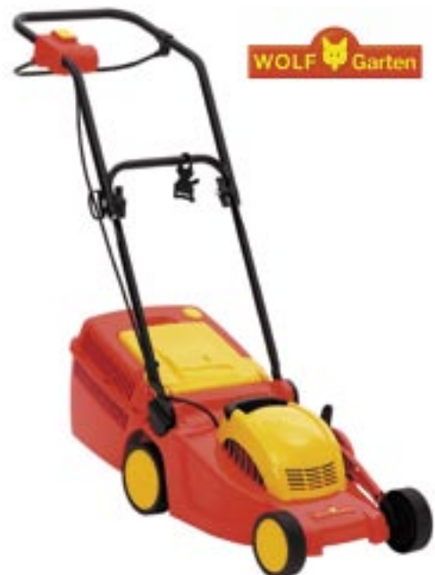
Artikel: ST-14 - WOLF Elektro-Rasenmäher

Die Einstiegsklasse in super Ausstattung. Leicht und Wendig. Minimaler Platzbedarf. WOLF Elektromäher mit einer Schnittbreite von 32 cm, 1.000-Watt-Motorleistung. Fangkorbfüllstandsanzeige und zentrale Schnitthöheneinstellung. Inklusive 25-l-Grasfangkorb.