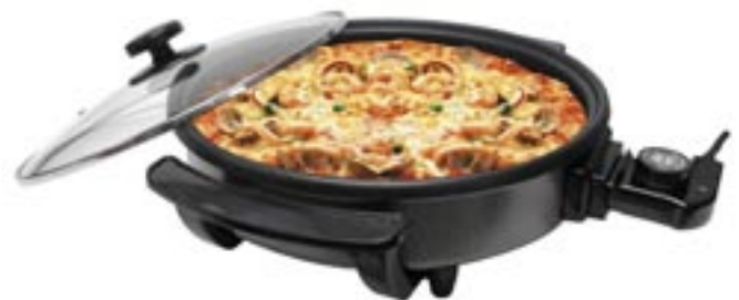
Artikel: K-251 - Elektrische Universal Pfanne