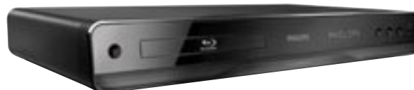
Artikel: BE-331 - Philips Blu-Ray Player

Erleben Sie fünfmal bessere Klarheit und neue aufregende Funktionen. Genießen Sie Bonusfunktionen mit BD-Live, und geben Sie Ihre Lieblingsvideos über USB wieder. Dank HDMI-Upscaling ist die Qualität Ihrer DVDs nahe an HD. Mehr sehen