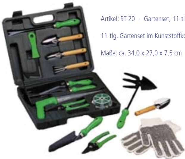
Artikel: ST-20 - Gartenset, 11-tlg.