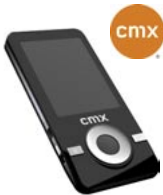
Artikel: C-98 - CMX Stingray MP3-Player, 4GB

Stingray Music-Player im coolen Design, hochwertige Materialien zum langlebigen Gebrauch