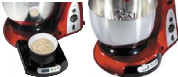
Artikel: K-297 - Bomann Knetmaschine