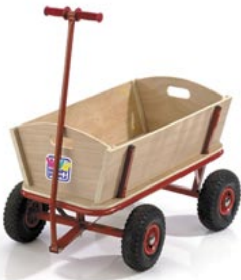
Artikel: SP-228 - Bollerwagen

Für Indoor- und Streetgames. Basketball, orange, Griffige Oberfläche aus Naturgummi, Innenhaut aus 65 % Naturgummi und 35 % dünnen Gummi, Gummiblase mit Butylventil.