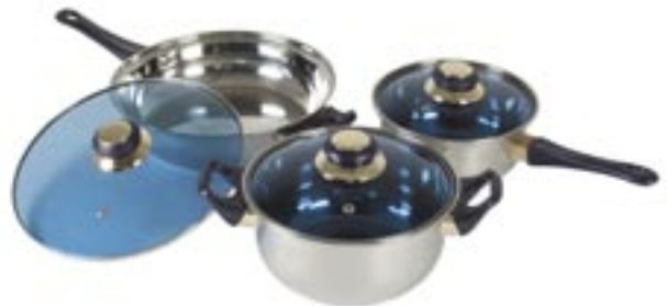
Artikel: K-606 - Kochtopfset, 6-tlg.

Kochen und servieren im Landhausstil. Die elegante, gebaute Serie für anspruchsvolles Kochen. Jeder Kochtopf ist selbstverständlich aus hochwertigem Cromargan, damit unverwüstlich, pflegeleicht, hygienisch. Die Diadem Plus Kochtopf-Serie darf ohne Deckel unbegrenzt in den Backofen gegeben werden. Mit Deckel bis maximal 180°Grad.