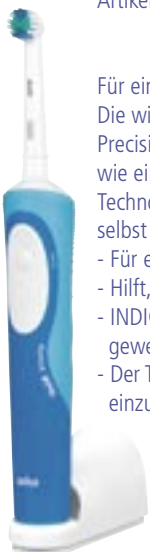
Artikel: K-317 - Braun Oral-B Vitality Precision Clean mit Timer

Für eine tiefe und gründliche Reinigung der Zähne Die wiederaufladbare Elektrozahnbürste Oral-B Vitality Precision Clean entfernt bis zu doppelt so viel Plaque wie eine herkömmliche Zahnbürste. Durch die rotierende Technologie und ihren runden Bürstenkopf gelangt man selbst an schwer erreichbare Stellen.