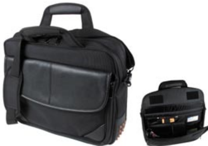
Artikel: AK-95 - Schulter-/Laptoptasche „Comfort“

Hochwertige Multifunktions-Schulter-Laptop-Tasche, gepolsterte Ausführung, 5 große Innenfächer und Vortasche mit verschiedenen Ablagefächern, hinten ein weiteres großes Ablagefach, sowie eine Trolleyhalterung und verstellbarer und abnehmbarer Schultergurt mit Polsterung.