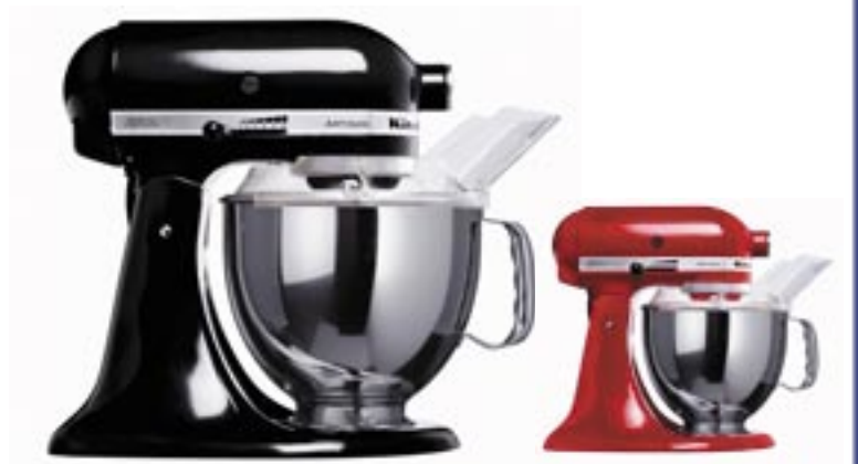
Artikel: K-737 - KitchenAid Küchenmaschine „Artisan“ Farben: schwarz und rot

Ein zeitloser Designklassiker und zugleich ein Highlight für jede Küche. Die KitchenAid Artisan verfügt über zahlreiche Funktionen: Raspeln, Schneiden, Pürieren, Passieren, Kneten und Schlagen sind mit der multifunktionalen Rührmaschine problemlos möglich. Im Lieferumfang enthalten sind: Flachrührer, Schneebesen, Knethaken, eine 4,8 l Schüssel mit ergonomischem Griff und ein Spritzschutz mit Einfüllschütte.