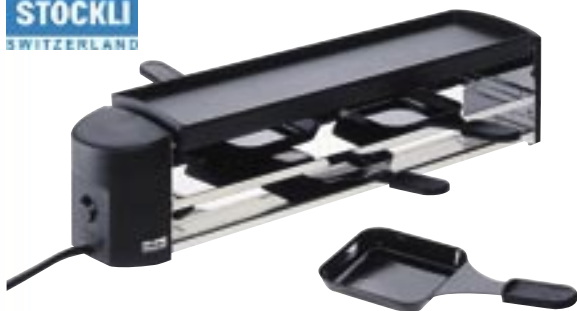
Artikel: K-378 - Stöckli Cheeseboard Grill

Das Raclette- und Grillgerät für vier Personen