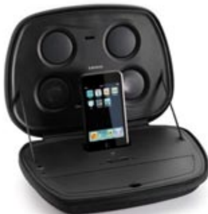
Artikel: BE-327 - Lenco tragbare iPod Docking Station