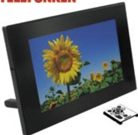
Artikel: BE-323 - Telefunken Digitaler Bilderrahmen, 7"