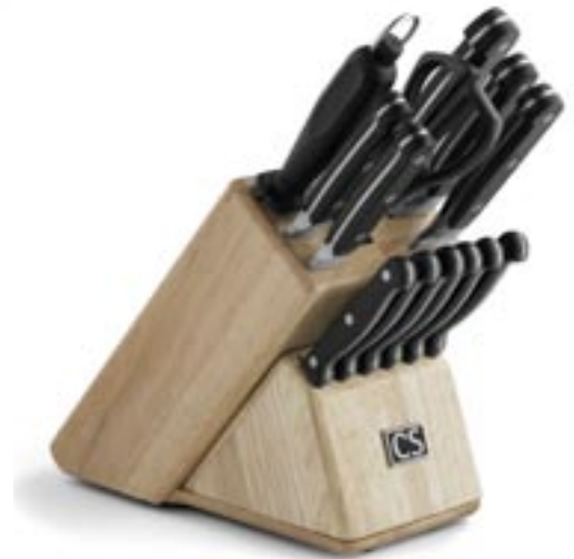
Artikel: K-405 - Premium Messerblock, 15-tlg.

2-in-1 Messerblock aus Holz, mit herausnehmbarem 6-tlg. Steakmessersset. Die Klingen sind aus rostfreiem Stahl gefertigt. Verpackt im Geschenkkarton.