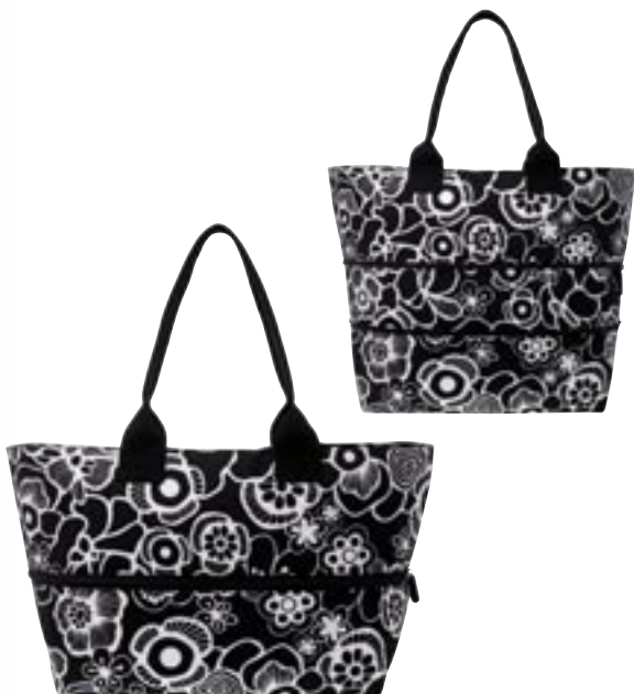
Artikel: P-110 - Reisen thel Shopper e1, fleur schwarz

Maße: ca. 43,5 x 7,0 x 60,0 cm verpackt ca. 12,0 x 6,0 x 2,0 cm