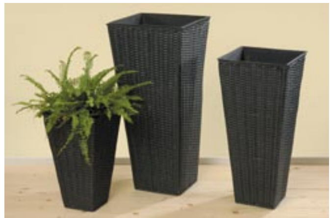
Artikel: G-203 - Pflanztopf "Cecilia", 3er Set

Maße: ca. 19,0 x 19,0 x 27,0 cm ca. 24,0 x 24,0 x 29,0 cm ca. 30,0 x 30,0 x 33,0 cm ca. 34,0 x 34,0 x 40,0 cm