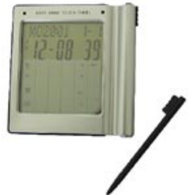
Artikel: T-208 - Datenbank mit Touchscreen

2KB Speicher für bis zu 100 Namen & Telefonnummern, Termin-, Alarm-Funktion, 20 spezielle Zeichen für eMail (40 Zeichen lang), wie z.B. @, /?#, Zeit mit Tag, Monat, Jahr & Wochen, 12/24 Stunden Anzeige, 16 Städte Welt-Zeit mit durchschnittlicher Monatstemperatur, 10-stelliger Rechner, Währungsumrechner mit 11 festen EURO-Werten, Belgien, Frankreich, Deutschland,... +1 frei-programmierbare Einheit, wie z.B. US<>Euro, KM<>Meile, cm<>inch & kg<>lb, Passwortschutz, Auto-Power-Off Funktion