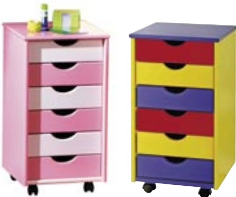
Artikel: M-327 - ABC Rollcontainer

Maße: ca. Breite 109,0 x Tiefe 55,0 x Höhe 62,0 / 88,0 cm Gewicht: ca. 20,2 kg