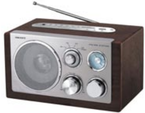
Artikel: BE-35 - SCOTT Retro Radio

Genießen Sie außergewöhnlichen Klang in nostalgischem Design! Hören Sie Ihre MP3 Files entweder über die SD Karte oder Ihren USB Stick. Die Einsatzmöglichkeiten sind unbegrenzt: ob im Badezimmer oder in der Küche, ob im Büro oder im Wohnzimmer, überall verwöhnt Sie das Retro Radio durch seinen Klang und die vielfältigen Möglichkeiten. Ein zusätzlicher Line-In ermöglicht Ihnen den Anschluß Ihres MP3 Players. Natürlich verfügt das Gerät auch über einen FM / AM Tuner mit einer Teleskopantenne. Die Drehknöpfe und der große Frontlautsprecher sorgen für eine elegante Wirkung.