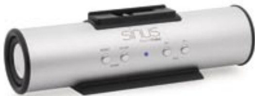
Artikel: BE-73 - Sinus Soundtube

Genießen Sie außergewöhnlichen Klang in nostalgischem Design! Hören Sie Ihre MP3 Files entweder über die SD Karte oder Ihren USB Stick. Die Einsatzmöglichkeiten sind unbegrenzt: ob im Badezimmer oder in der Küche, ob im Büro oder im Wohnzimmer, überall verwöhnt Sie das Retro Radio durch seinen Klang und die vielfältigen Möglichkeiten. Ein zusätzlicher Line-In ermöglicht Ihnen den Anschluß Ihres MP3 Players. Natürlich verfügt das Gerät auch über einen FM / AM Tuner mit einer Teleskopantenne. Die Drehknöpfe und der große Frontlautsprecher sorgen für eine elegante Wirkung.