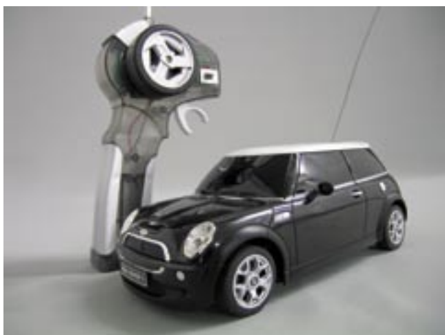
Artikel: SP-214 - RC Mini Cooper S, Maßstab 1:18