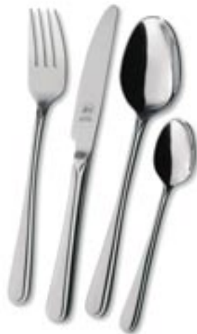
Artikel: K-238 - Besteckset "London", 24-tlg.

7-tlg. Messerset mit Schere im Holzblock