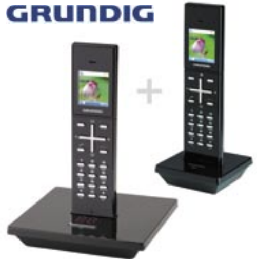
Artikel: X-175 - Grundig Telefon Illion A1 mit AB

Stilvolle Kommunikation mit einfacher Bedienung mit Anrufbeantworter