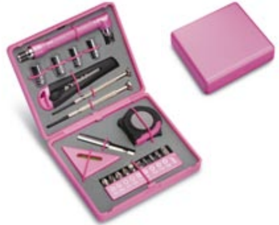
Artikel: ST-62 - 22-tlg. Miniwerkzeugset

Inhalt: 1 Schraubegriff - 1 Rollgabelschlüssel - 1 Stecknuss-Adapter - 4 Steckschlüsseleinsätze 1/4" - 5-6-8-10 mm - 5 Stiftschlüssel H3-H4-H5-H6-H8 - 6 Feinmechaniker-Schraubendreher PH 2,5 - PH 3 - SL 1,2-1,8-2,4-3 mm 10 Bits SL 4-5-6 - PH 1-PH2 - T15-T20 - PZ 1-PZ 2 - 1 Adapter 25 mm, in Kunststoffbox mit Tragegriff