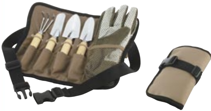
Artikel: ST-36 - 6-tlg. Gartenset „Blossom“

Gartenpflege einfach gemacht. Praktisches Gartenset bestehend aus Pflanzkelle, Harke, Schaufel, Mini-Spaten und Handschuhen.