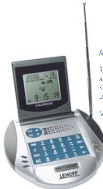
Artikel: BE-48 - Radiowecker mit Weltzeitanzeige

Radiowecker mit Weltzeitanzeige in modernem Design, automatischem Sender-Suchlauf (FM), Taschenrechner, Kopfhöreranschlußbuchse, Stabantenne, klappbares LCD-Display mit Animation, batteriebetrieben