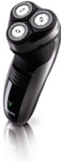
Artikel: K-280 - Philips Rasierer