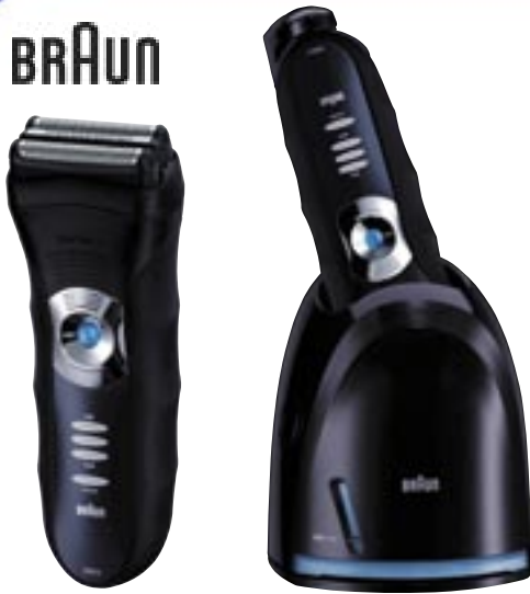
Artikel: K-352 - Braun Rasierer Series 3 - 350CC System

Series 3 Rasierer: Sanfte Rasur. Glatte Haut. Mit den Braun Series 3 Rasierern beginnt jeder Tag mit einer sanften, angenehmen Rasur und der hygienischsten Art der Reinigung. Die Braun Series 3 Rasierer sind mit dem Triple Action Free Float System ausgestattet. Es passt sich den Konturen optimal an und ermöglicht damit eine angenehm sanfte Rasur in weniger Zügen zur Vermeidung von Hautirritationen.