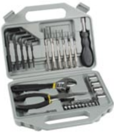
Artikel: ST-91 - 29-tlg. Werkzeugbox

Inhalt: 1 Schraubegriff - 1 Rollgabelschlüssel - 1 Stecknuss-Adapter - 4 Steckschlüsseleinsätze 1/4" - 5-6-8-10 mm - 5 Stiftschlüssel H3-H4-H5-H6-H8 - 6 Feinmechaniker-Schraubendreher PH 2,5 - PH 3 - SL 1,2-1,8-2,4-3 mm 10 Bits SL 4-5-6 - PH 1-PH2 - T15-T20 - PZ 1-PZ 2 - 1 Adapter 25 mm, in Kunststoffbox mit Tragegriff