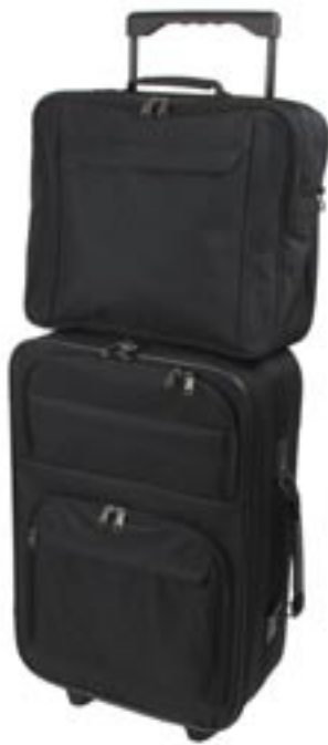
Artikel: PP31/2 - 2-tlg. Reiseset

2-tlg. Reiseset bestehend aus einer Multifunktionstasche und einem Trolley. Multifunktionstasche mit großem Hauptfach, sowie zwei weitere große Fächer und eine Reißverschluss-Vortasche. Die praktische Tasche kann durch eine Lasche auf dem Trolley befestigt werden. Sie hat einen gepolsterten Tragegriff und einen abnehmbaren Umhängegurt. Der Reisetrolley hat einen herausziehbaren und stufenlos verstellbaren Ziehgriff, einen Tragegriff, einen Rundumreißverschluss, ein großes Hauptfach mit Gepäckspanngurt und ein weiteres Reißverschluss-Fach, drei Außentaschen, sowie eine Jackenhalterung auf der Rückseite.