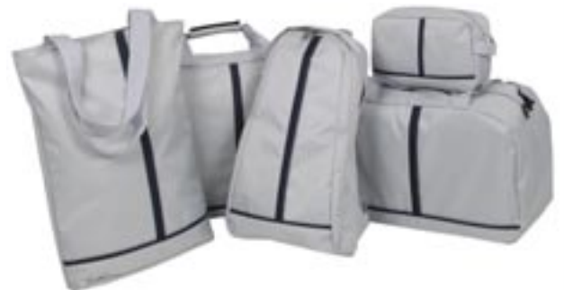
Artikel: PP2/5 - Family Taschenset, 5-tlg.

Dieses attraktive 5-teilige Taschenset löst die Transportfragen der gesamten Familie. Alle Taschen sind optisch aufeinander abgestimmt und aus hochwertigem 600D Nylonmaterial genäht. Der moderne Rucksack mit Zusatzfach, der Reisekoffer/Sporttasche, der Cityshopper mit für den Einkaufstrip, die Kosmetiktasche und der Reiseshopper mit Reißverschluss sind die idealen Begleiter auf jeder Reise.