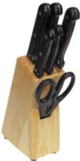
Artikel: K-707 - Messerblock, 7-tlg.

7-tlg. Messerset mit Schere im Holzblock