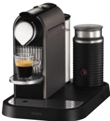
Artikel: K-396 - Krups NESPRESSO CitiZ & Milk