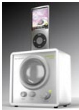
Artikel: BE-74 - Bergmann Popcube Mini Farben: schwarz und weiß

UKW-Radio mit Powerlautsprecher, Sendersuchlauf und Direkt-Dock-In für viele MP3-Player (z.B. iPod Nano 3. & 4. Generation, iPod Shuffle), Holzgehäuse aus MDF lackiert, gebürstete Aluminiumfront, separates Kabel für externe MP3- oder CD-Player, Filzfüße, Anschlussmöglichkeit eines Netzteils für 220V und USB (iPod/MP3/CD-Player & Netzteil nicht im Lieferumfang enthalten) inkl. 4 x UM4/AAA Batterien,