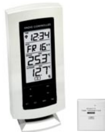
Artikel: T-223 - Wetterstation mit Außensensor und Funkuhr