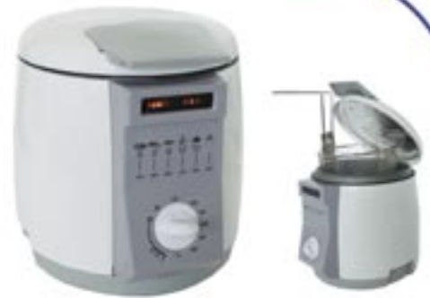
Artikel: K-214 - Mini Friteuse

Die Mini Friteuse mit 900 Watt und 1 Liter Inhalt ist für vielerlei Speisen geeignet. (Pommes Frites, Chicken Wings, Fleisch aller Art, Fisch Broccoli etc.) Der Thermostatregler, das herausnehmbare Fritiersieb und der Filter für Geruchsreduzierung (Inkl. Ersatzfilter) erleichtert die Arbeit mit der Friteuse. Inhalt: 1 Liter