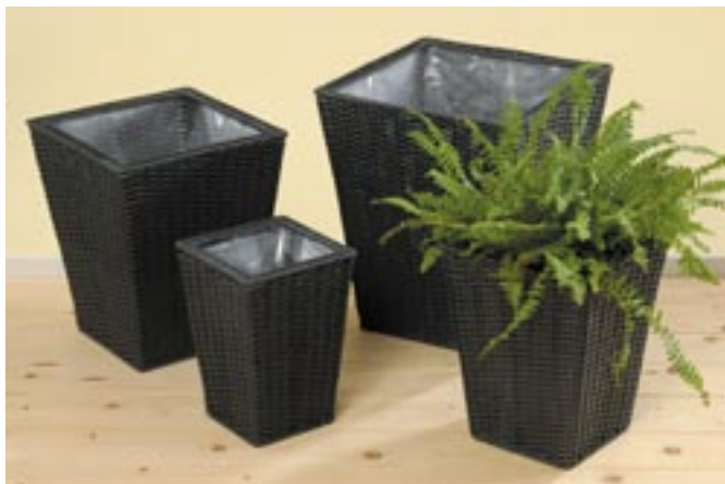
Artikel: G-204 - Pflanztopf "Cecilia", 4er Set

Maße: Höhe ca. 64,5 - 142,5 cm, Länge ca. (Arm) 78,0 cm, Durchmesser Fuß ca. 23,0 cm, Durchmesser Kopf ca. 14,5 cm