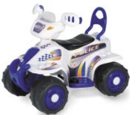
Artikel: SP-219 - Elektro-Quad für Kinder

Das elektrische Kinder-Quad verfügt über einen 6-Volt-Antrieb, der eine Geschwindigkeit von ca. 2 km/h ermöglicht. Die ununterbrochene Fahrdauer mit einer Aufladung beträgt ca. 1 Stunde. Ladedauer ca. 8-10 Stunden. Elektronisches Bremssystem. Für Kinder ab ca. 3 - 7 Jahren. Inkl. Batterie und Ladegerät