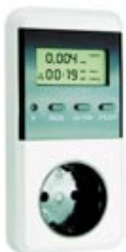
Artikel: BE-72 - Verbrauchsmesser „Plug-In“