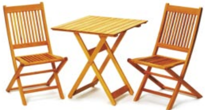
Artikel: M-804 - Balkon-Set „Havanna III“

Maße: Tisch: ca. 60,0 x 69,0 cm Stuhl: ca. 42,0 x 45,0 x 82,0 cm