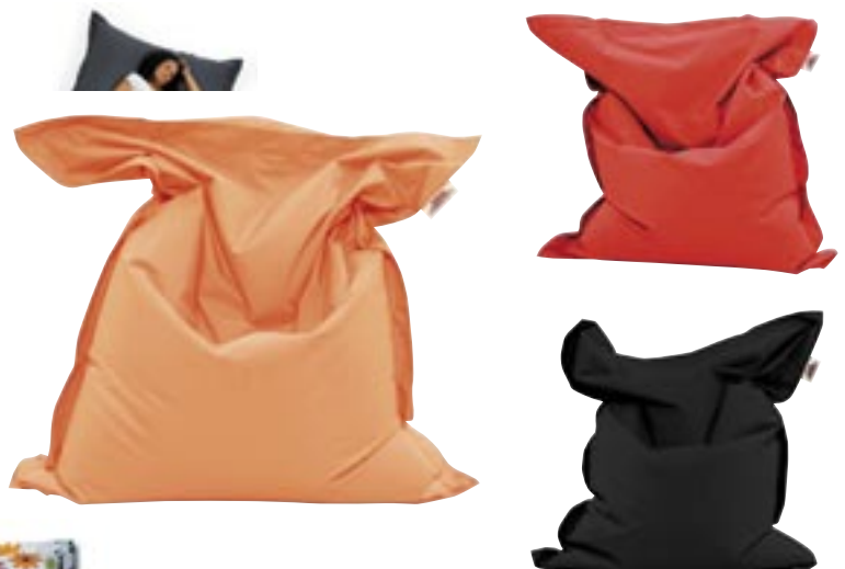
Artikel: M-018 - Sitting Bull - Mini Bull Farben: flowergril, orange, rot und schwarz

Maße: ca. 36,0 x 65,0 x 40,0 cm Gewicht: ca. 16,0 kg