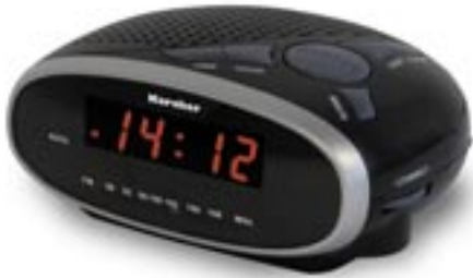
Artikel: BE-45 - Karcher Uhrenradio