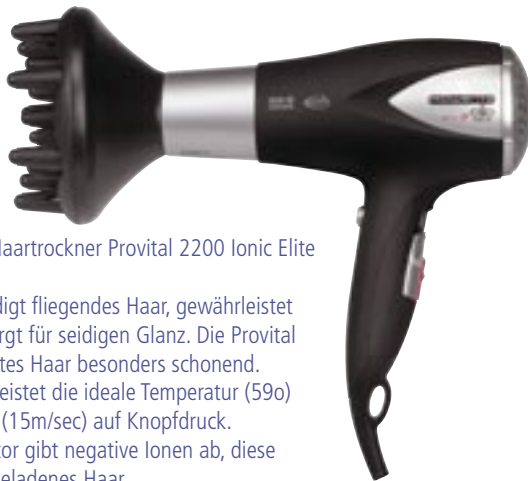
Artikel: K-233 - Rowenta Haartrockner Provital 2200 Ionic Elite

Die Antistatik Funktion bändigt fliegendes Haar, gewährleistet problemloses Styling und sorgt für seidigen Glanz. Die Provital Funktion trocknet strapaziertes Haar besonders schonend.