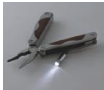
Artikel: ST-63 - Multitool mit LED Licht

Vielseitig einsetzbares Multi-Tool mit ultraheller LED-Leuchte! Im schwarzen Nylonetui mit Gürtelschleife.