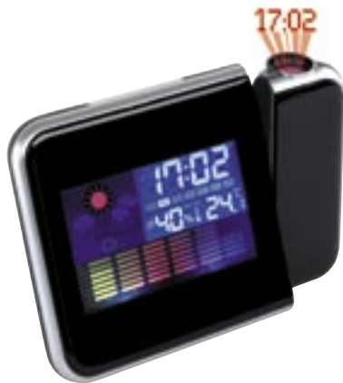
Artikel: T-213 - Projektionsuhr „Color“

Projektionsuhr „Colour“: mit roter LED-Projektion, Wetterprognose, Alarmfunktion, Datums- und Zeitanzeige, Hygro- und Thermometer (für °C und °F), beleuchtete LCD-Anzeige - schwarzes Display mit bunten Elementen, ausklappbarer Aufsteller auf der Rückseite, mit Anschlussmöglichkeit für Adapter (Adapter exkl.)