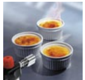
Artikel: K-388 - Tristar Crème-Brulée Brenner Set