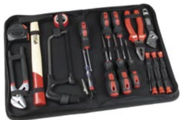
Artikel: ST-87 - 20-tlg. Werkzeugtasche

20 verschiedene Werkzeuge in praktischer College-Mappe mit Reißverschluss. Inhalt: 3 Schlitzschraubendreher 80-125-150 mm CV, 3 Kreuzschlitzschraubendreher Nr. 1-2-3 CV, 3 Feinmechaniker-Schlitzschraubendreher 1,5x50 mm - 2,0x50 mm - 3,5x50 mm, 3 Feinmechaniker-Kreuzschlitzschraubendreher 00x50 - 0x50 - 1 x 50, 1 Bandmaß 3 m, 1 Rolle Klebeband, 1 Kombizange 160 mm, 1 Wasserpumpenzange 240 mm, 1 Haushaltsäge, 1 Rollgabelschlüssel, 1 Hammer 200 g, 1 Stromprüfer 140 mm