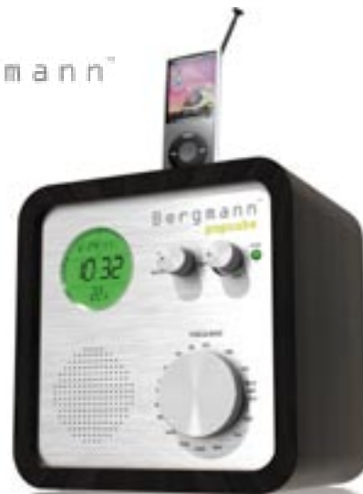
Artikel: BE-212 - Bergmann Popcube

Mit nur einem Handgriff ist der iPod-NANO oder iPod Shuffle mit dem angenehm schnörkellosen POPCUBE zu einer soundstarken Einheit verbunden – quadratisch. Praktisch. Laut. Das ist der ultimative Würfel für die Party am Strand, im Park oder links ab in die Walachei. Also, überall dort, wo gerade keine Steckdose zur Hand ist. Hinter der auffälligen, gebürsteten Aluminiumfront im edlen Echtholzgehäuse verbirgt sich nicht nur modernste Technik mit digitaler Zeitanzeige, integriertem Radioempfänger für UKW und Mittelwelle, Temperaturmesser und Weckvorrichtung, sondern vor allem auch feinstes Design Know-How: BERGMANN ist einer der erfolgreichsten Hersteller von Armbanduhren. Und eben diese angeborene Verliebtheit zum Detail steckt nun auch in der nagelneuen Retro-Musikbox POPCUBE.