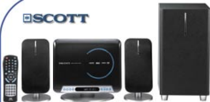
Artikel: BE-266 - SCOTT Audio System mit DVD-Player