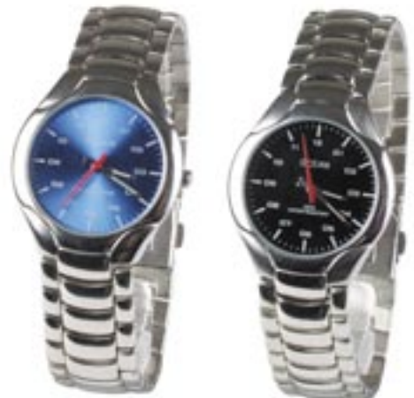
Artikel: H-53B - Ocean-Armbanduhr mit blauem Zifferblatt

Damen-Armbanduhr mit Edelstahl Armband, rubinrotem Zifferblatt, Water Resistant - 3 ATM, hochwertiges Quarzlaufwerk.