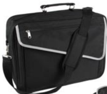
Artikel: AK-70 - Business-Tasche

Business tasche aus strapazierbarem Nylon mit Tragegriff und verstellbaren gepolsterten Schulterriemen, großes gepolstertes Hauptfach, ein weiteres Fach mit Reißverschluss und zwei kleine Fächer, auch als Laptop-Tasche verwendbar.