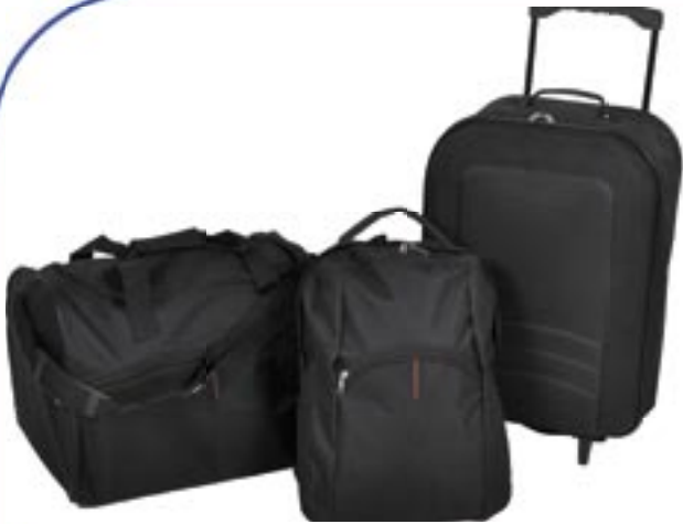
Artikel: PP7/3 - 3-tlg. Reiseset

Dieses hochwertige 3-tlg. Reiseset besteht aus einem Rucksack, einer Reisetasche und einem Trolley. Der Trolley und die Reisetasche sind faltbar und können platzsparend verstaut werden. Inseitig hat der Trolley einen elastischen Gepäckspann-Gurt. Der Rucksack hat größenverstellbare Schultergurte. Das Reiseset besteht aus 600D Nylon. Die Frontseite des Trolleys besteht aus EVA-Hartschaum für eine höhere Stabilität.