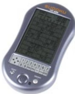
Artikel: SP-73 - Sudoku Taschenspiel mit Touch-Screen

Das zur Zeit beliebteste Zahlenrätsel der Welt ist nun endlich als Pocket-Version erhältlich! Kaum ein anderer Knobelspaß fesselt Rätselfans weltweit momentan mehr als das Zahlenspiel „Sudoku“. Ursprünglich 1970 von einem New Yorker Rätsel-Spezialisten entwickelt, tauchte es später zunächst in Japan auf und wurde Ende 2004 in Europa erneut in diversen Zeitschriften veröffentlicht. Seitdem ist „Sudoku“ das berühmteste Rätsel unserer Zeit. Unser elektronisches Pendant ist nunmehr die logische Weiterentwicklung des gedruckten Sudokus und macht das Spiel mobil. In jeder Lebenslage können Sie das handliche SUDO-Q-MATE benutzen und durch mehr als 2.000.000 Spielvarianten in 8 Stufen Ihr Können beweisen.