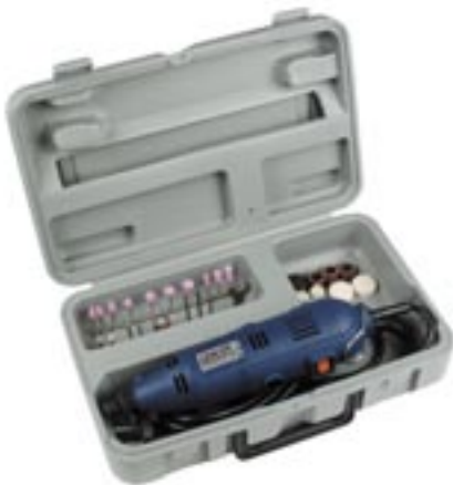
Artikel: ST-73 - Kleinbohrmaschine

Kleinbohrmaschine mit 230 V / 50 Hz / 135 W Leerlaufdrehzahl: 10000 ... 32000 1/min, Kabellänge 2,0 m, Spindelarreterung und Schnellspannbohrfutter.