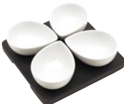
Artikel: K-785 - Dippset "Malta"

bestehend aus 4 tropfenförmigen Porzellanschalen auf einer Holzplatte