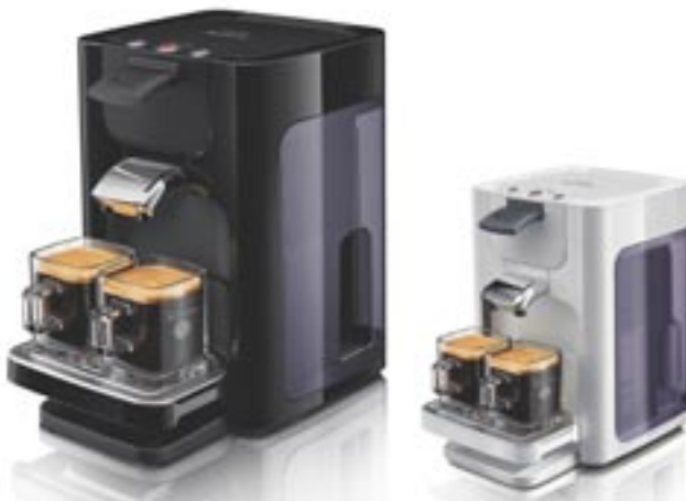
Artikel: K-528 - Philips Senseo Quadrante Farben: schwarz und weiß

SENSEO® Quadrante vereint das benutzerfreundliche Philips SENSEO® System für Kaffeepads mit einem neuen Design. Sensationeller Kaffee: