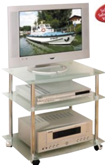
Artikel: M-321 - TV-Wagen „Rettuci“

Maße aufgebaut: ca. 76,5 x 38,0 x 85,0 cm