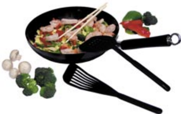
Artikel: K-11 - Wokpfannen-Set, 5-tlg.

22-tlg. Kochtopfset aus 18/10 Edelstahl, innen und außen hochglanzpoliert. Glasdeckel mit Dampfableißdüse, wärmeisolierte Edelstahlgriffe, Thermoböden für sehr gute Wärmeleitung. Zum Set gehören: 1 Milchtopf (14 cm), 2 Stiltöpfe mit Deckel (22 & 24 cm), 3 Kochtöpfe mit Deckel (2x18 & 1x20 cm), 1 Bratpfanne mit Deckel (24 cm), 2 Gareinsätze (2x18 cm), zusätzlich 7-tlg. Edelstahlküchenset.