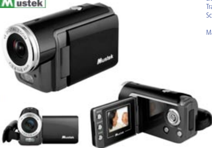
Artikel: KA-321 - Mustek digitaler Camcorder