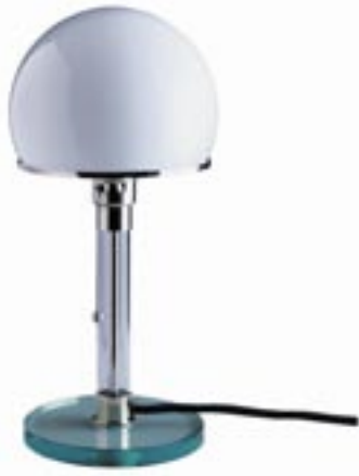
Artikel: L-70 - Wagenfeld Tischleuchte

Vollendete Formsprache, durchdachte Funktion! Dieses Meisterstück im Bauhausstil wurde 1924 von Wilhelm Wagenfeld designt und überzeugt noch heute in der einzigen autorisierten Reedition. Metall vernickelt, Klarglas und Opalglas, mit Einzelnummerierung und Echtheitssiegel. Ohne Leuchtmittel