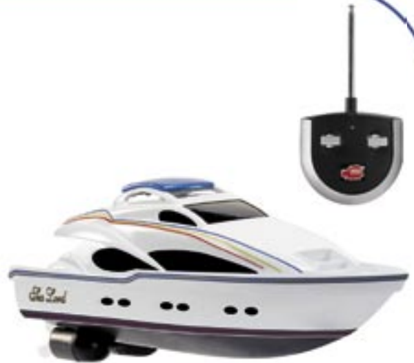
Artikel: SP-49 - Ferngesteuertes Boot „Sea Lord“

„Volle Fahrt voraus! Die ca. 34 cm große RC Sea Lord Yacht im sportlichem Design ist mit einer 2-Kanal Funkfernsteuerung für volle Fahrfunktionen ausgestattet und wird inklusive der erforderlichen Batterien ausgeliefert. Maximale Reichweite je nach Umgebung bis zu 15 Meter, Maximalgeschwindigkeit 1,9 km/h