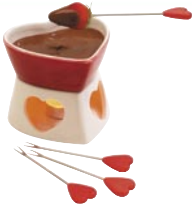
Artikel: K-334 - Herz-Schokoladenfondue-Set „Sweet Heart“

Herz-Schokoladenfondue-Set bestehend aus Stövchen, Keramik-Herzform und 4 Fonduegabeln mit Herzgriff