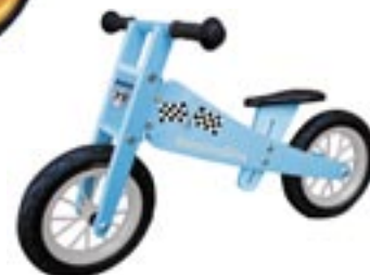
Artikel: F-268 - BambinoBike Laufrad Farben: rosa und blau

Das Holzlaufrad „BambinoBike“, bekannt aus dem aktuellen Kinofilm „ZweiOhrKüken“ mit Til Schweiger, ist ein Laufrad speziell für Kinder ab ca. 2 Jahren entwickelt worden. Es ist ein Laufrad ohne Pedale, zur schnelleren Entwicklung der motorischen Fähigkeiten und des Gleichgewichtssinns. Es erleichtert zudem, das spätere Umsteigen auf ein normales Fahrrad.