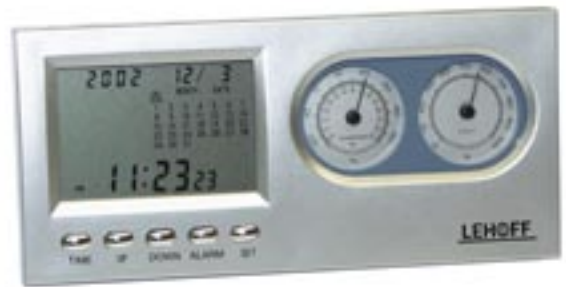
Artikel: T-217 - Wetterstation

Maße: Station ca. 13,5 x 2,8 x 16,6 cm Sender ca. 3,2 x 1,4 x 8,6 cm