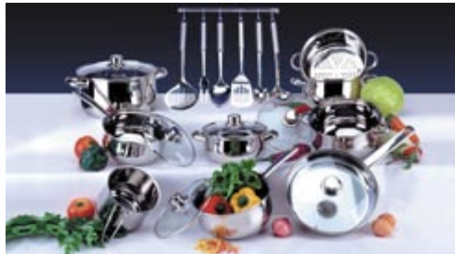
Artikel: K-722 - Kochtopfset, 22-tlg.

Maße: Töpfe ca. 16,0 x 8,0 / 20,0 x 10,0 / 24,0 x 11,0 cm Pfanne Durchmesser ca. 28,0 cm