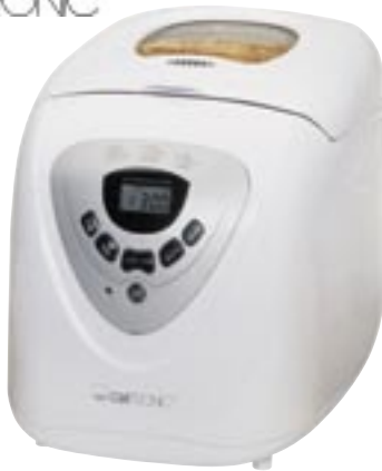
Artikel: K-141 - Clatronic Brotbackautomat mit Cool-Touch Gehäuse

Brotbackautomat mit vollautomatischer Teig- und Brotzubereitung (Kneten, Aufgehen, Backen)