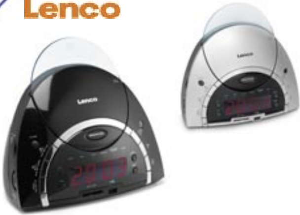
Artikel: BE-235 - Lenco Uhrenradio mit CD Farben: schwarz und silber

Uhrenradio mit CD, UKW analog Tuner CD-Player spielt CD, CD-R, CD-RW, MP3, USB, SD/MMC Card Slot LCD-Display bis zu 20 CD-Tracks programmierbar Snooze, Sleep Timer, drehbarer Lautstärkeregler 3,5 mm Kopfhöreranschluss Ausgangsleistung 2x1,2 W RMS Batterie Backup (Batterie nicht im Lieferumfang)