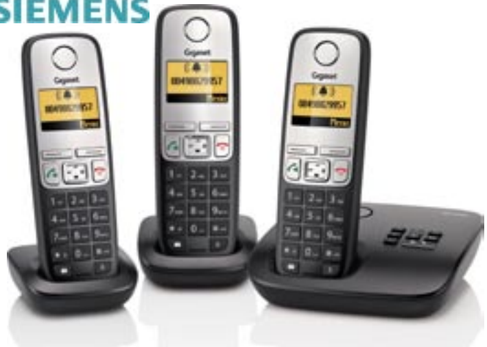
Artikel: X-400 - Siemens Gigaset A400A mit AB