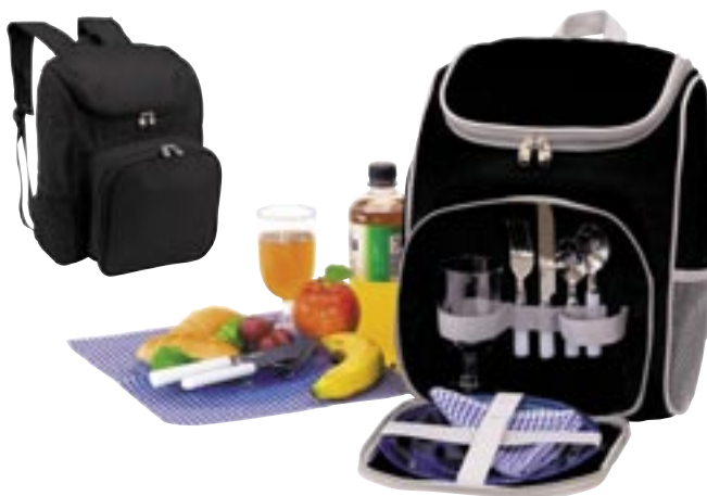
Artikel: P-135 - Picknick-Rucksack „Outside“

Wenn Sie unterwegs ein warmes Getränk wünschen, es aber nicht zubereiten wollen, ist der TRAVEL MUG genau das Richtige für Sie. Der Becher besitzt ist ideal, um Ihre Getränke sicher und mit der gewünschten Temperatur ans Ziel zu bringen. Fassungsvermögen: 0,35L