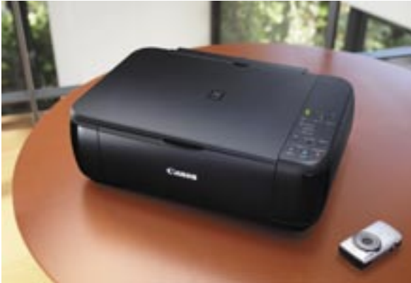
Artikel: C-260 - Canon Pixma MP280 Multifunktions-Drucker

Der PIXMA MP280 ist ein kompaktes, günstiges und schickes Multifunktionssystem. Full HD Movie Print sorgt für tolle Fotoprints von den HD-Movies Ihrer Canon Kamera, Easy-WebPrint EX für den komfortablen Druck von Inhalten aus Internetseiten.