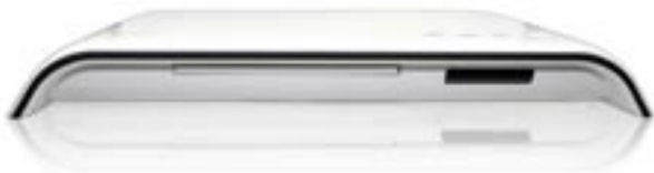
Artikel: BE-312 - DYON DVD-Player „Xeno“

DVD-Player im modernen und stylischem Design mit HDMI Ausgang (1080p), 5.1 Audioausgang, USB Anschluss zum Abspielen von Multimediadateien und Dolby Digital.