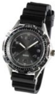
Artikel: H-55 - Sportuhr mit Datumsanzeige

Diese Sportuhr im taucherdesign ist der ideale Begleiter im Wasser und im Alltag. Das ergonomische weiche Armband aus Gummi bietet einen guten Tragekomfort. Diese schicke Sportuhr ist 3 ATM wasserdicht, hat eine drehbare Lunette, fluoreszierende Zeiger, Datumsanzeige und ein hochwertiges Quarzwerk.