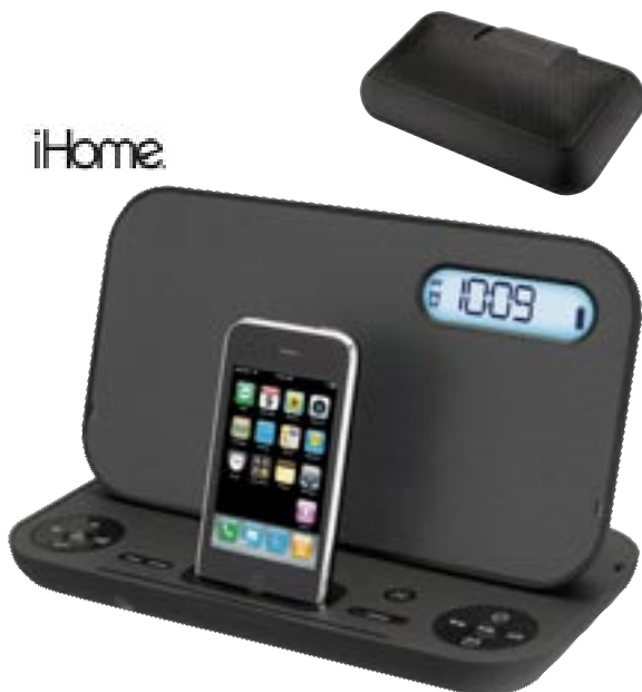
Artikel: BE-326 - iHome iP49 Soundsystem

Ob auf Reisen, im Büro oder in Ihrer Freizeit - genießen Sie Ihre Lieblingsmusik in sensationeller Klangqualität.