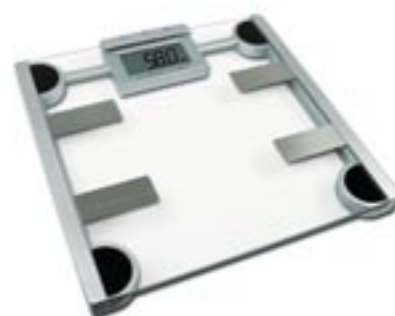
Artikel: K-361 - Medisana Personenwaage