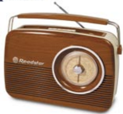
Artikel: BE-208 - Roadstar tragbares Retroradio

Tragbares 3-Wellen-Radio mit Analog-Tuner Netz- und Batteriebetrieb eingebauter Lautsprecher 16 Watt Kopfhörerausgang