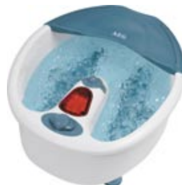
Artikel: K-157 - AEG Fußmassagegerät