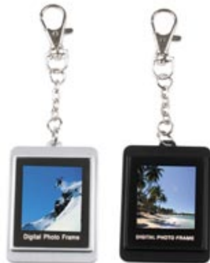
Artikel: BE-310 - 1,5" Digitaler Bilderrahmen als Schlüsselanhänger Farben: silber und schwarz