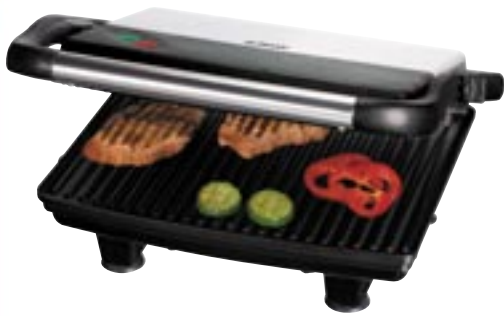
Artikel: K-311 - Bomann Kontaktgrill