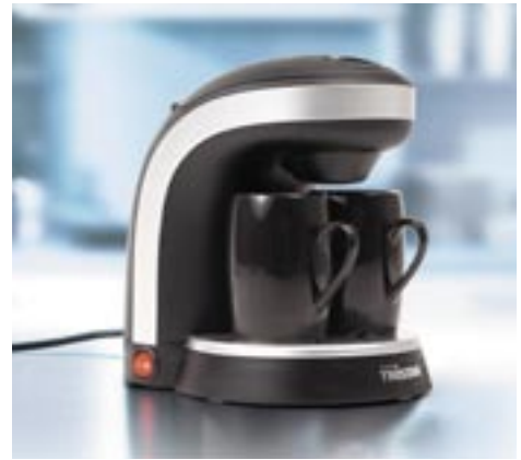
Artikel: K-184 - Tristar Kaffeemaschine für 2 Tassen

Kaffeemaschine für 1 oder 2 Tassen mit auswaschbarem Kaffeefilter, An-/Aus-Leuchte, Anti-Tropfschutz, ergonomisch tragbares Design und Warmhalteplatte. Einfacher und schneller Kaffeegenuss!