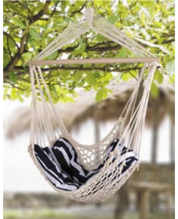
Artikel: M-101 - Hängesessel „Relax“

Hängesessel aus 100% Baumwoll-Netzgewebe. Kissen aus 100% Baumwolle, Füllung aus Polyester. Tragfähigkeit: 100 kg