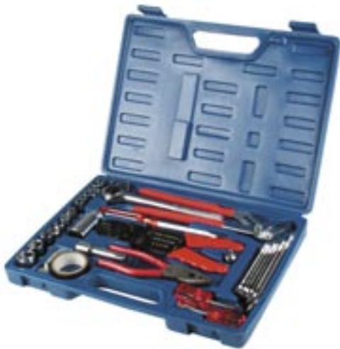
Artikel: ST-69 - 69-tlg. Werkzeugkoffer