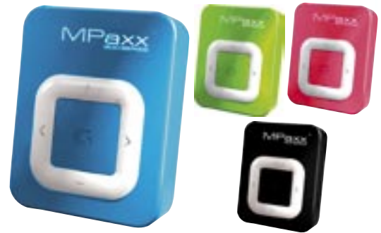
Artikel: C-920 - Grundig MP3-Player, 2GB