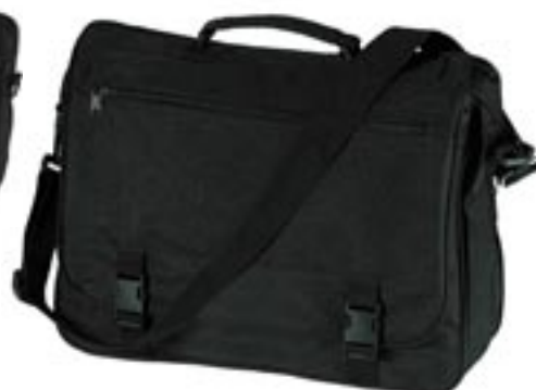
Artikel: AK-91 - Business-Tasche

Business tasche aus strapazierbarem Nylon mit Tragegriff und verstellbaren Schulterriemen, großes Hauptfach und diverse praktische Innentaschen, Handy-, Organizer- und Stifftasche; auch als Laptop-Tasche verwendbar.