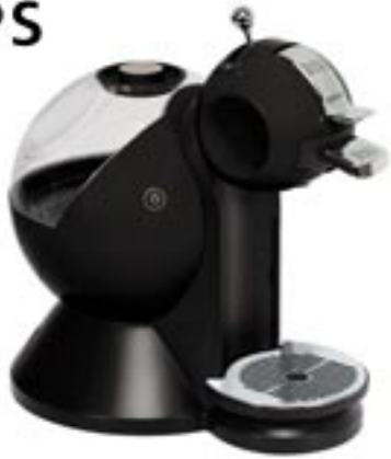
Artikel: K-239 - Krups NESCAFÉ Dolce Gusto