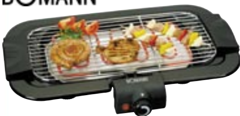
Artikel: K-220 - Bomann Barbeque-Tischgrill

Tischgrill im stilvollen Design zum Grillen ohne Feuer und Rauch. Dieser Tischgrill hat einen sicheren Stand, stufenlos regelbarer Thermostat mit Kontrollleuchte, verchromter Grillrost, Grillrost und Heizelement abnehmbar zum leichten Reinigen und Metall Auffangschale.