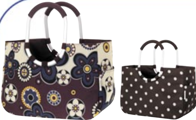
Artikel: P-130 - Reisenthel Loopshopper L Farben: marigold und mokka dots

100% alltagstauglich, aber alles andere als alltäglich: Der Loopshopper L präsentiert mit seinen langovalen, gepolsterten Tragehenkeln aus stabilem Aluminium eine aufregende Silhouette und lässt sich damit ebenso komfortabel über der Schulter wie in der Hand tragen.