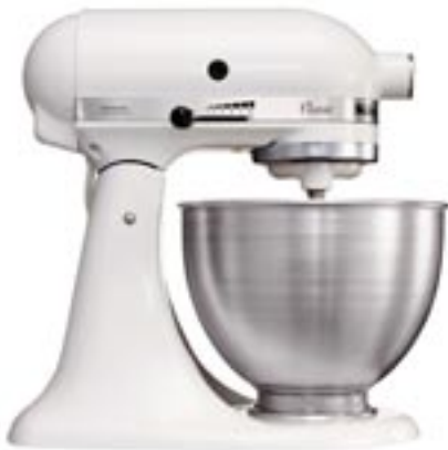
Artikel: K-90 - KitchenAid Küchenmaschine „Classic“

Hohe Vielseitigkeit, exzellente Qualität und markantes Design haben die KitchenAid Classic zu einem beliebten Küchenhelfer gemacht. Mit Knethaken, Flachrührer, Schneebesen, 4,28 Liter-Edelstahl-Schüssel.