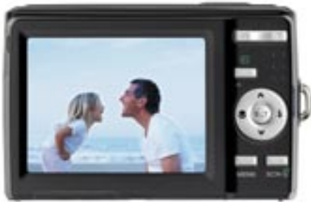
Artikel: KA-100 - AGFA Digitalkamera

10.0 MegaPixel CCD Sensor, 3x optischer Zoom, 2,7" TFT LCD Display, Gesichtserkennung, Digitaler Stabilisator, Lächelerkennung, Blinzelerkennung, Motivmodus, TV-out PAL/NTSC, automatisches Abschalten, 32 MB interner Speicher, SD Karten-slot für bis zu 4 GB SD-Karten; SDHC bis zu 32 GB, Foto-Auflösung: 3648 x 2736, Video-Auflösung: 720 x 400