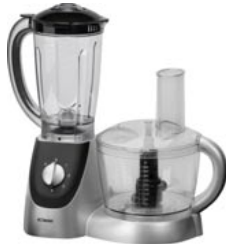
Artikel: K-363 - Bomann Küchenmaschine