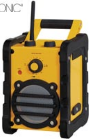
Artikel: BE-384 - Clatronic Baustellenradio

Robustes UKW/MW Baustellen/Werkstatt radio, Stoßfest und Spritzwassergeschützt, 2-Band Radio (UKW/MW), MP3 Line IN - zum Anschluss an PC, Notebook, MP3-Player, Cassetten Player, CD-Player etc. über den Kopfhörerausgang der Geräte, Flexible Antenne, Lautsprecherregelung, 3 verschiedene Drehregler für Einstellungen (Lautstärke/Frequenz/UKW/MW), 1 x 20 Watt PMPO, Tragegriff, Bereitschaftsanzeige, Stromversorgung über AC/DC Adapter oder Batterie 230 Volt, 50 Hz, AC/DC Adapter oder Batteriebetrieb: 4 Baby Batterien (Batterien nicht im Lieferumfang enthalten)