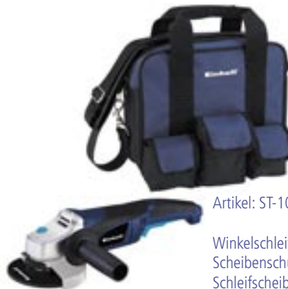
Artikel: ST-100 - Einhell Winkelschleifer Set

1 Aufnahme für Schleifbänder, 1 Aufnahme für Trennscheibe, 3 HSS-Gravierstifte, 2 Diamant-Gravierstifte, 6 HSS-Bohrer, 1 Filz-Polierbürste, 1 Schraubendreher / Ringschlüssel, 4 Schleifbänder, 10 Trennscheiben, 1 Kreissägeblatt, 5 Schleifstifte, 1 Messingbürste, 1 Stahlbürste, 1 Nylonbürste und 3 Aufnahmen 1,5 - 2,35 - 3,2 mm