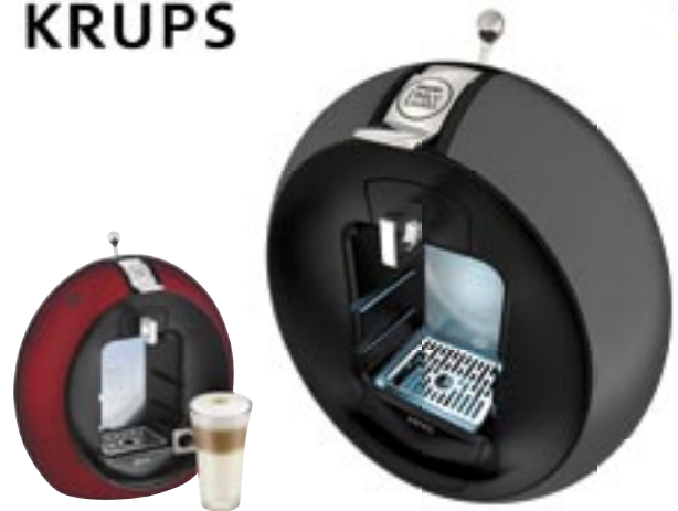
Artikel: K-357 - Krups NESCAFÉ Dolce Gusto Circolo Farben: schwarz und rot