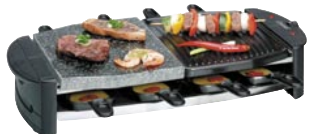
Artikel: K-189 - Bomann Duo Raclette-Grill

2 in 1 Raclette-Grill mit 1.300 Watt zum Grillen und Überbacken. Grillplatten und „Heisser Stein“ abnehmbar, 8 Pfännchen, Antihaft-Beschichtung bei Grillplatten und Pfännchen leicht zu reinigen, Stufenlos regelbarer Thermostat mit Kontrolleuchte. Leistung: 1.300 Watt