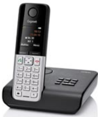
Artikel: X-430 - Siemens Gigaset C300A mit AB

Erweiterbar auf bis zu 4 Mobilteile, Feldstärkeanzeige, Halbduplex Freisprechen, Rufton an Mobilteil, Telefonbuchtransfer zwischen Mobilteilen, ECO-DECT Standard, Strahlungsarm, DECT-/GAP-fähig, Reichweite im Freien bis zu 300 m, Reichweite in Gebäuden bis zu 50 m, Anruferanzeige (CLIP), Anruferliste, Anzeige Datum/Uhrzeit, Anzeige Gesprächsdauer, Kurzwahlspeicher: 9 Telefonnummern, Hörerlautstärke einstellbar, Lautsprecher, Stummenschaltung möglich, Bis zu 250 Telefonbucheinträge, Wecker, Wandmontagefähig, Klingellautstärke einstellbar, Aufnahmesystem: integrierter Flashmemory, Aufzeichnungskapazität 25 Minuten, 1 Voreingestellte Ansagen, 1 Individuelle Ansagen, Ansagetext bis zu 170 Sekunden, Aufzeichnungslänge pro Anruf bis max. 180 Sekunden, Sprachgesteuerte Aufzeichnung, Gesprächsmitschnitt, Zeitstempel, Bedienung via Basis, Bedienung via Mobilteil, Fernabfrage möglich