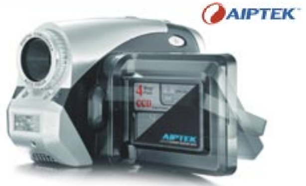
Artikel: KA-80 - Aiptek digitaler Camcorder

Maße: ca. 10,0 x 5,4 x 3,5 cm Gewicht: ca. 105,0 g