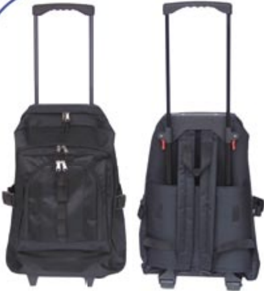
Artikel: PP17/1 - Trolley-Rucksack

Trolley und gleichzeitig Rucksack mit Rollenschutz und stufenlos verstellbarem Zuggriff, strapazierfähiges 600 D Nylon, 2 aufgesetzte Reißverschlusstaschen.