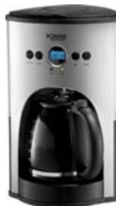
Artikel: K-362 - Bomann Kaffeautomat