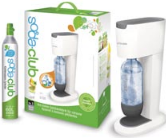
Artikel: K-299 - Soda-Club "Genesis"

soda-club Die neue Getränkemaschine für zuhause