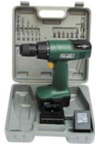
Artikel: ST-553 - Akkuboehrschrauberset im Koffer, 17-tlg.

17-tlg. Akkuboehrschrauberset im Koffer 18,0 Volt, stufenlose elektr. Drehzahlregulierung 0-550 U/min., 6 Drehmomentstufen, Rechts-/Linkslauf, Schnellspannfutter, Wechselakkusystem. Inkl. Ladestation, Bohrer- und Schraubendrehaufsatz.