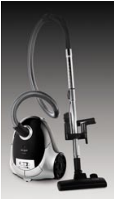
Artikel: K-370 - DirtDevil Bodenstaubsauger "Skuppy"