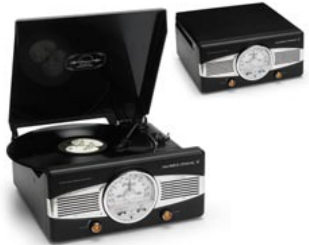
Artikel: BE-246 - Lenco Plattenspieler mit Radio

Plattenspieler 33/45 RPM, MW/UKW Stereo-Radio, Verstärker, 2 eingebaute Lautsprecher, Line out, 3,5 mm Kopfhöreranschluss.