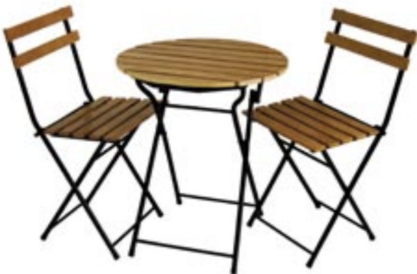
Artikel: M-305 - Bistro-Tisch mit 2 Stühlen

Bistro-Tisch mit 2 Stühlen aus Eschenholz, Stahlrahmen in schwarz, Tisch und Stühle zusammenklappbar.