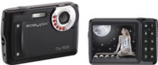
Artikel: KA-510 - EasyPix Digitalkamera „NightVision“