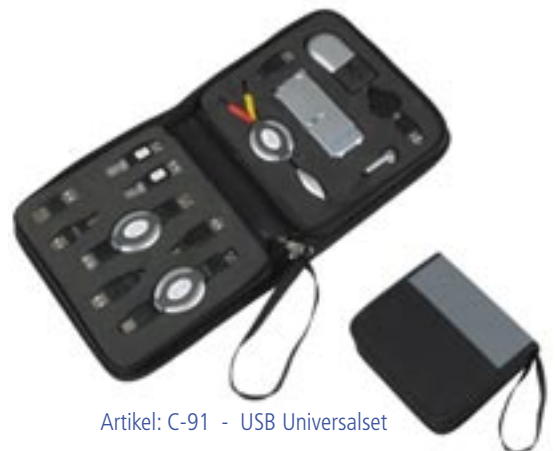
Artikel: C-91 - USB Universalsset

USB Universalsset bestehend aus: - Mini optischer Maus, ausziehbar - Ohrhörer, ausziehbar - USB Hub mit 4 Anschlüssen - USB A/M nach A/F Kabel - IEEE 1394 nach 1394 Kabel - USB A/M nach mini 5P - USB A/M nach A/M - USB A/M nach BM - USB A/M nach mini 4P - IEEE 1394 Firewire - 2 Stück A/F nach RJ45