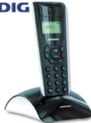
Artikel: X-203 - Grundig Telefon Selio 1

Das SELIO 1 überzeugt durch Zuverlässigkeit und Einfachheit. In dem Telefonbuch lassen sich bis zu 40 Kontakte verwalten und die Clip-Funktion zeigt Ihnen, wer anruft. Ein beleuchtetes Display und die übersichtliche Tastatur sorgen für einfache Bedienbarkeit. Darüber hinaus sorgt das energiesparende Netzteil für einen geringeren Stromverbrauch. Grundig SELIO, das DECT-Telefon mit energiesparender Leistung! Display mit „Amber“ Hintergrundbeleuchtung, Energiesparende Leistung, 1 Textzeile & 1 Symbolzeile, GAP kompatibel (bis zu 5 Mobilteile), Stummschaltung, 5 Klingeltöne an der Basis, 5 Klingeltöne am Mobilteil, bis zu 50 Telefonbuch-Einträge, Anruferidentifikation (CLIP), Anruferliste: bis zu 20 Einträge, Wahlwiederholung, Konferenz-Funktion, Rufweiterleitung zwischen 2 Mobilteilen, Interkom-Funktion, Paging (Mobilteilsuche), Weckfunktion, Tastatur-Sperre, Bereitschaftszeit bis zu 100 Stunden, Gesprächszeit bis zu 10 Stunden, Reichweite bis zu 300m im Freien, bis zu 50m in Gebäuden