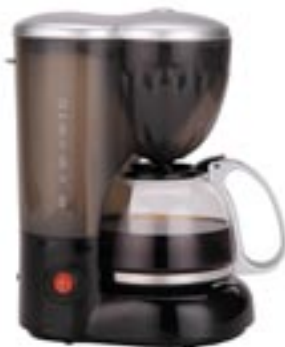
Artikel: K-80 - Kaffeemaschine

Kaffeemaschine für 1 oder 2 Tassen mit auswaschbarem Kaffeefilter, An-/Aus-Leuchte, Anti-Tropfschutz, ergonomisch tragbares Design und Warmhalteplatte. Einfacher und schneller Kaffeegenuss!