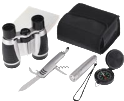
Artikel: SP-237 - Outdoor-Set „Free“

Dieses praktische Etui mit Gürtelschleife enthält alles, was man an einem Tag im Freien gebrauchen könnte: Fernglas 4 x 30 mit Reinigungstuch, Taschenmesser, Taschenlampe, Kompass und Regenponcho. Batterien für die Taschenlampe im Lieferumfang enthalten (1x UM4).