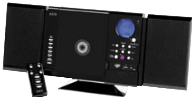
Artikel: BE-215 - AEG Musik-Center