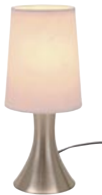
Artikel: L-78 - Tischlampe "Touch me"

Maße: Höhe ca. 36,0 cm Schirm Durchmesser ca. 18,0 cm Boden Durchmesser ca. 15,0 cm