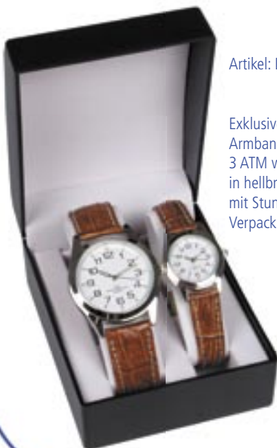
Artikel: DH-50/2 - Damen- und Herren-Armbanduhrset

Exklusives Set aus Damen- und Herren Armbanduhr im klassischen Design, 3 ATM wasserdicht, echtes Lederarmband in hellbraun, hochwertiges Quartz Uhrenwerk mit Stunden-, Minuten- und Sekundenzeiger Verpackung: Ansprechende Geschenkbox