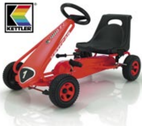
Artikel: SP-302 - Kettler Kettcar „Melbourne“

Mit diesem Kettcar kommen schon die Kleinsten mühelos voran. Hochwertiger Stahlrohrrahmen mit kratzfester Polyesterbeschichtung, zuschaltbarer Freilauf, auf die Hinterräder wirkende Handbremse. Ohne Werkzeug einstellbarer, ergonomisch geformter Schalensitz mit Wirbelsäulenpolster. GS-zertifiziert für geprüfte Sicherheit und empfohlen für Kinder von 3 - 5 Jahren.